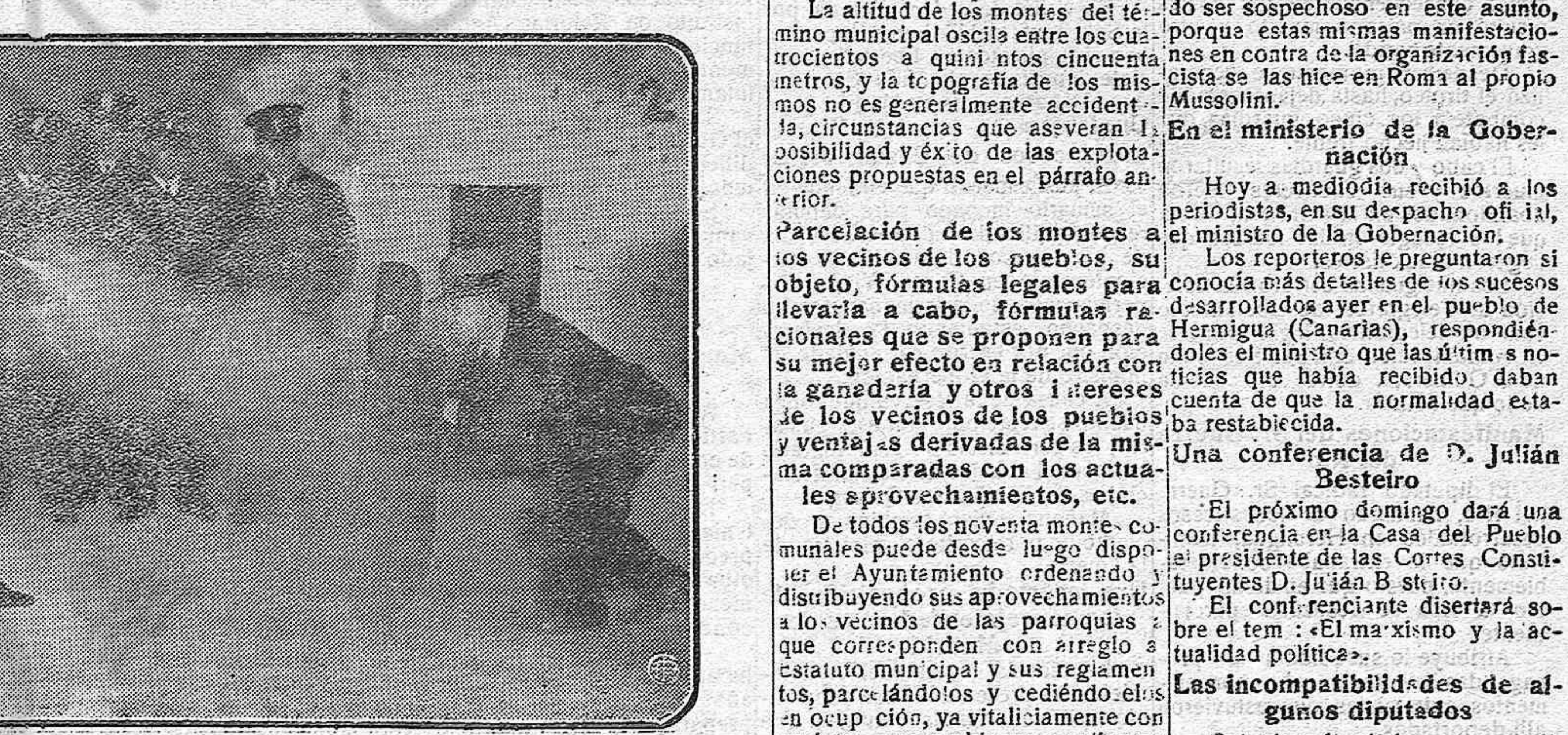
La policía norteamericana ha ensayado unas corazas protectoras que hacen invulnerables a sus agentes a la acción de las balas.