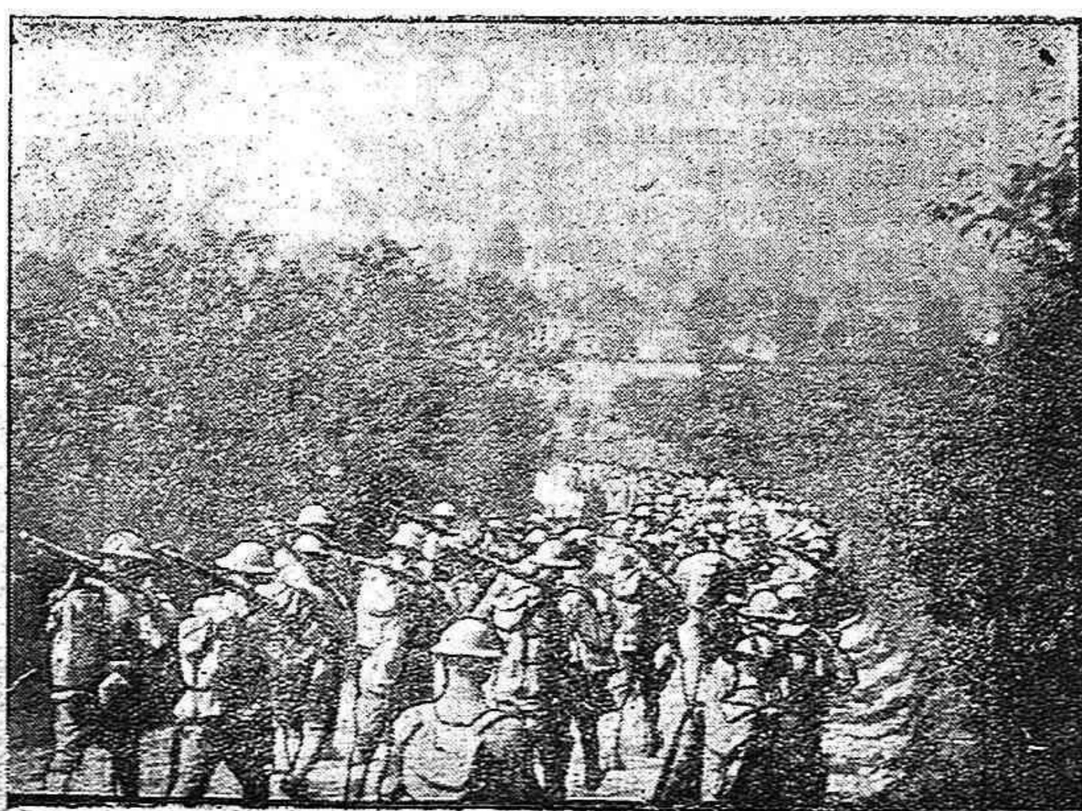
Tropas americanas en Francia