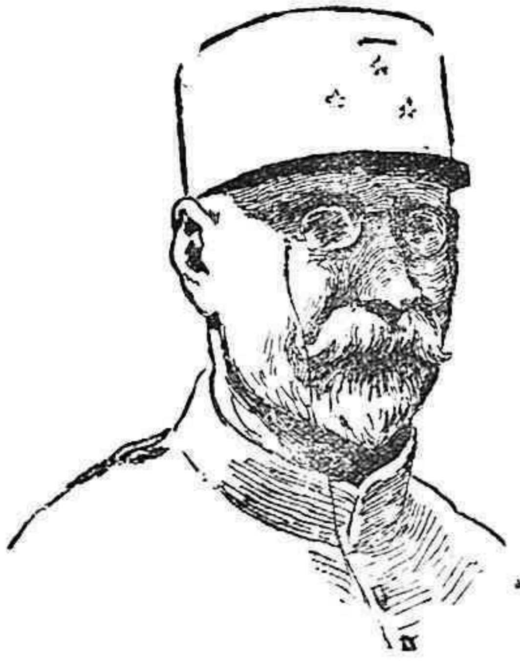
GENERAL MICHELER, divisionario francés en el frente del Mossa.