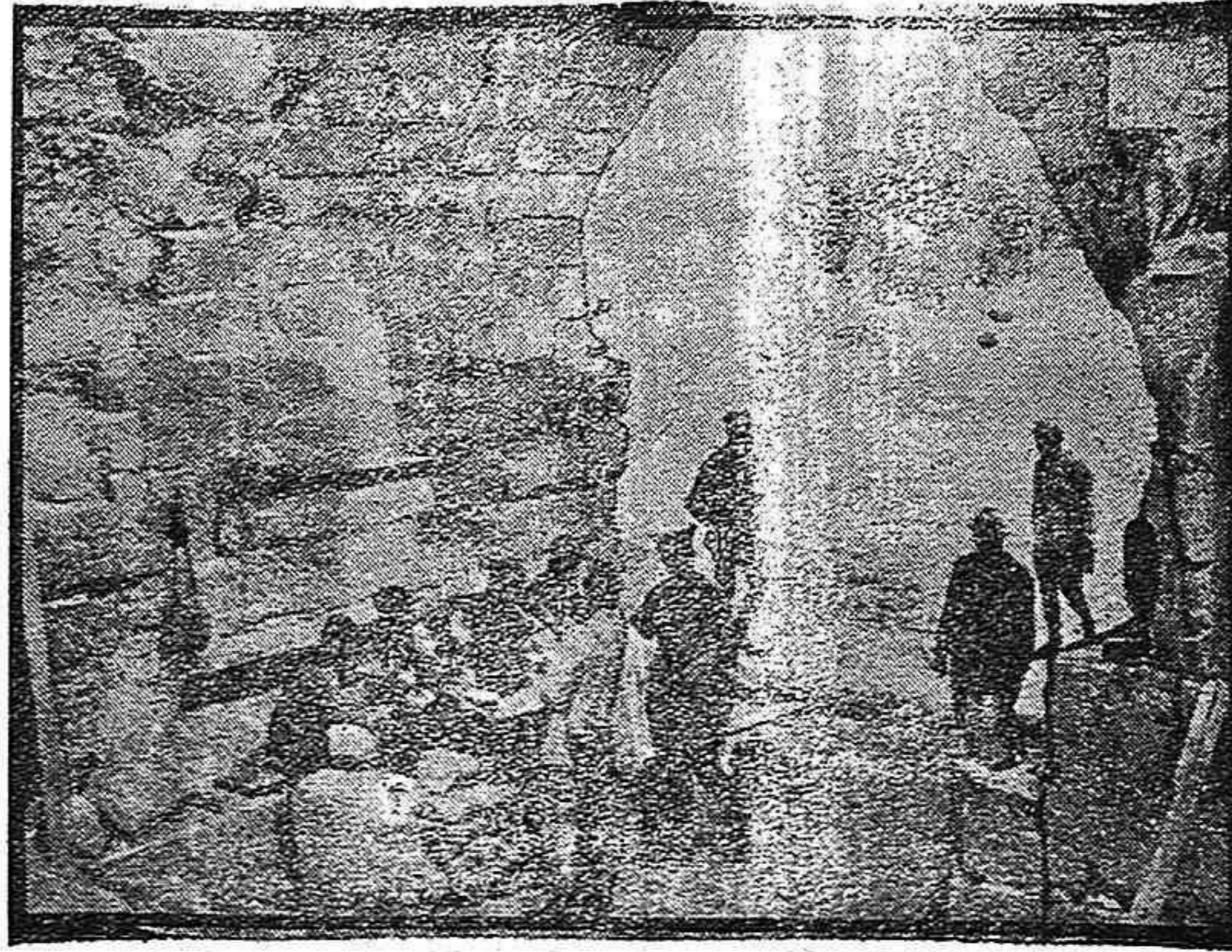
En las ruinas del Castillo de Coucy