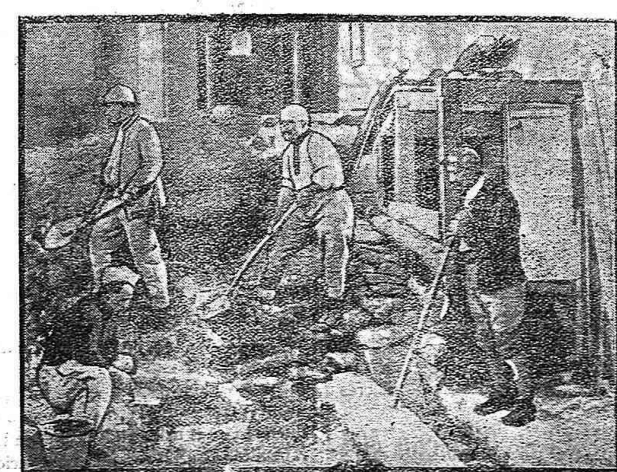
Soldados abriendo una mina en una iglesia

Consulta en Coruña todos los días, de diez a una y de dos a cuatro. RIEGO DE AGUA, 17-3.º