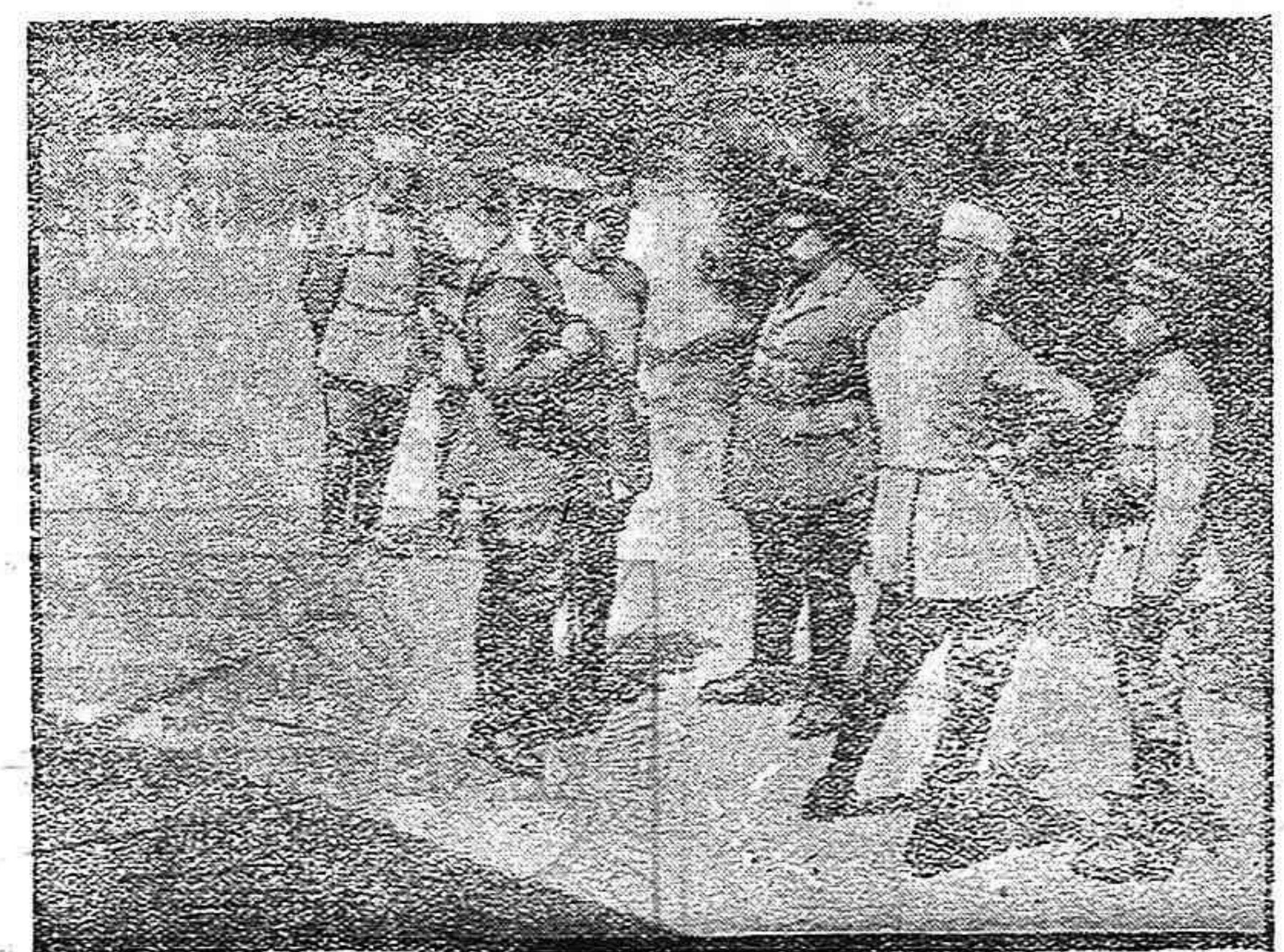
El general Lloyd, gobernador militar de Londres visitando el frente francés

Las localidades se expenden desde las tres de la tarde en la taquilla del Teatro-Circo.