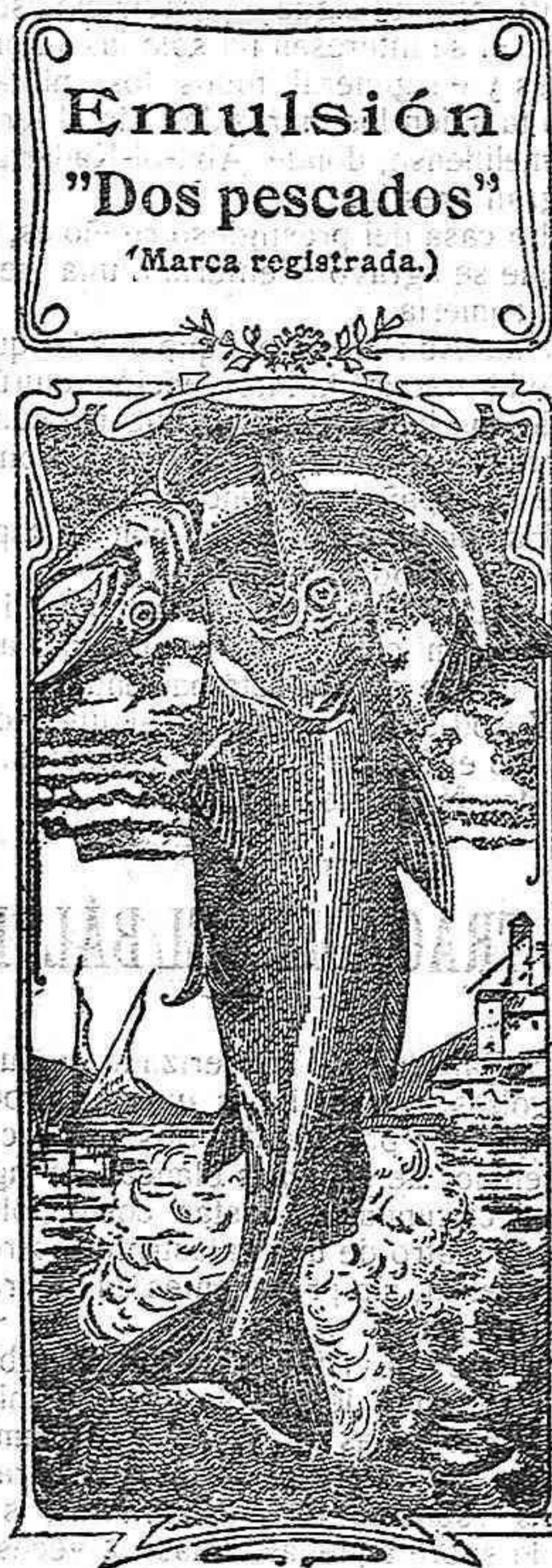
Emulsión "Dos pescados" (Marca registrada.)

Médico-Cirujano y Odontólogo (DENTISTA) ARMAÑA, 3 Y 5, 2.º La última palabra Nos referimos a una nueva y excelente preparación de Emulsión «DOS PESCADOS» (marca registrada) la que compete con todas las extranjeras y españolas, tanto en calidad como en precio. Depositarios: por menor, Farmacia y Laboratorio de Iglesias. Por mayor, Droguería de Iglesias y Compañía.