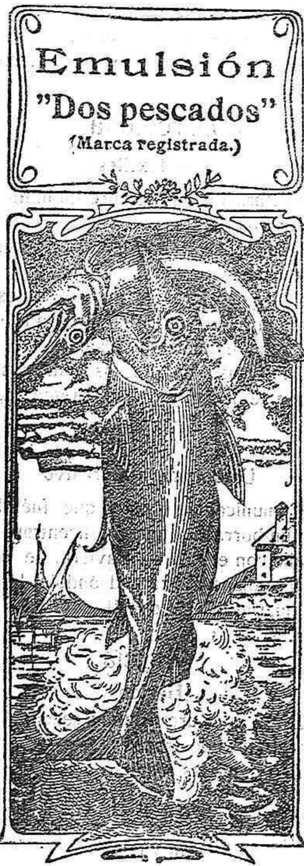
Emulsión "Dos pescados" (Marca registrada.)

ARMANA, 3 Y 5, 2.º La última palabra Nos referimos a una nueva y excelente preparación de Emulsión «DOS PESCADOS» (marca registrada) la que compete con todas, las extranjeras y españolas, tanto en calidad como en precio. Depositarios: por menor, Farmacia y Laboratorio de Iglesias. Por mayor, Droguería de Iglesias y Compañía.