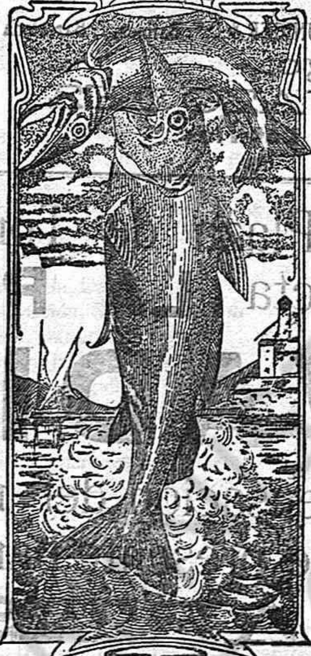
La última palabra

Nos referimos a una nueva y excelente preparación de Emulsión «DOS PESCADOS» (marca registrada) la que compete con todas, las extranjeras y españolas, tanto en calidad como en precio.