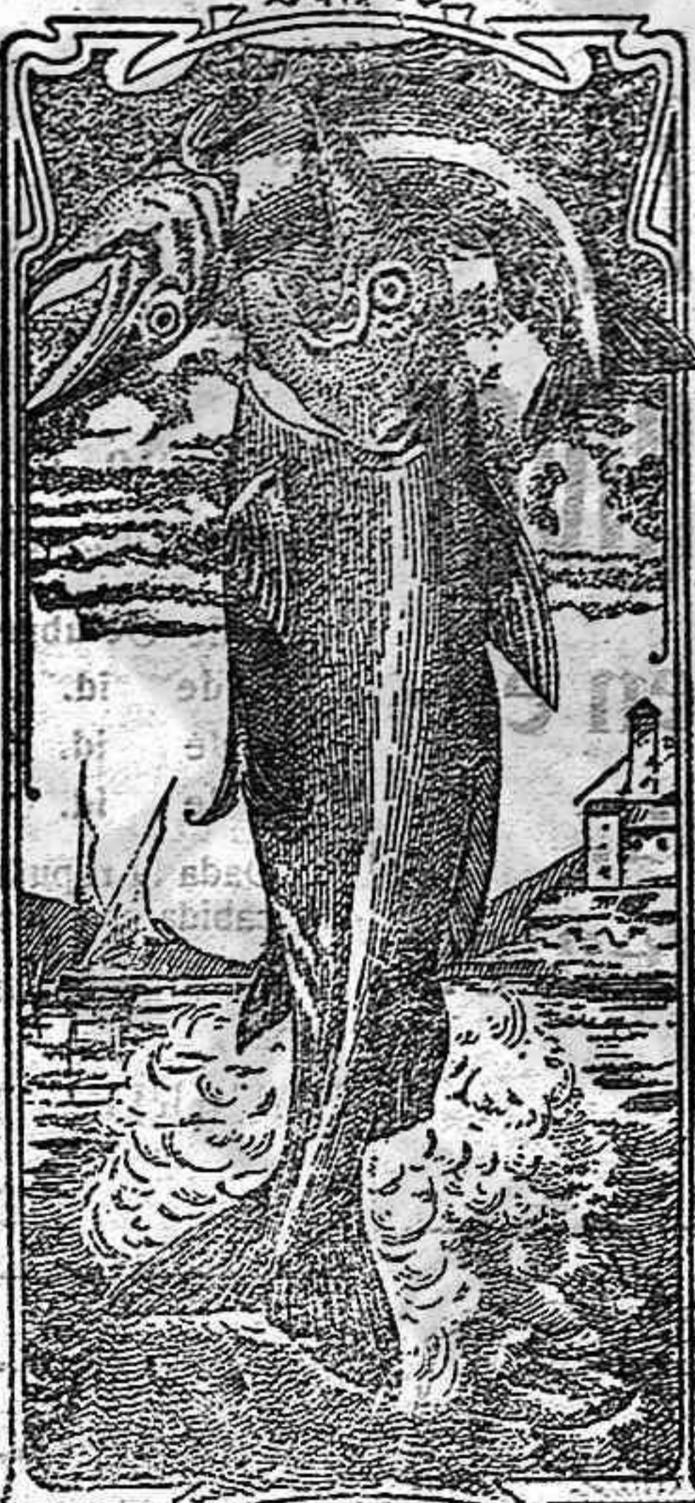
La última palabra