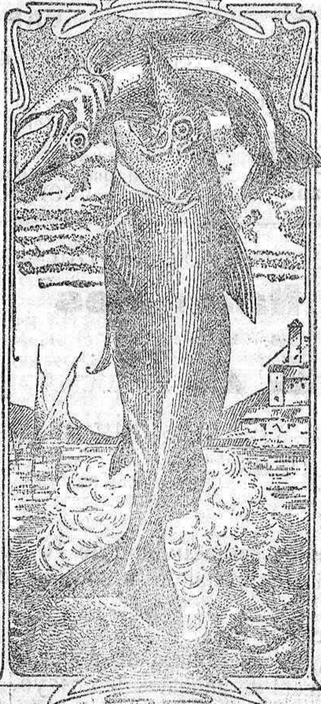
La que en menos tiempo alcanzó

Emulsión "Dos pescados" (Marca registrada.)