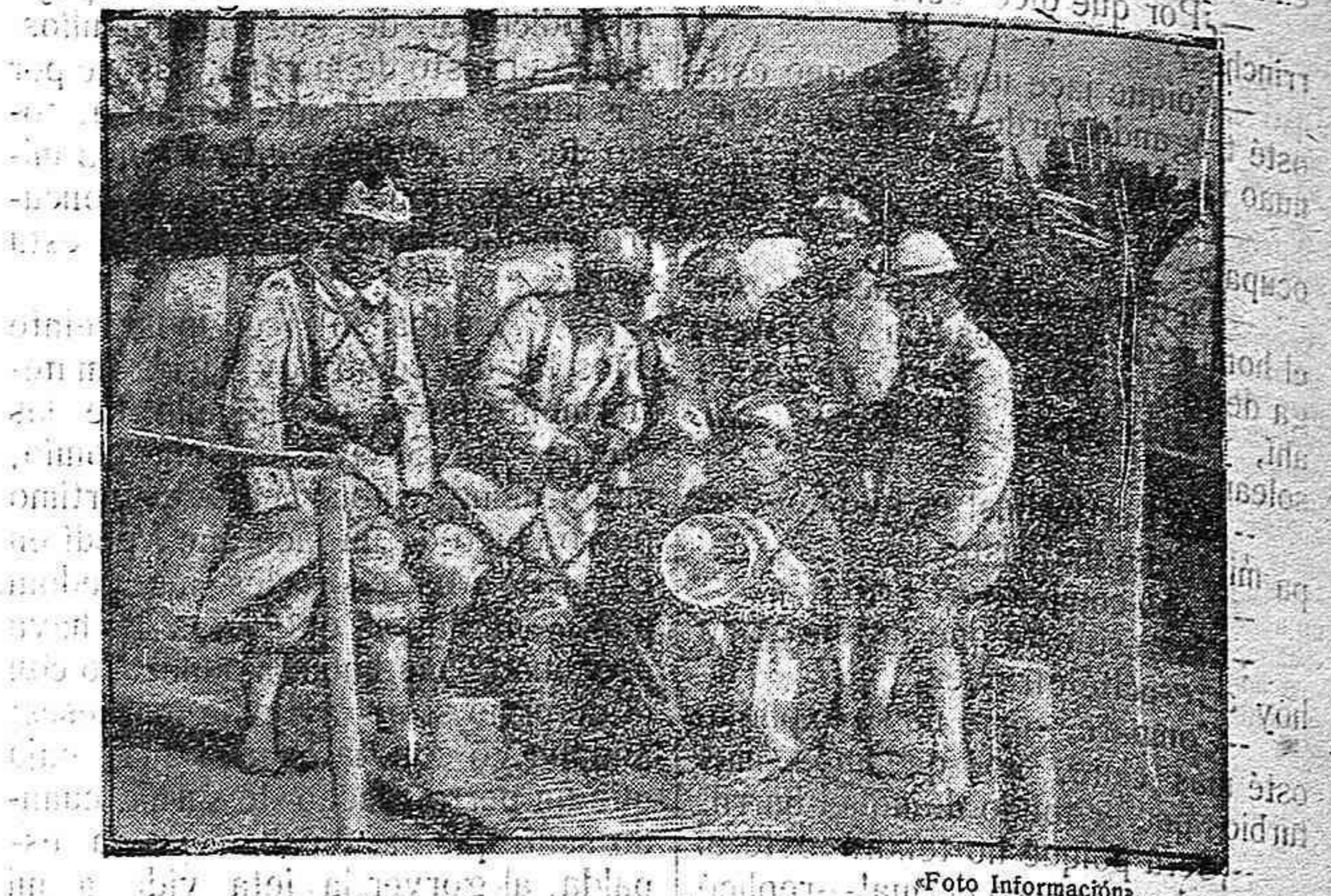
Señales a distancia con reflectores.

Sobre el pueblo de Silla, de la provincia de Valencia, descargó un fuerte pedrisco, que arrasó casi por completo los sembrados, ocasionando pérdidas de gran importancia.