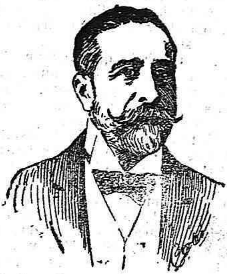
Ex ministro recientemente fallecido