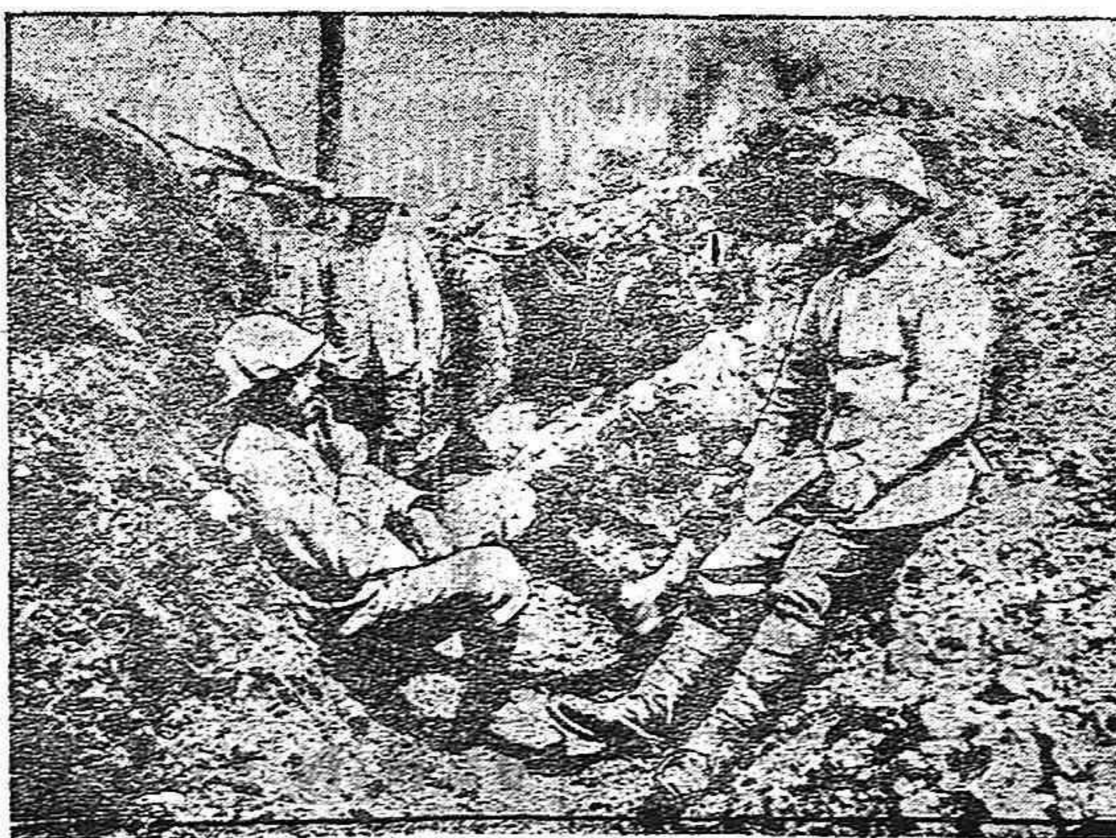
Soldados franceses en una trinchera tomada a los alemanes