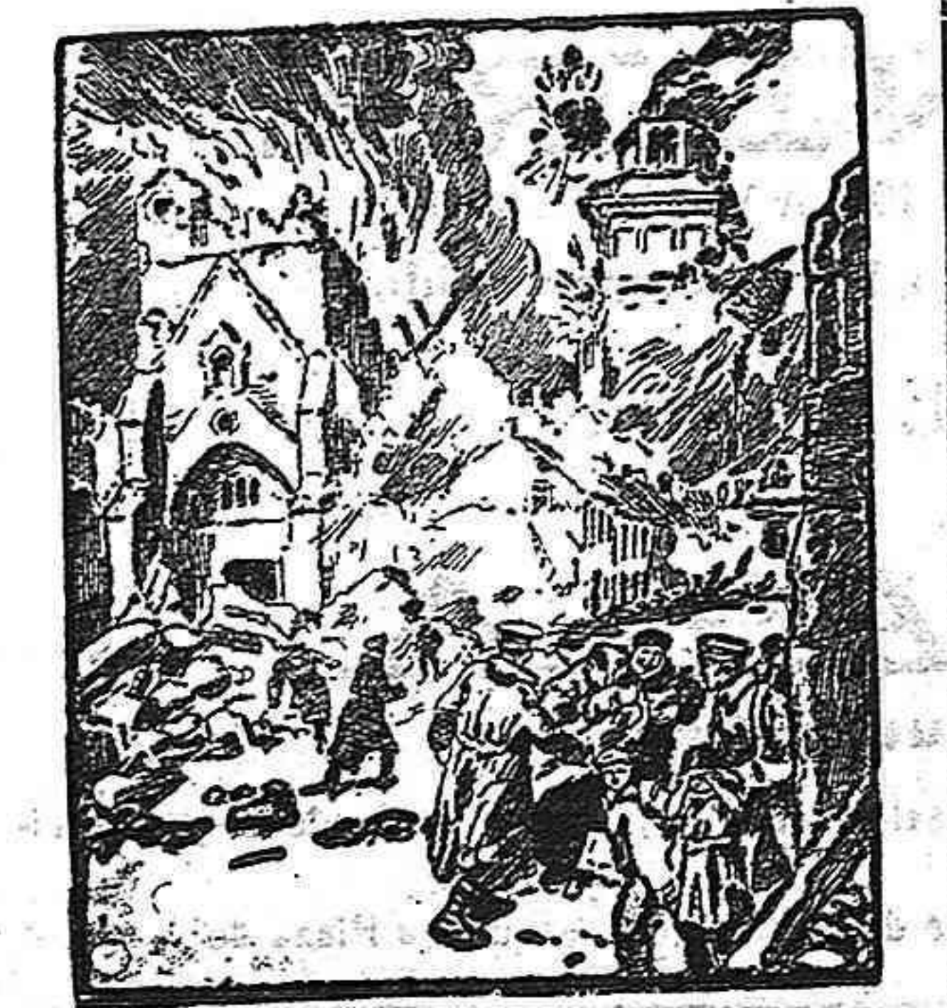
Dstrucción de la torre de los Templarios de la Catedral de Nieuport.