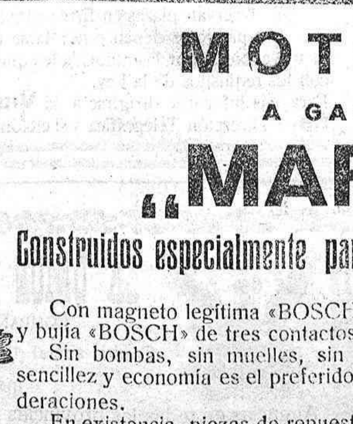
Fuerza 5 y 7 HP. Efectivos Con Radiador