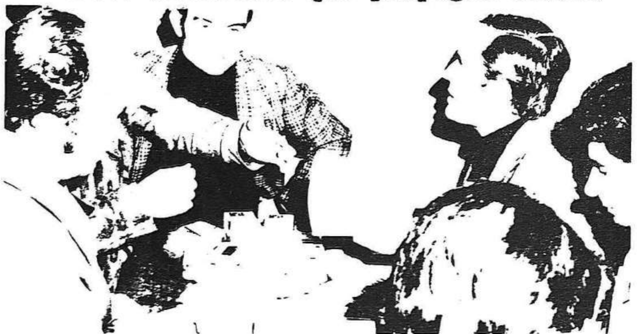
UN MOMENTO DE LA ENTREGA DE CARNETS

Las impresiones que fueron sacadas más importantes de la presente Asamblea, fue de la que cada militante de CC.OO. se responsabilizaría de hacer una campaña para la captación de militantes al Nuevo Sindicato que propugna CC.OO.