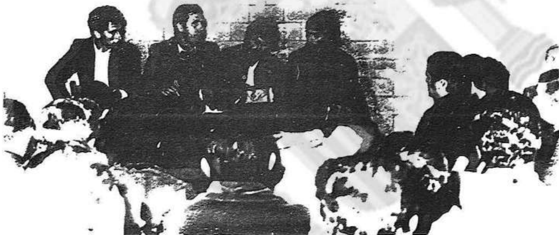
UN MOMENTO DE LA ASAMBLEA

Los trabajadores de SECEM, previo conocimiento del Sindicato de Nuevo Tipo - que propone CC. OO., la afiliación ha comenzado en un ambiente de responsabilidad ante la posible anulación del Sindicato Vertical y fundación de Sindicatos controlados por el mismo, que en un futuro pudieran ofrecer.