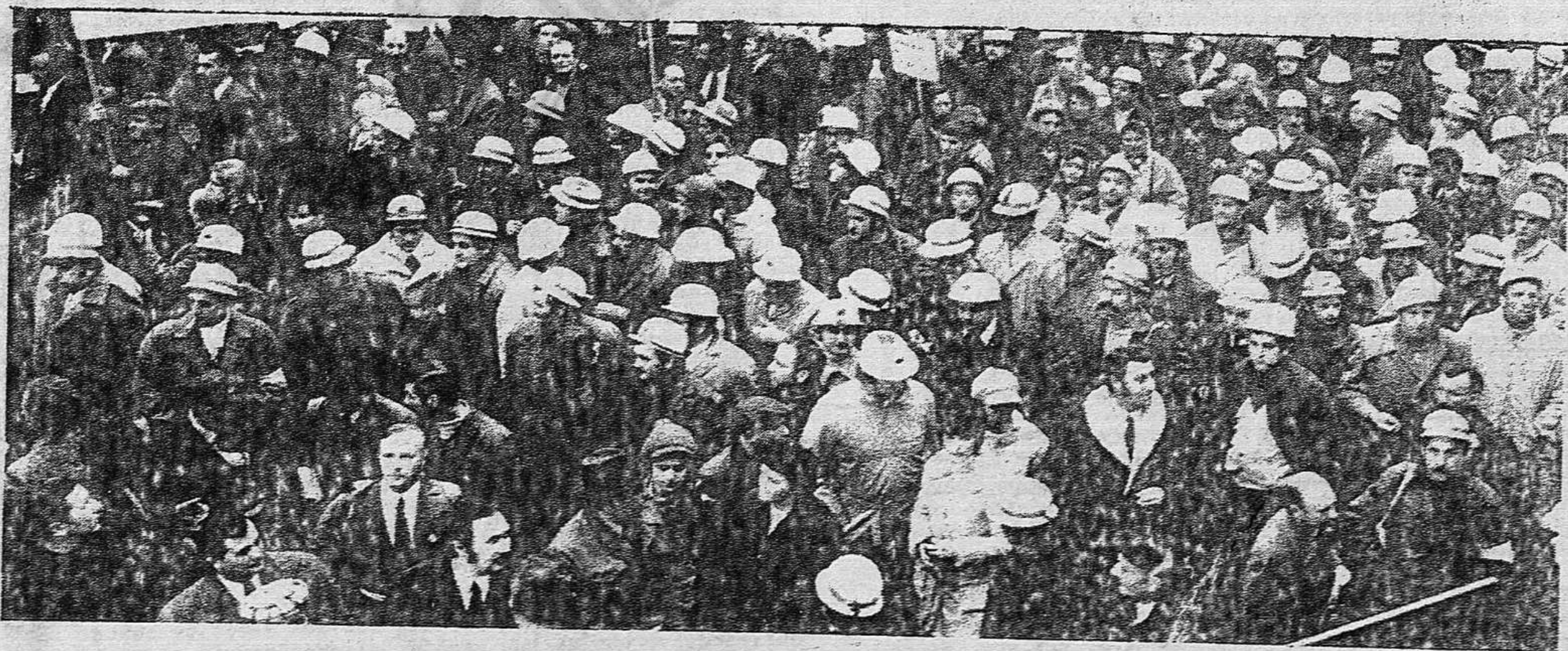
Es insoportable... la degradación de las condiciones de trabajo y de vida...

--es insoportable la cadena de ataques que tras va-- rios años de degradación de las condiciones de traba-- jo y de vida comportan nuevos trallazos del alza del coste de la vida, desbordando ampliamente los sala-- rios impuestos por los convenios de la patronal y de la CNS; las reestructuraciones de plantilla, el creci--