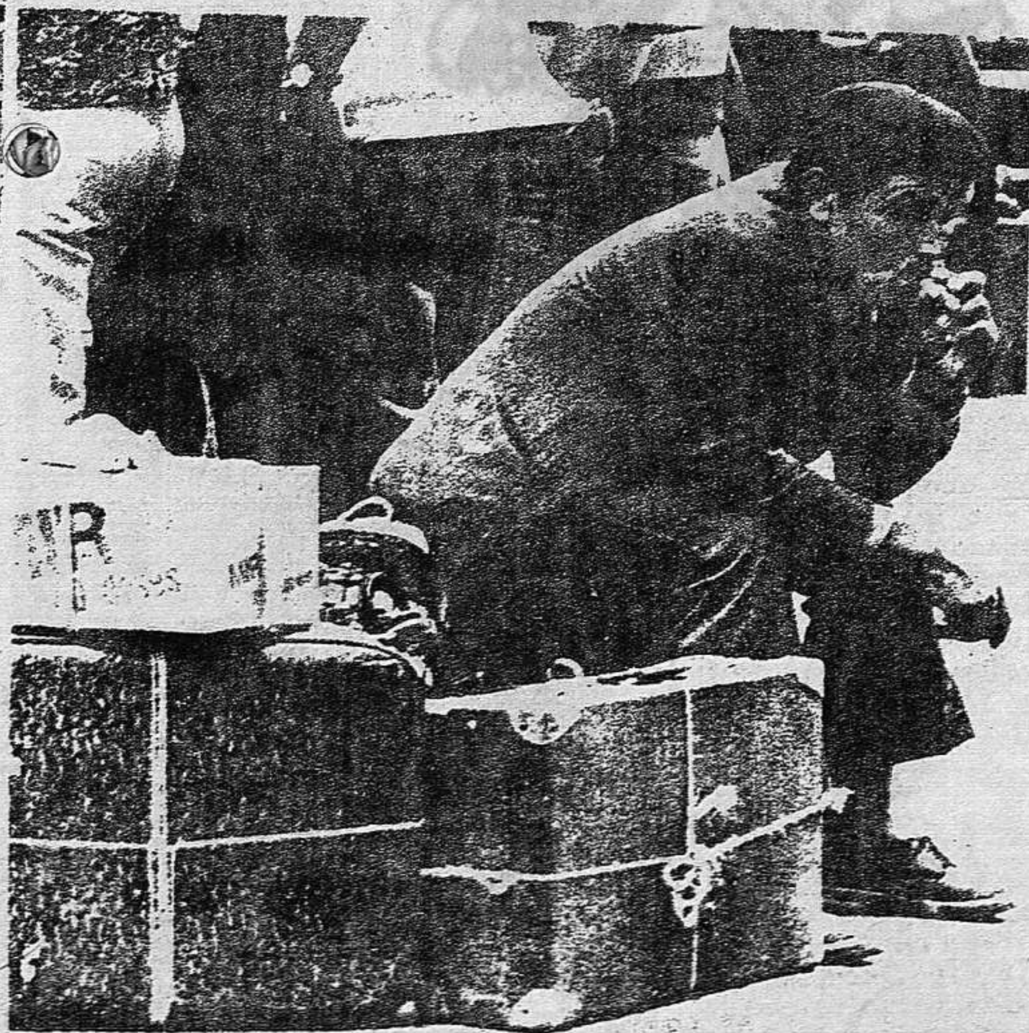
El gran capital avanza (...) hacia un crecimiento del paro mucho mayor aún.

El gran capital avanza a ritmo cada vez mas rápido hacia un crecimiento del paro mucho mayor aún. Pretende hacer encajar con el paro, y aprovechando el temor de los trabajadores a éste, nuevos aumentos de ritmos y nuevos recortes a los salarios. Pues las alzas de precios, tras la escalada reciente, no van a quedarse en el aumento del pan, la leche y otros productos básicos. Los capitalistas se disponen a tomar pretexto de la subida inminente de la electricidad y de posteriores aumentos de los productos petrolíferos para dar nuevos tirones a los precios de todos los productos.