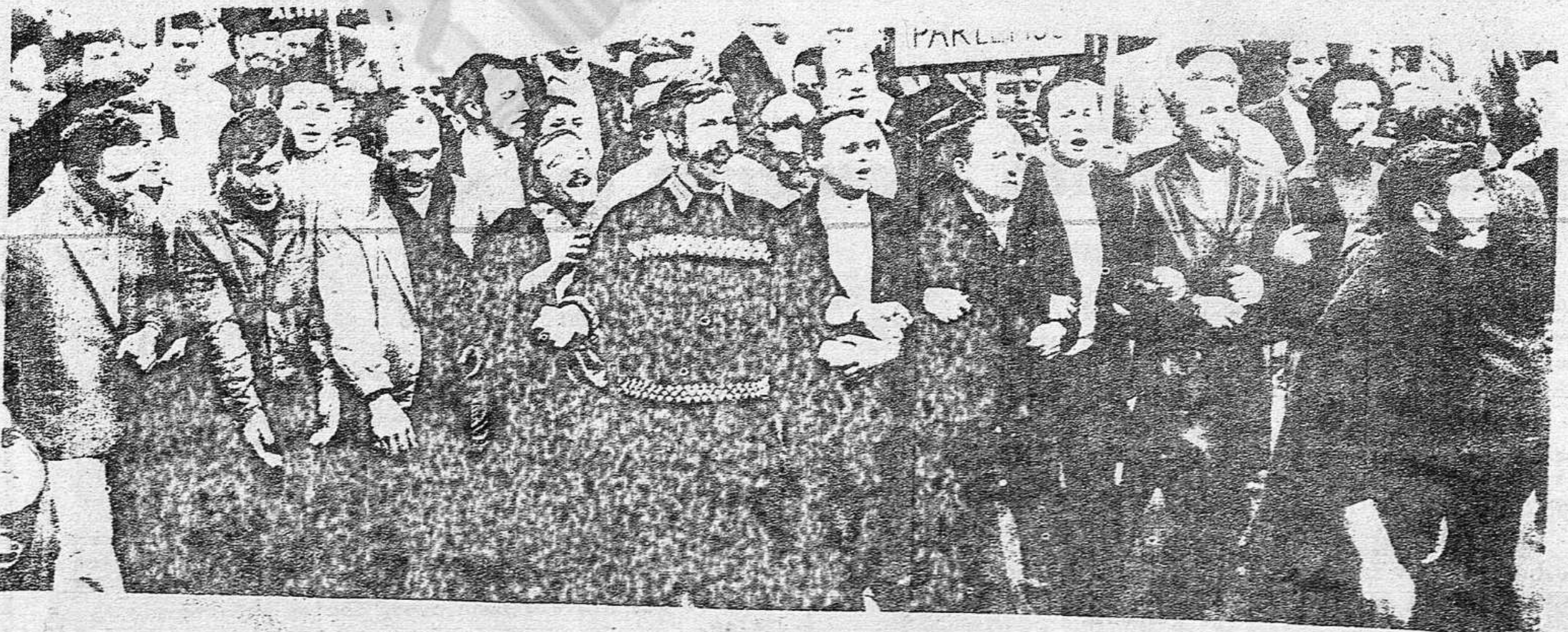
uniendo en un solo puño las enormes fuerzas en lucha...

Es más grave si tenemos en cuenta las repercusiones internacionales. Un avance decidido hacia la Huelga General en el Estado español sería un refuerzo para ese pujante movimiento obrero que se alza en Europa y concretamente haría más difícil a la burguesía la preparación de un golpe militar fascista en Portugal. Un revés en el Estado español se uniría a los grandes problemas del proletariado portugués para actuar como freno en el avance de la clase obrera en Europa y en todo el mundo.