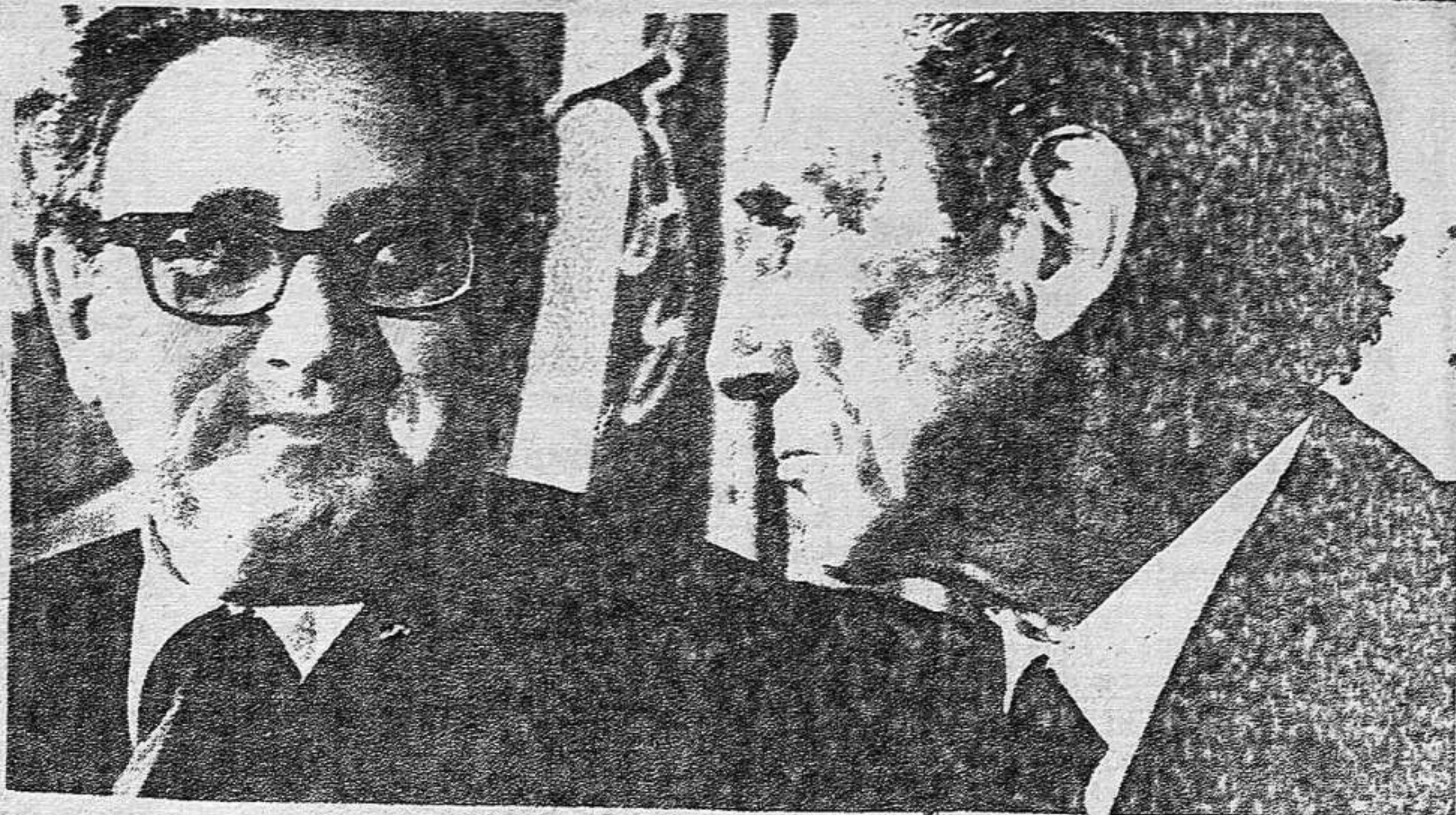
Kissinger y Cortina...