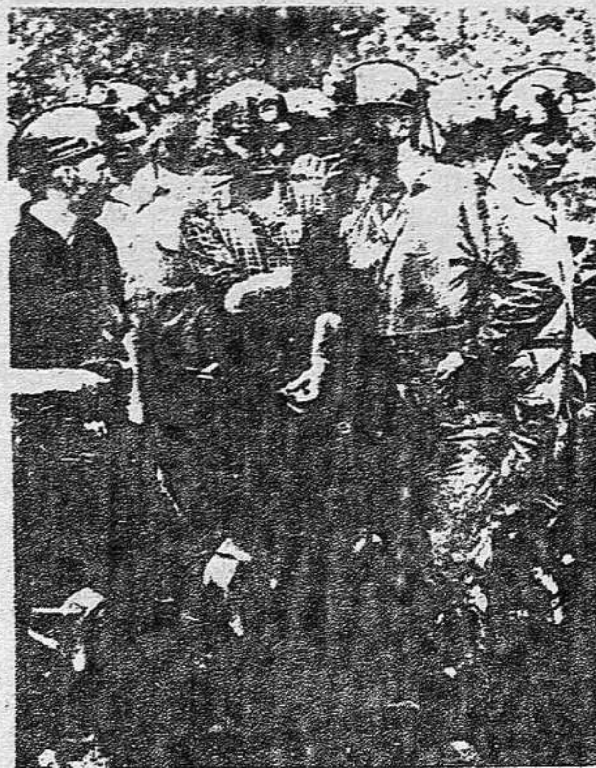
Trabajadores con duras condiciones de trabajo... aportan batallones radicalizados al combate

En consecuencia, a través de estas luchas pugnan por abrirse paso los OBJETIVOS UNIFICADORES de todo el proletariado y de toda la población oprimida, a pesar de las divisiones que el enemigo de clase intenta mantener y a las que colabora la línea de las direcciones reformistas del movimiento obrero. La tendencia a po-