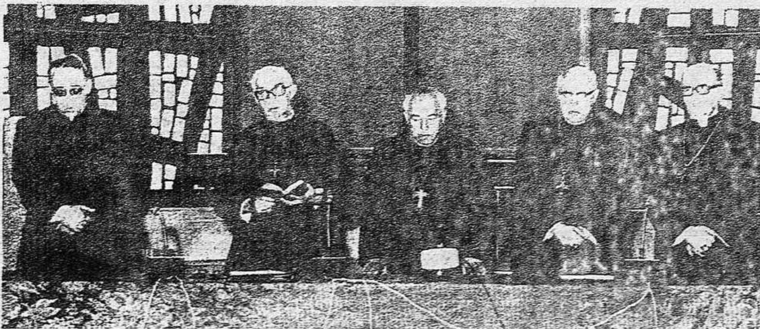
Las campañas de la Iglesia sobre amnistía... tampoco dan la talla.

--El mismo deterioro del franquismo que le impide ampliar realmente el juego político legal se expresa en una rigidez creciente de los mecanismos de ajuste entre las diversas componentes del Régimen con las que el bonaparte Franco ha ido manteniendo el equilibrio entre ellas. Durante todo el año han sido evi-