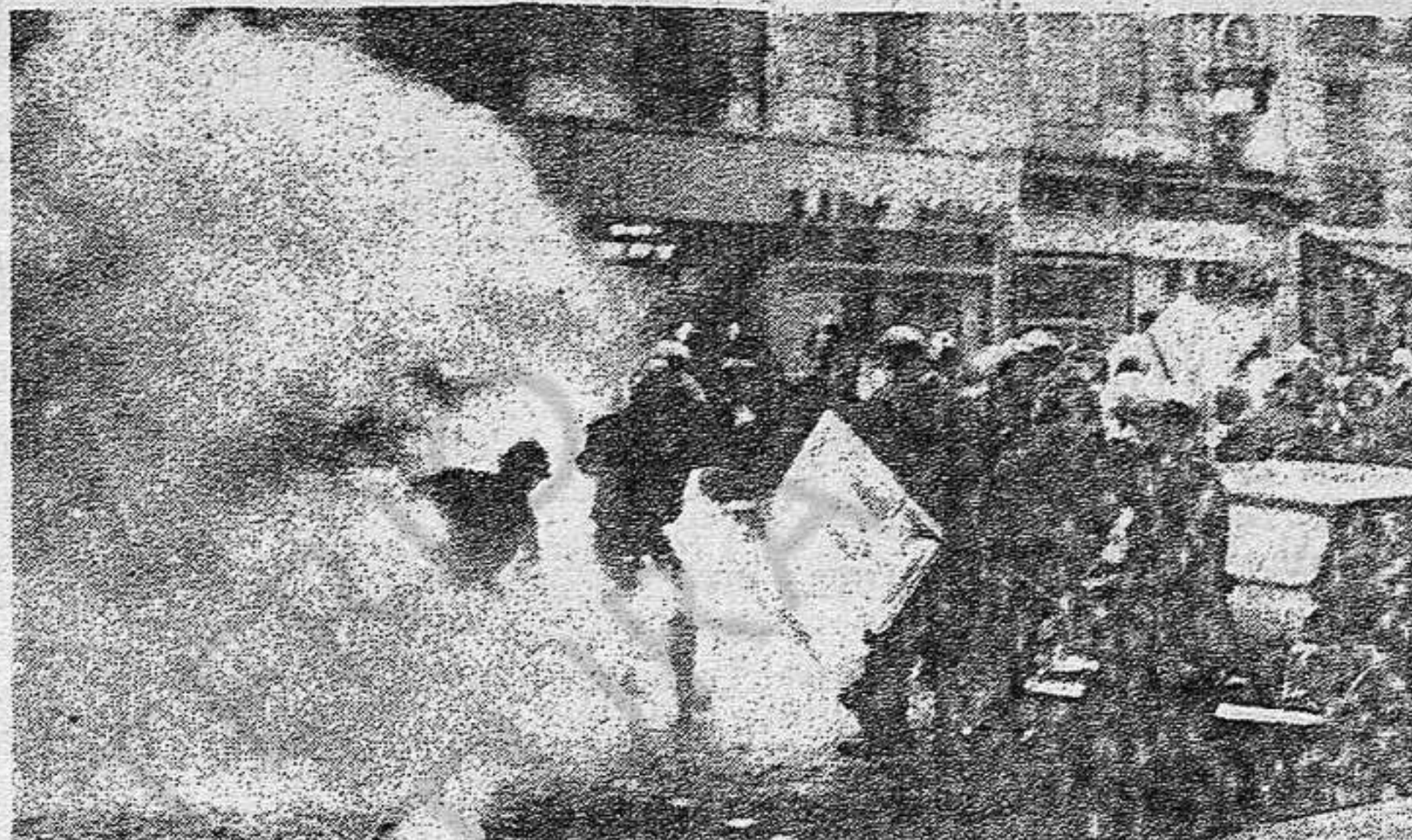
Más que nunca, los monopolios y su Gobierno se apoyan en los cuerpos represivos.

En efecto: más que nunca, los monopolios y su Gobierno se apoyan en los cuerpos represivos, pero esto pone en peligro cada vez mayor el intento de preservar al Ejército de la intervención directa contra las masas. A medida que esta perspectiva se perfila, se esbo-