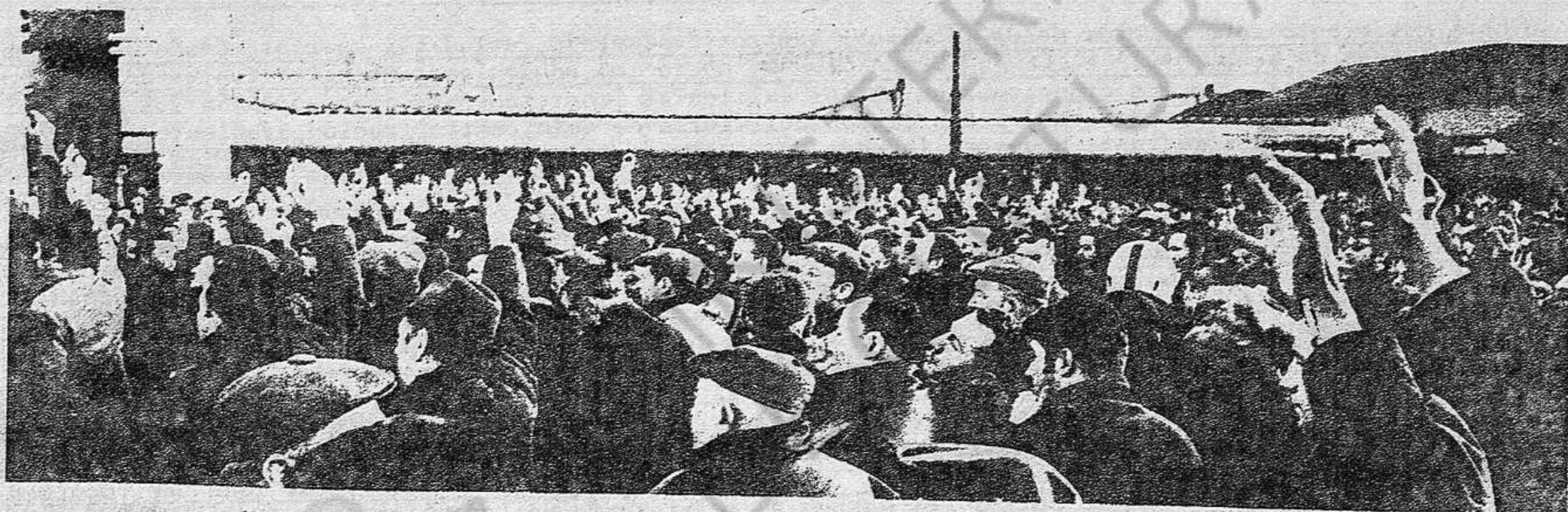
...formas de acción y organización independiente de masas,...

Por otra parte, nuestro partido, a lo largo de dos años de lucha por superar la impotencia capituladora de las falsas alternativas a la línea dominante en el movimiento obrero, ha concentrado esfuerzos en la plasmación del programa de acción que corresponde a esas exigencias. La experiencia de los pasos y los vacíos de nuestro esfuerzo, confrontado a las exigencias crecientes de la agudización de la lucha de clases, nos ha obligado no sólo a precisar el contenido de ese programa de acción, sino a dotar su impulso de mediaciones necesarias.