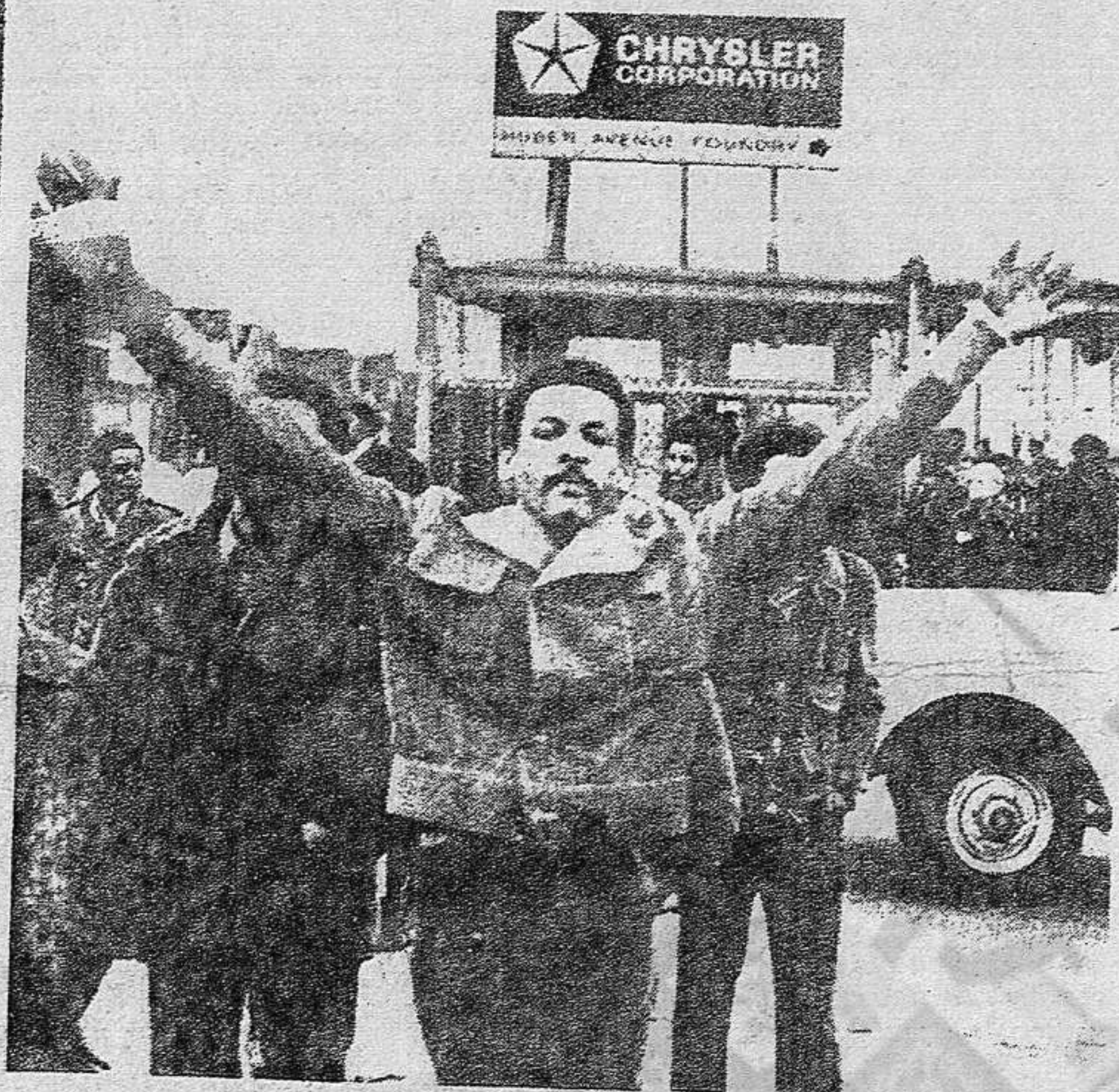
La crisis del capitalismo internacional bambolea (...) a los propios Estados Unidos

En junio, Arias afirmó que "hemos superado los peores momentos" que el Gobierno mantendría el nivel de empleo y terminaría con la inflación. Y ha sido precisamente en los meses siguientes cuando la crisis -inflación y estancamiento- ha hecho furor. Hoy hay que afirmar que los momentos peores todavía están por venir si el proletariado no lo impide. La crisis es incontrolable para el Gobierno Arias como para todos los gobiernos burgueses del mundo. Cuando hoy ese Gobierno dice que en 1975 va a relanzar la producción, va a impedir que el paro sea superior al 2%, va a rebajar en 4 puntos el alza del coste de la vida, esas palabras son promesas vanas.