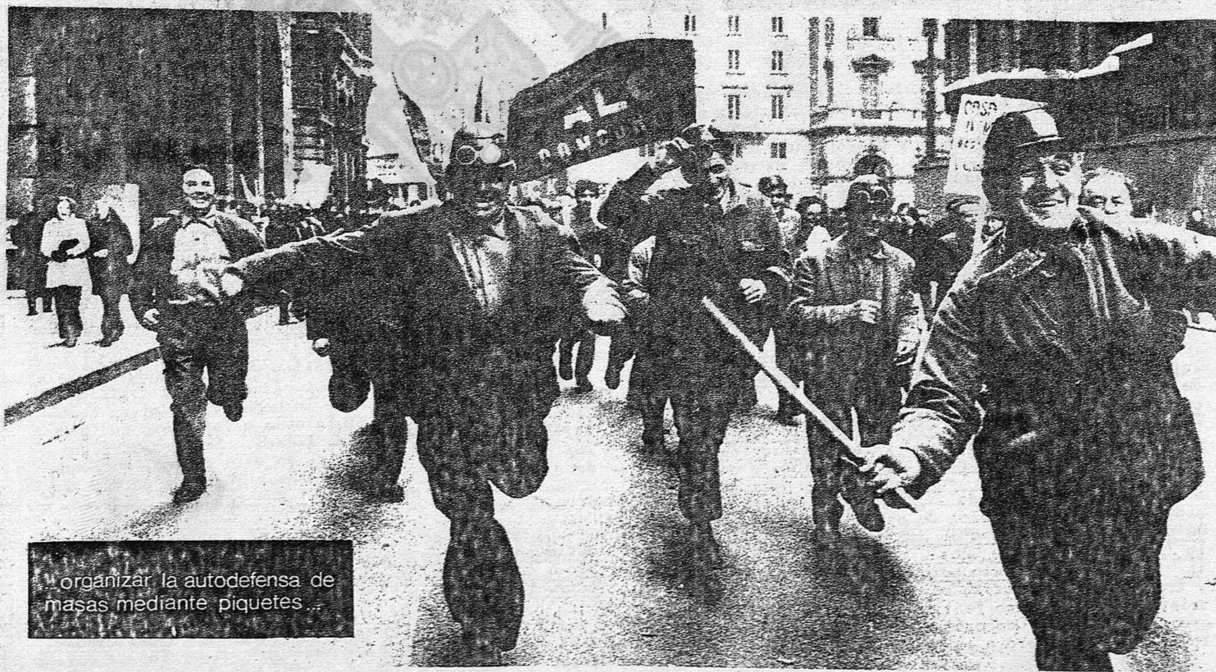
Organizar la autodefensa de masas mediante piquetes...

Frente a la división que pretenden imponer estos mecanismos franquistas de control, hay que promover planes de ramo ó sector, con paros y acciones conjuntas, elaboración de plataformas unitarias y su presentación