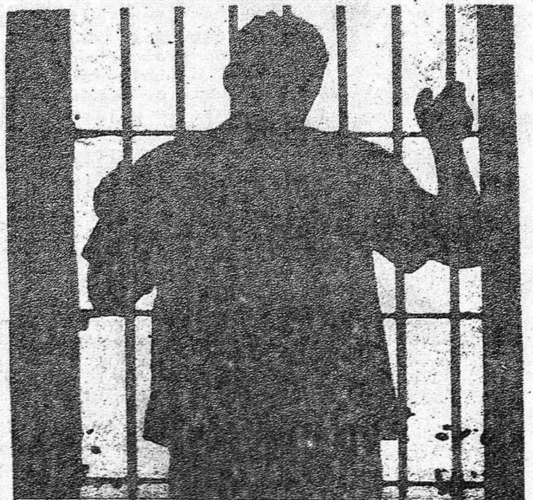
Disolución de cuerpos represivos...

La actitud ultrasectaria de los "Comités de Empresa" de Guipuzcoa (dirigidos por los NOC) en su absurda negativa a integrarse al poderoso movimiento de unificación de las CC.OO., en nombre de vagos principios "anticapitalistas" y "antirrevisionistas", es igualmente un grave atentado a las actuales exigencias del movimiento obrero y popular. La postura mantenida por la dirección = de estos "comités" en Rentería, donde son hegemónicos, abandonando de manera total al movimiento desatado en la Huelga General, y abortando ésta, así mismo, liquidadora.