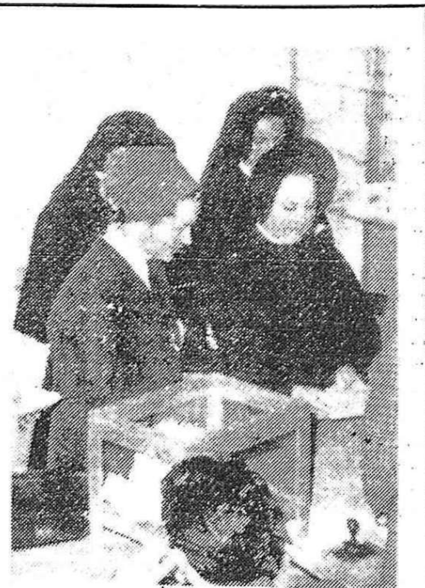
Las sacaron de los conventos... para votar por Franco.

Expresamos a su familia nuestras sinceras condolencias. LPE