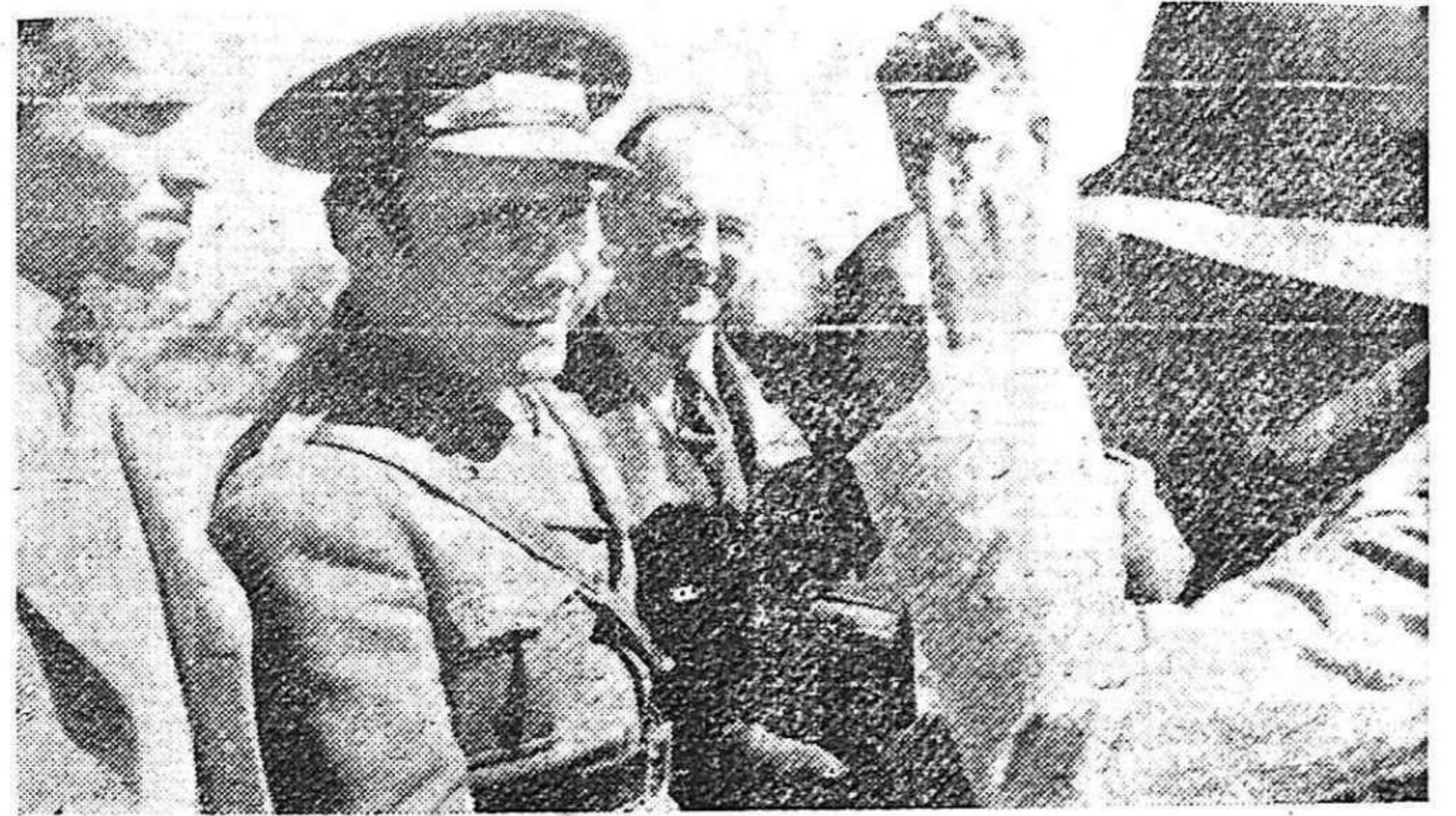
Nehru y Lister durante nuestra guerra.

vida. Hijo de madre campesina y de padre obrero y, obrero él mismo, no fué nunca a la escuela y como casi todos los niños gallegos empezó a trabajar cuando apenas si sabía andar.