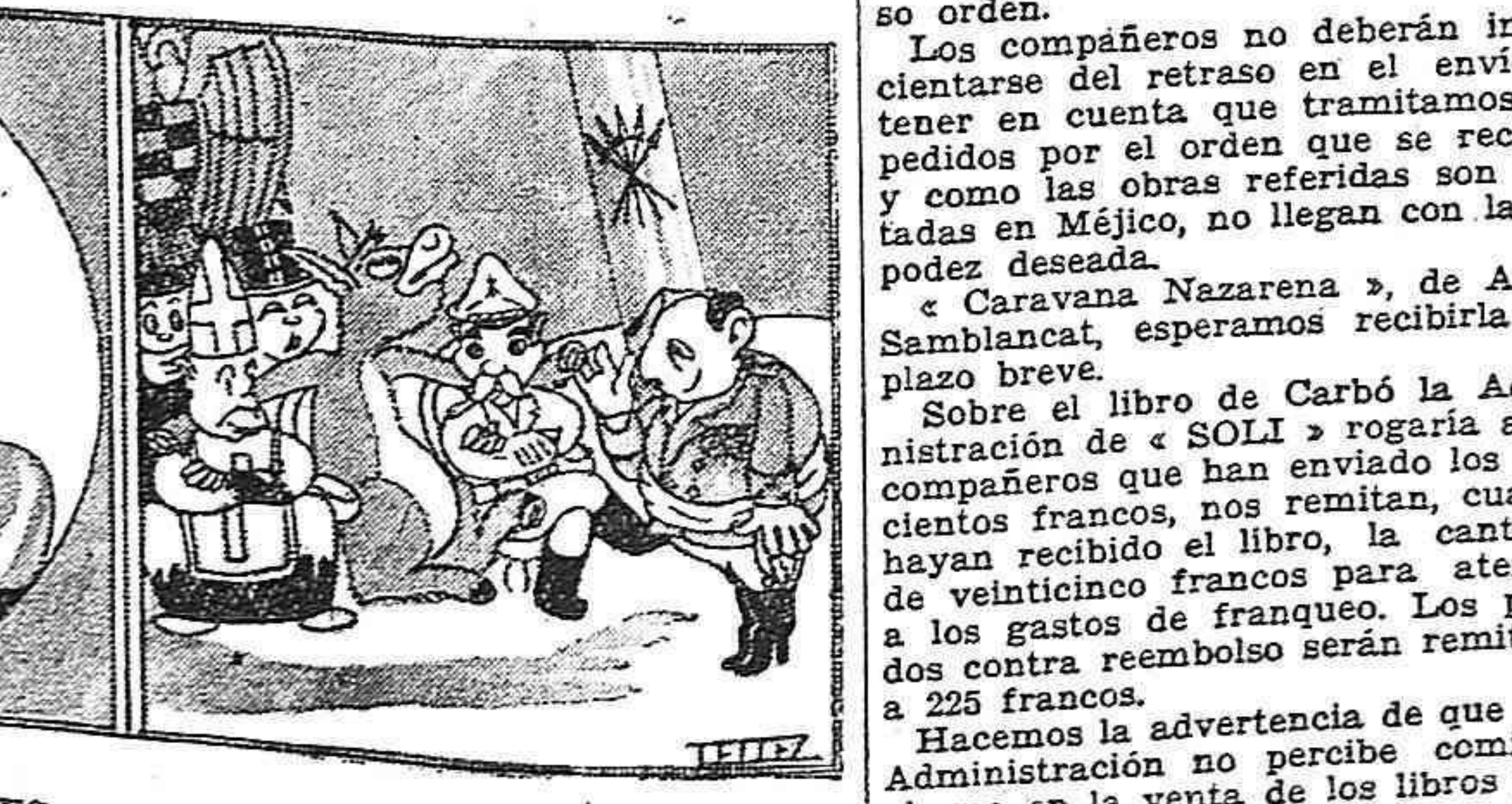
EMULO DE IMPERADORES