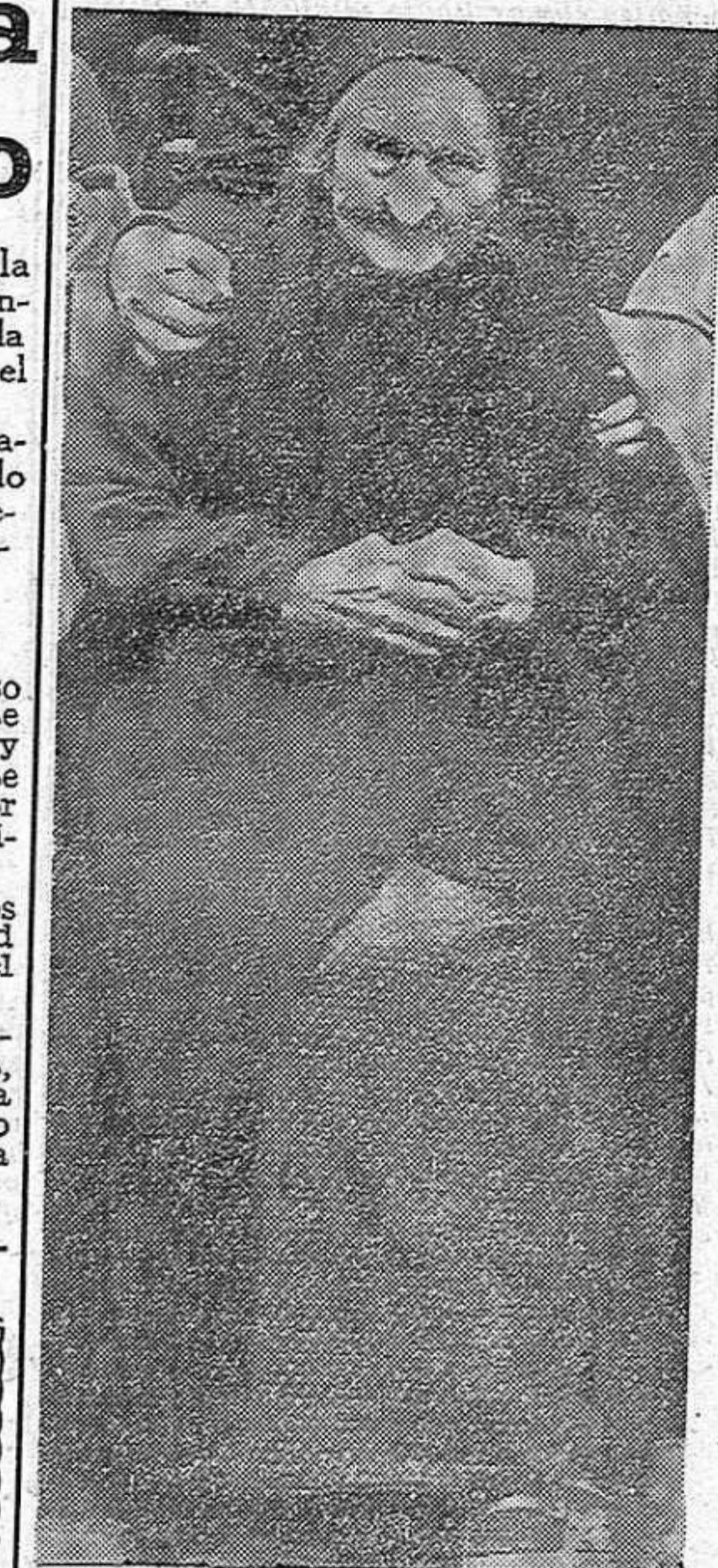
Una anciana evacuada de uno de los primeros pueblos de Guipuzcoa ocupado por los franquistas. Millares de mujeres y niños escaparon al terror de las hordas falangistas.

Montañas y valles de Euzkadi fueron tintos de sangre de heroes. Oizandiano, Elgueta, Bizkargi, Je-