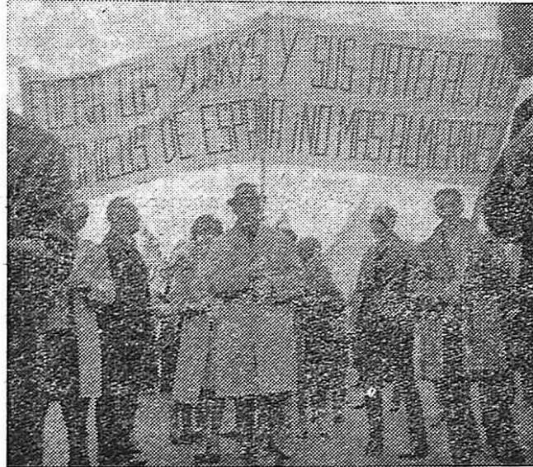
Manifestación en Oran (Argelia).

Lo que hace falta es impulsar las formas de unidad y de organización de los trabajadores que la aseguren, robusteciendo al mismo tiempo las comisiones obreras allí donde existen y esforzándose por organizarlas en las empresas donde aún no actúan.