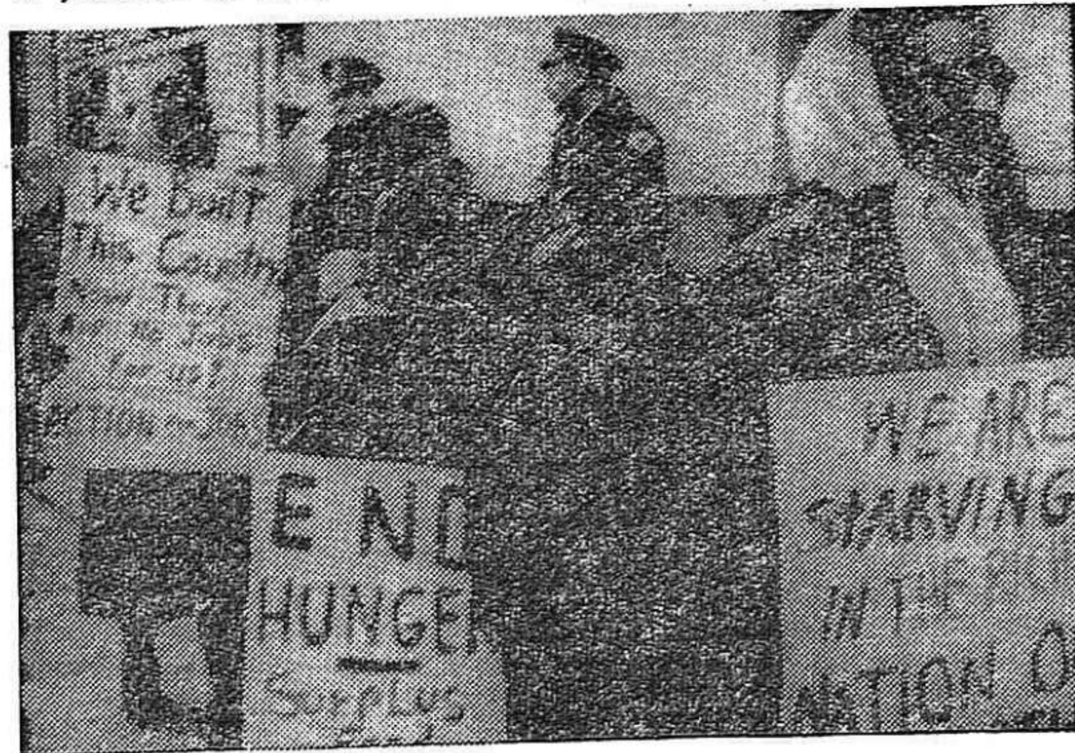
MANIFESTACION EN UN BARRIO NEGRO. En los carteles: « Hemos construido el país y ahora no nos dan trabajo », « Pasamos hambre en la nación más rica de la tierra », « Basta de hambre ».

La lucha de los negros de Norteamérica por la igualdad, ha demostrado ya que no están dispuestos a ser eternamente una especie de colonia, ciudadanos de cuarta categoría en el país donde han nacido y por el que tanto trabajan.