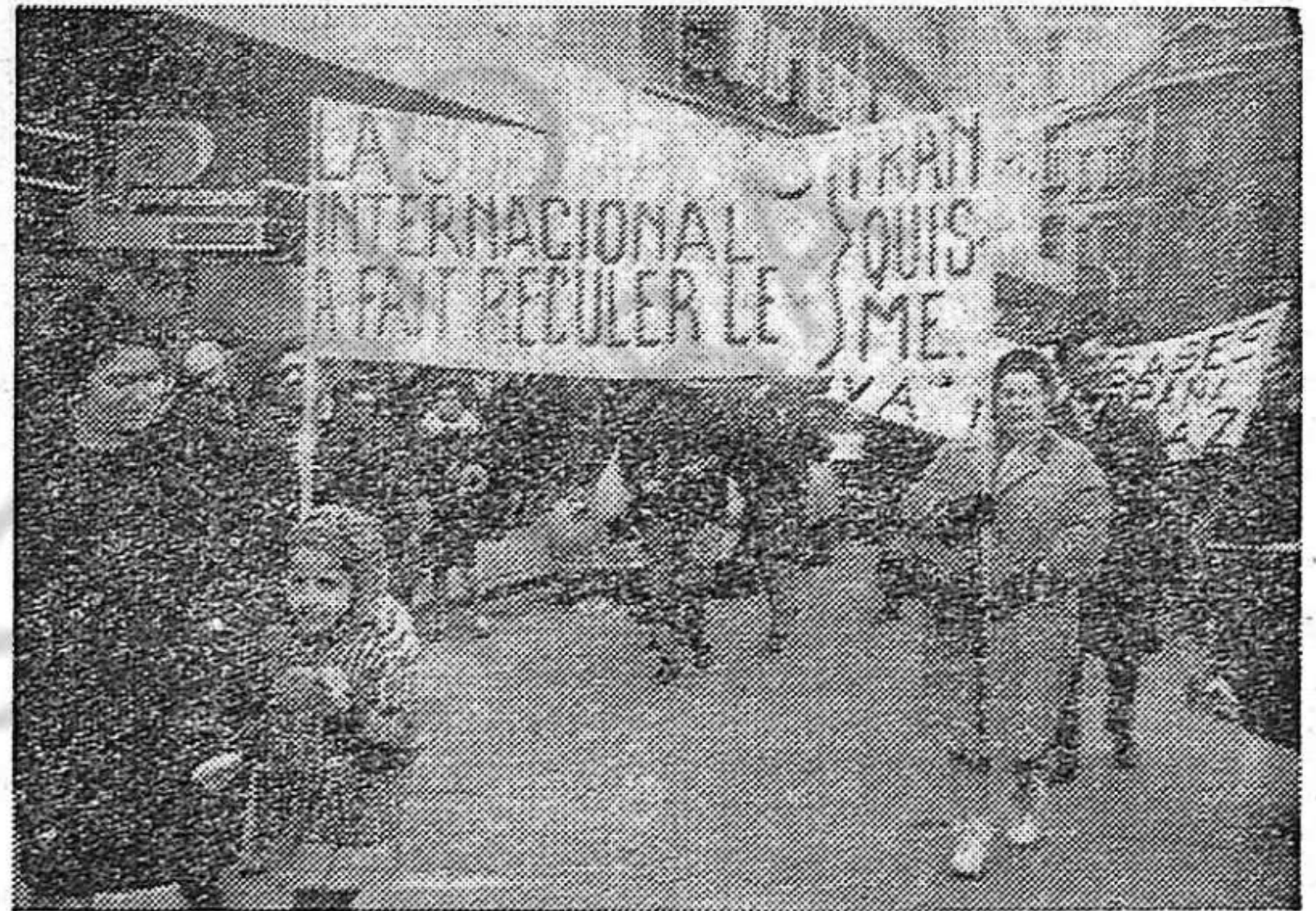
Manifestación en Charleroi (Bélgica).