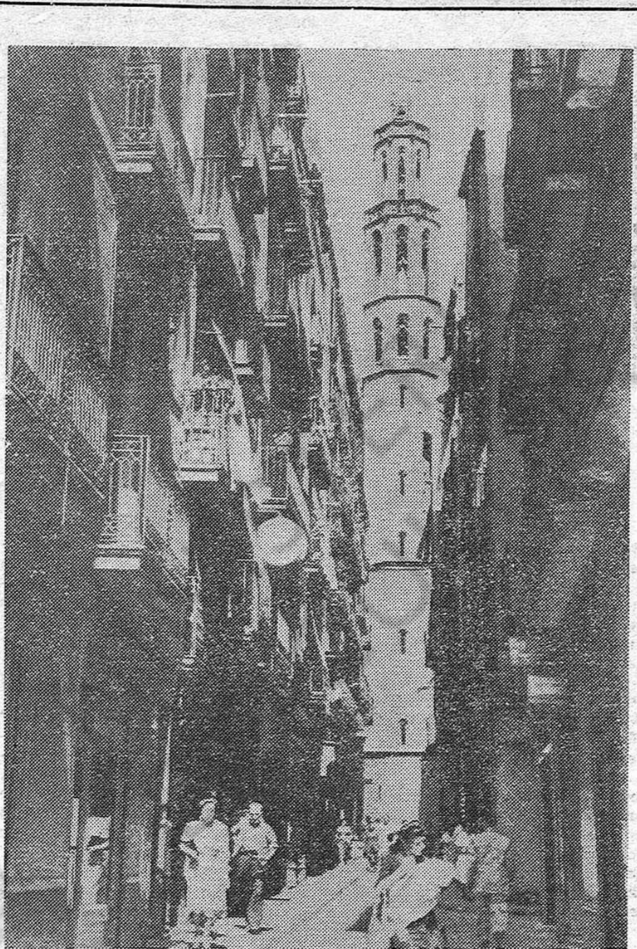
Santa Maria del Mar, una de esas viejas calles de Barcelona de que se habla en esta crónica

Pero cuando son conocidos en Zaragoza estos hechos, la gente dice que mal anda el régimen para recurrir a tales métodos, y que, de todas maneras, las medidas policíacas no lograrán impedir las luchas que se avecinan.