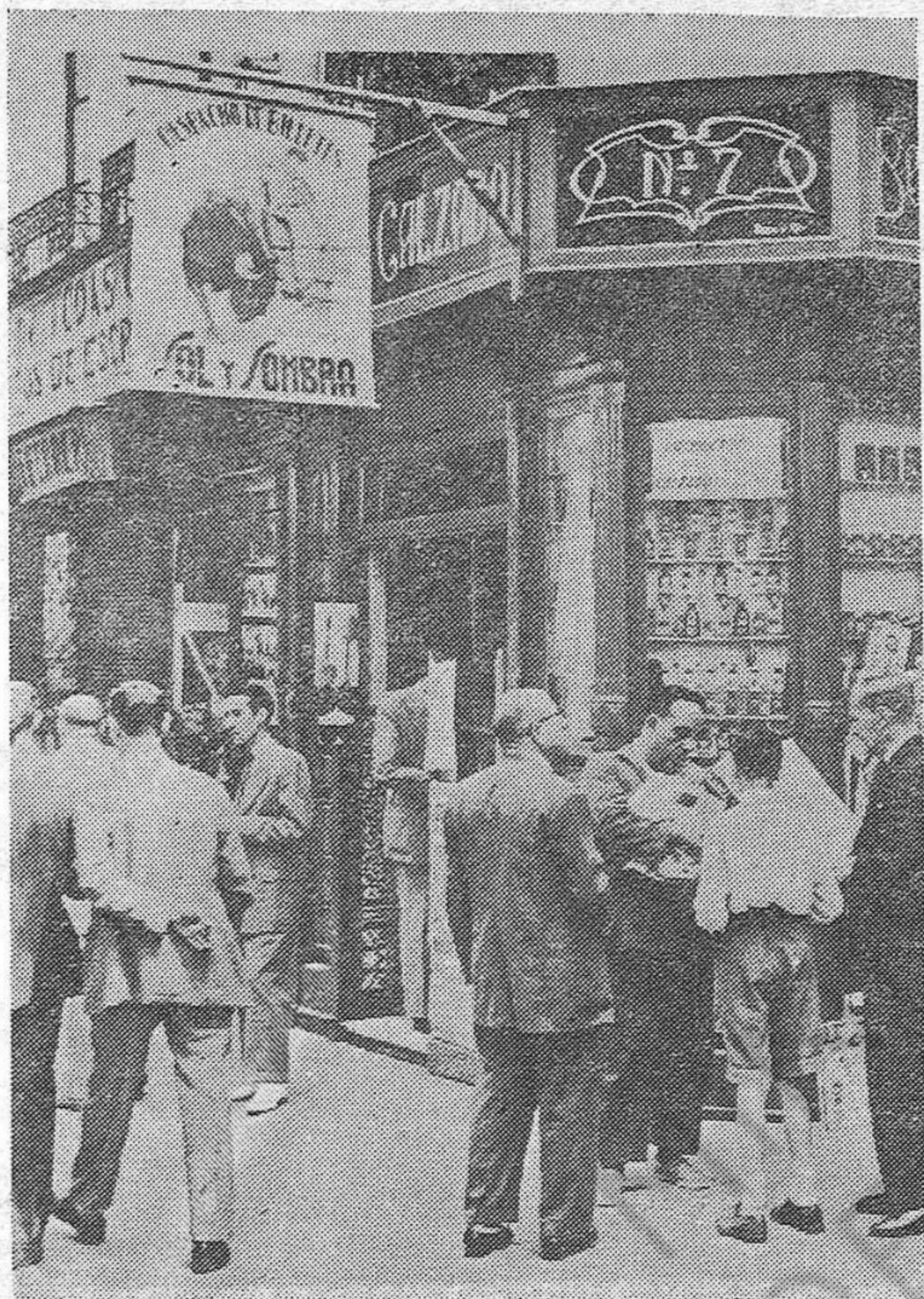
Una esquina de la calle de las Sierpes, en Sevilla