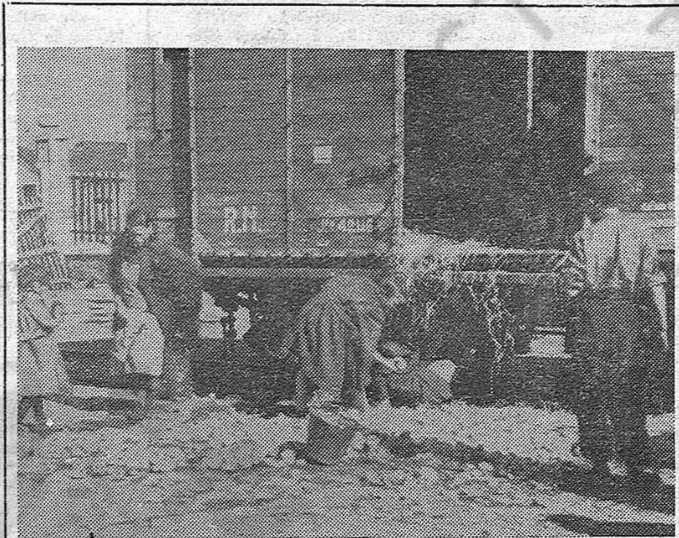
EN UNA ESTACION DE MADRID. — A la busca de naranjas podridas

—Y cuando sepan lo que aquí ha sucedido — declaró uno de los delegados —, los obreros se afirmarán en que ése es el camino.