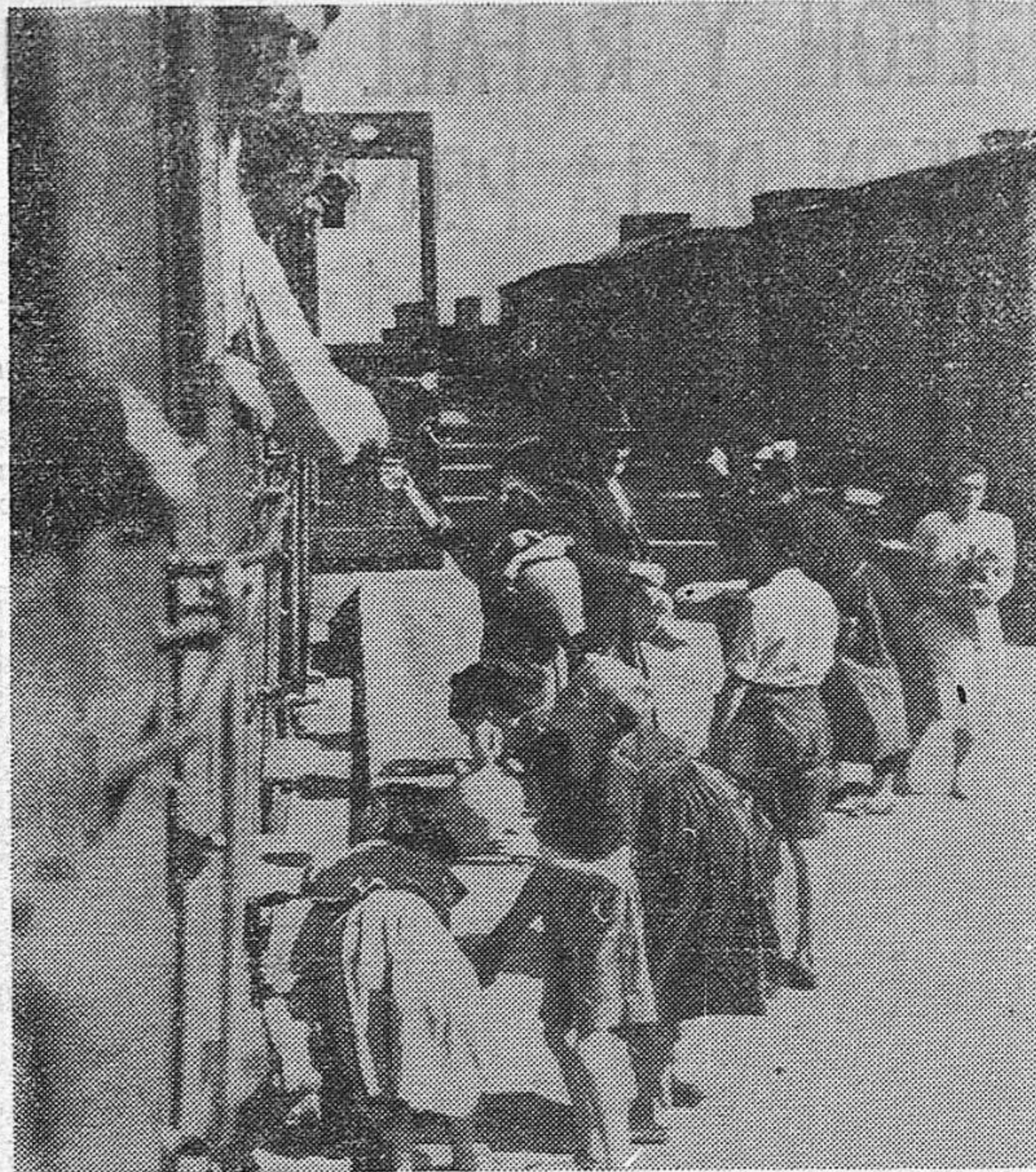
Una de las estaciones de España, en donde las largas esperas de los trenes de la RENFE hace indispensable el servicio de aguas, que desempeñan niños y mujeres

Y así han quedado las cosas. En las cuevas ya no se habla de cambiar de residencia, sino de la ignominia del régimen, que, donde pone la mano, es para esquilmar al pueblo.