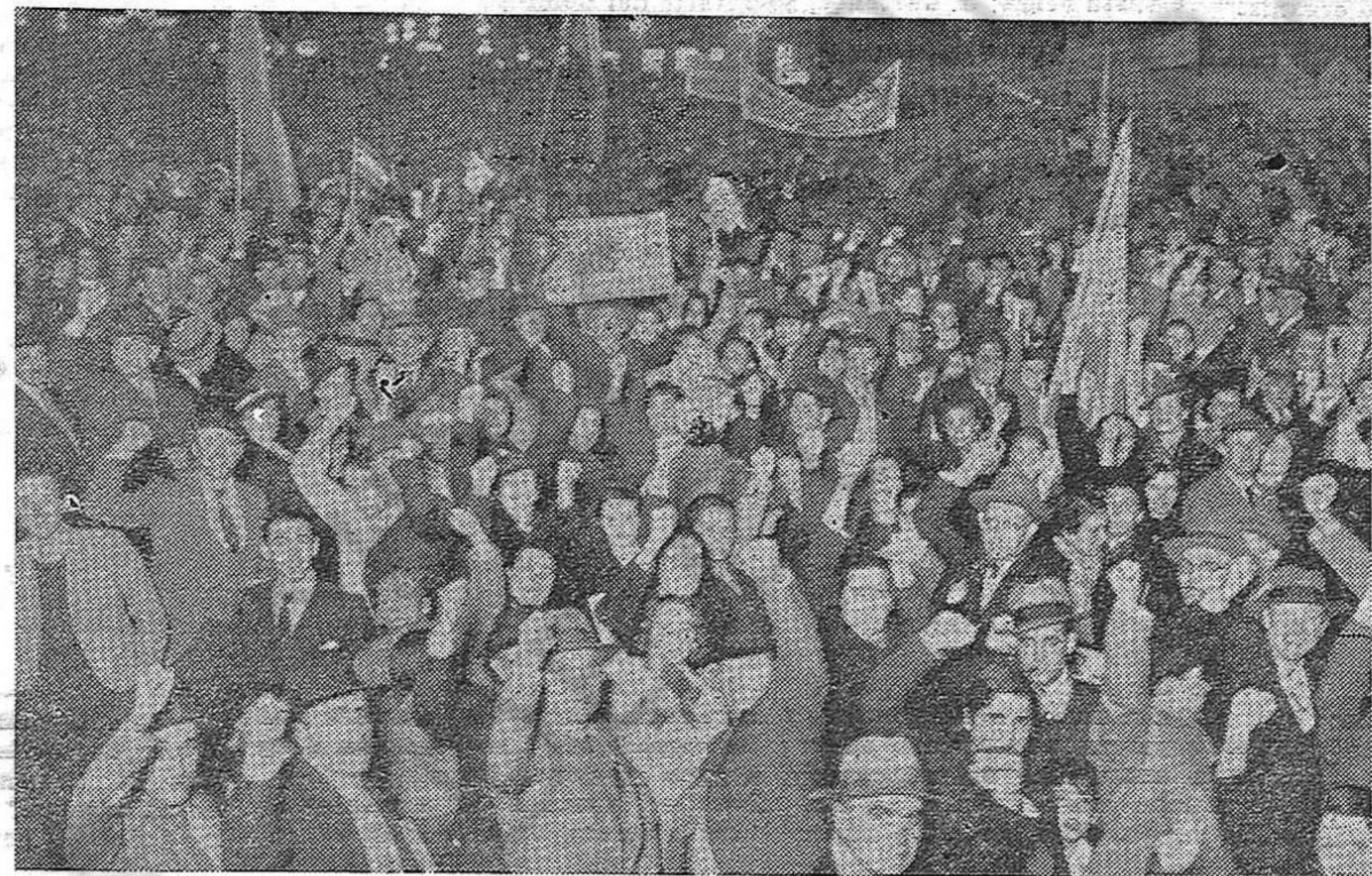
Una nota gráfica de la importante manifestación pública realizada el 14 de Abril por los Comités de Ayuda a España Republicana, en conmemoración del VIII.º aniversario de la implantación de la 2.ª República. — De este acto, dimos amplia información en nuestra edición anterior.