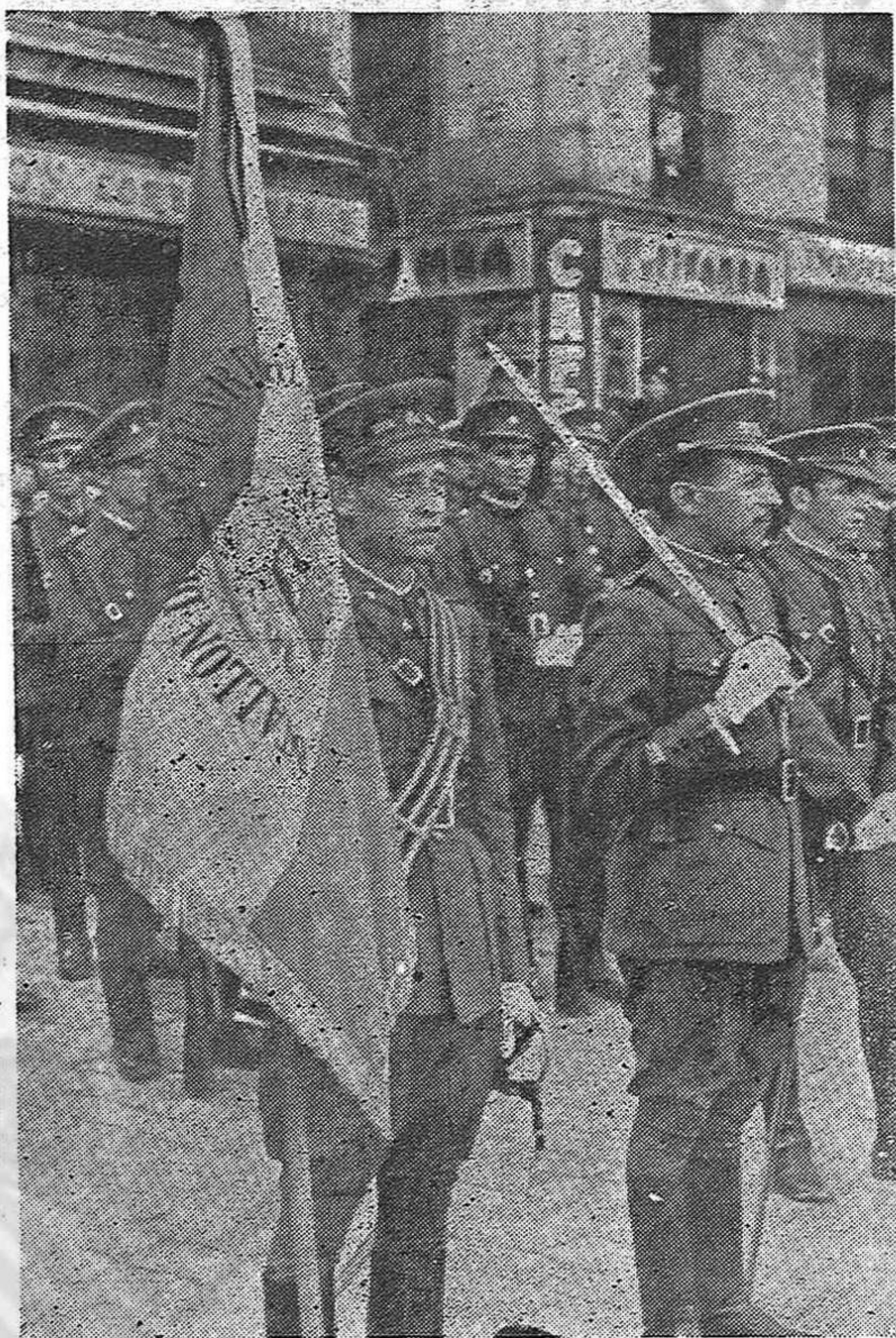
En Barcelona se efectuaron, con motivo de la desmovilización de las Brigadas Internacionales, grandes actos de homenaje en los que tomaron parte fuerzas del ejército, a las que vemos en el presente grabado durante un desfile.