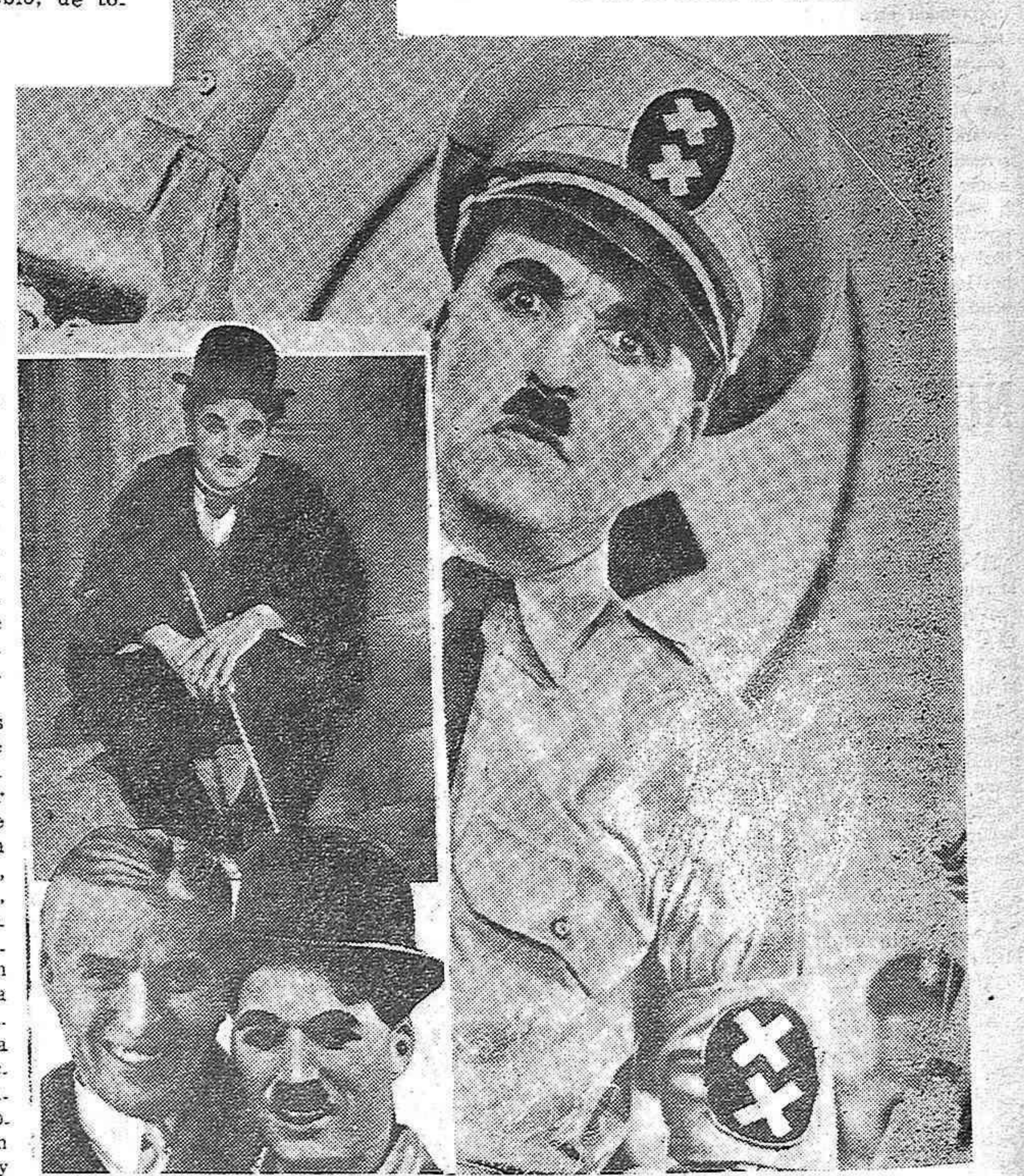
En la presente nota gráfica aparece "Dictador". A la izquierda, en la recepción Charles Chaplin en su papel parte de arriba, cuando le desentendía genial creador de "El Gran Dictador" habló Mack Sennett, y con la caricaturización que había de immortalizarle. Abajo: Chaplin tal como es en la vida y tal como aparece en la pantalla.

Una obra con valores particularismos para juzgar la cual no puede dejar de tenerse en cuenta el ánimo y hasta el modo de pensar de cada uno