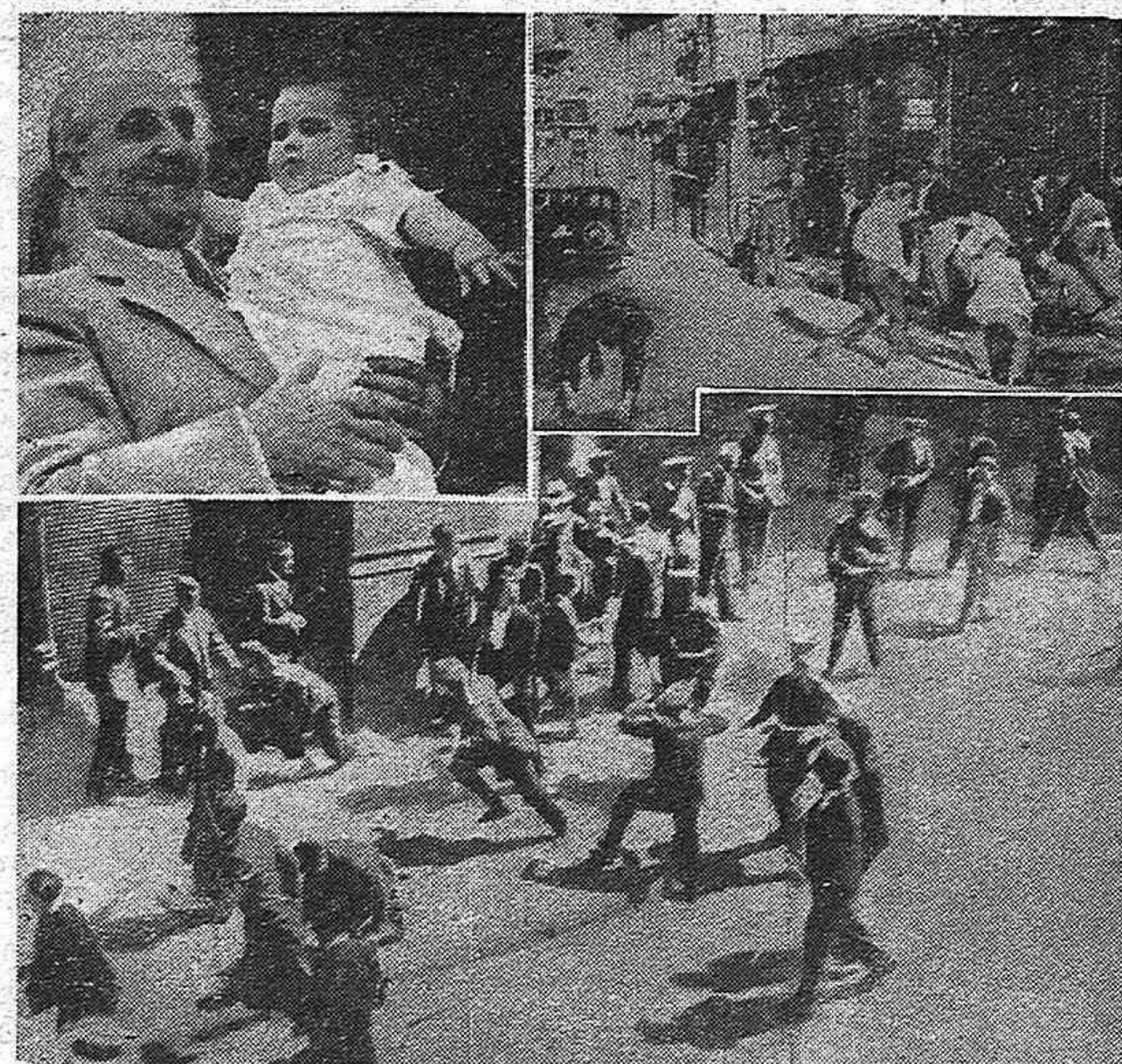
Nuestra composición recoge dos de los pocos documentos gráficos sobre los disturbios estudiantiles que pudieron perforar el muro de la censura franquista.

a los trabajadores al abrigo de posiciones fuertes, desde las cuales, sin escándalo, y sin apenas desgaste, propinan golpes dolorosos a la economía, que es el bajo vientre del régimen.