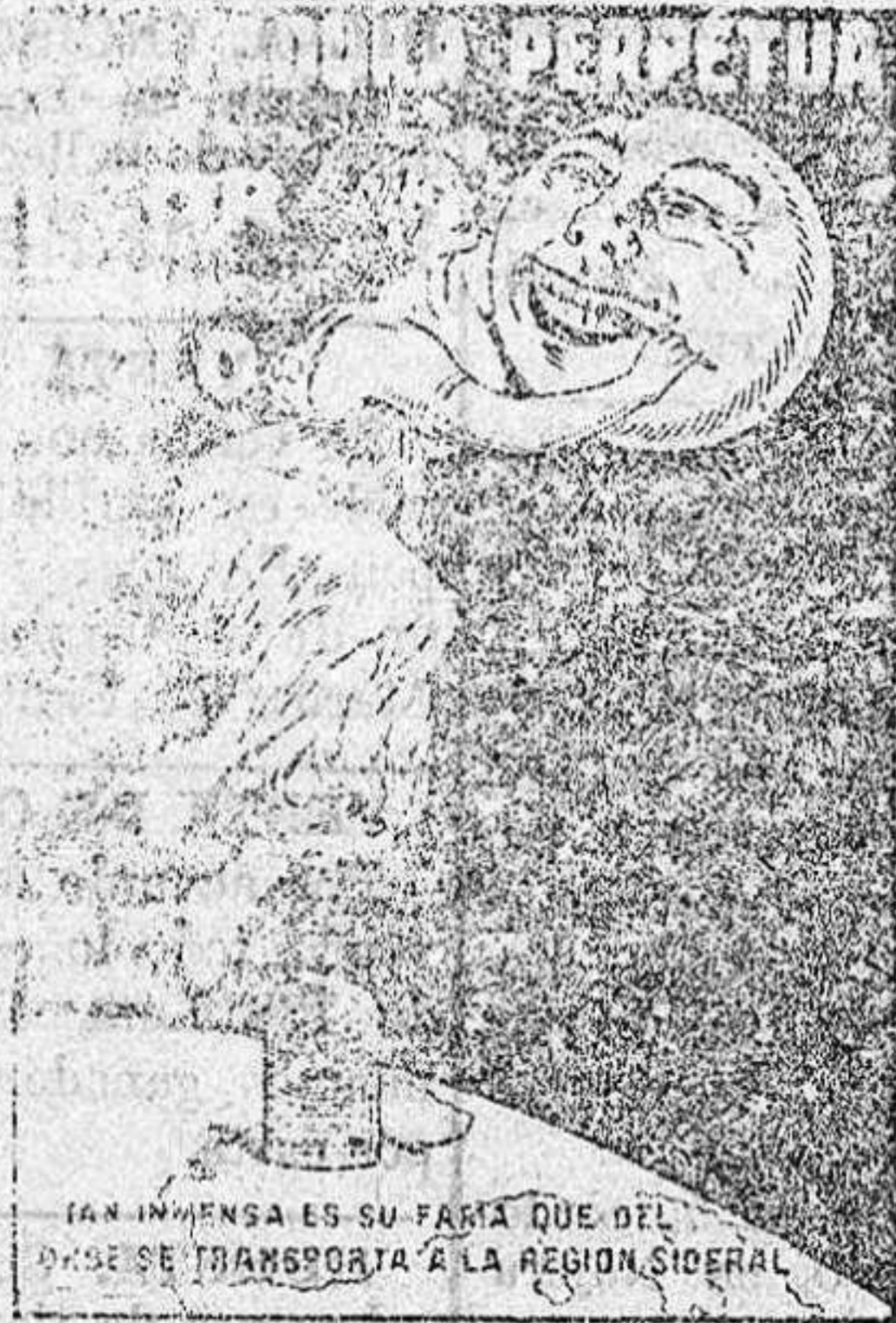
UNA INMENSA ES SU FAMA QUE DEL MAR SE TRANSPORTA A LA REGION SIBERIAL

ALHAMA DE ARAGON Gran Casino.— Teatro.— Grandes parques y lago navegable. Habitaciones desde una peseta. Comida desde 6 pesetas.