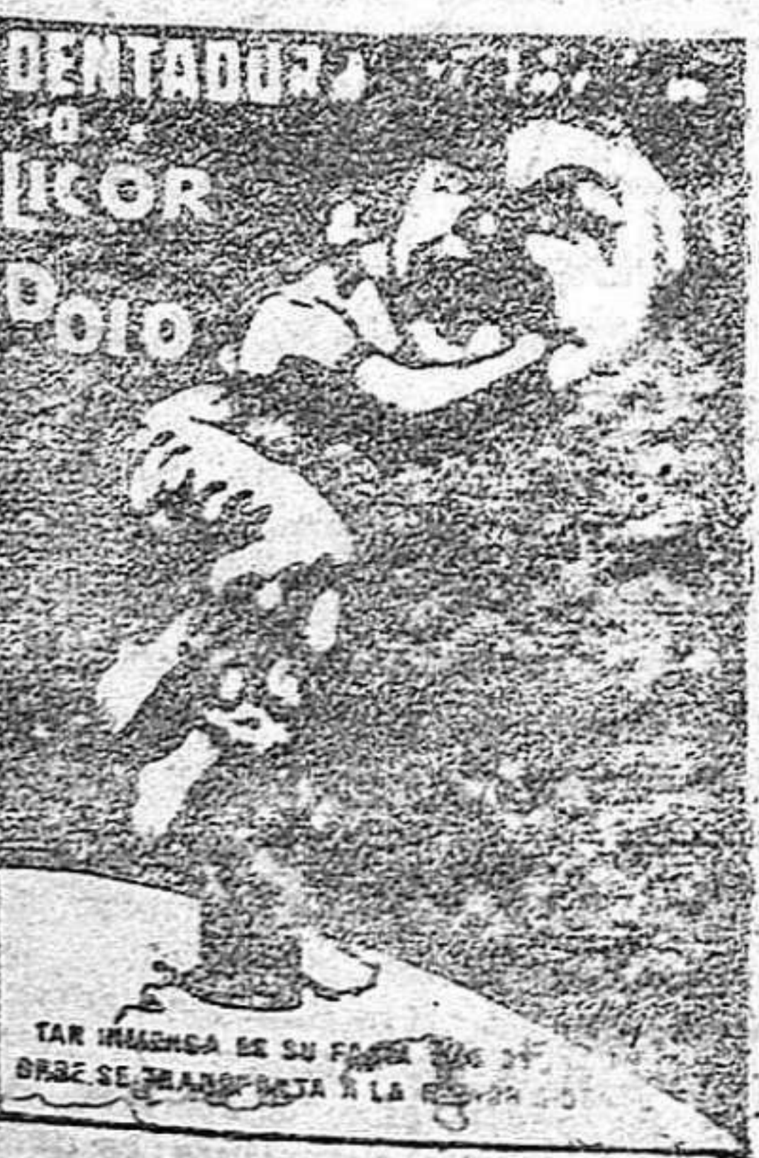
TAN INGENUA ES SU FAMA... DEBE SE TRANSFERIR A LA...