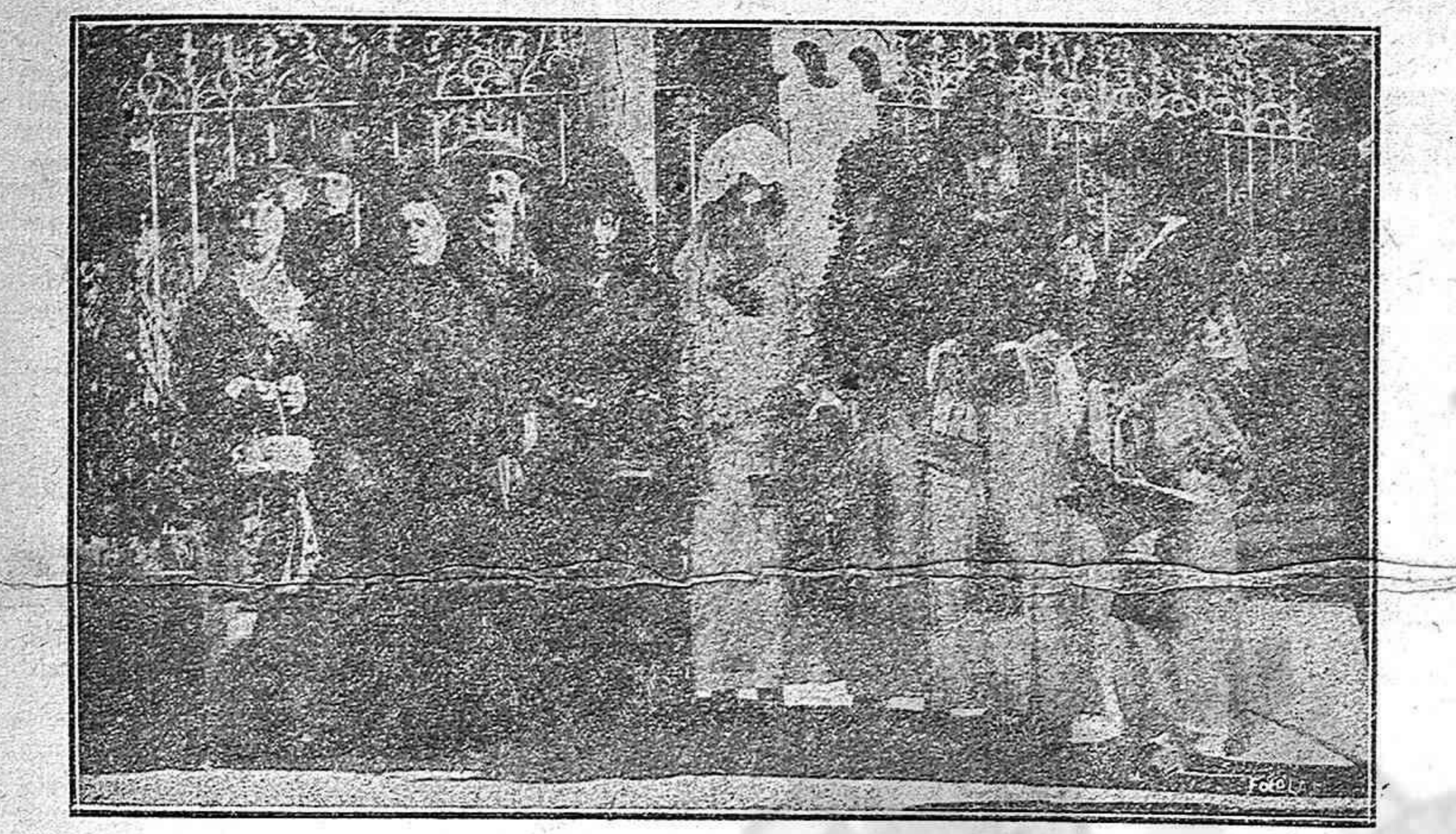
LA FIESTA DE LA FLOR.—Uno de los grupos de señoritas que postularon vendiendo flores.