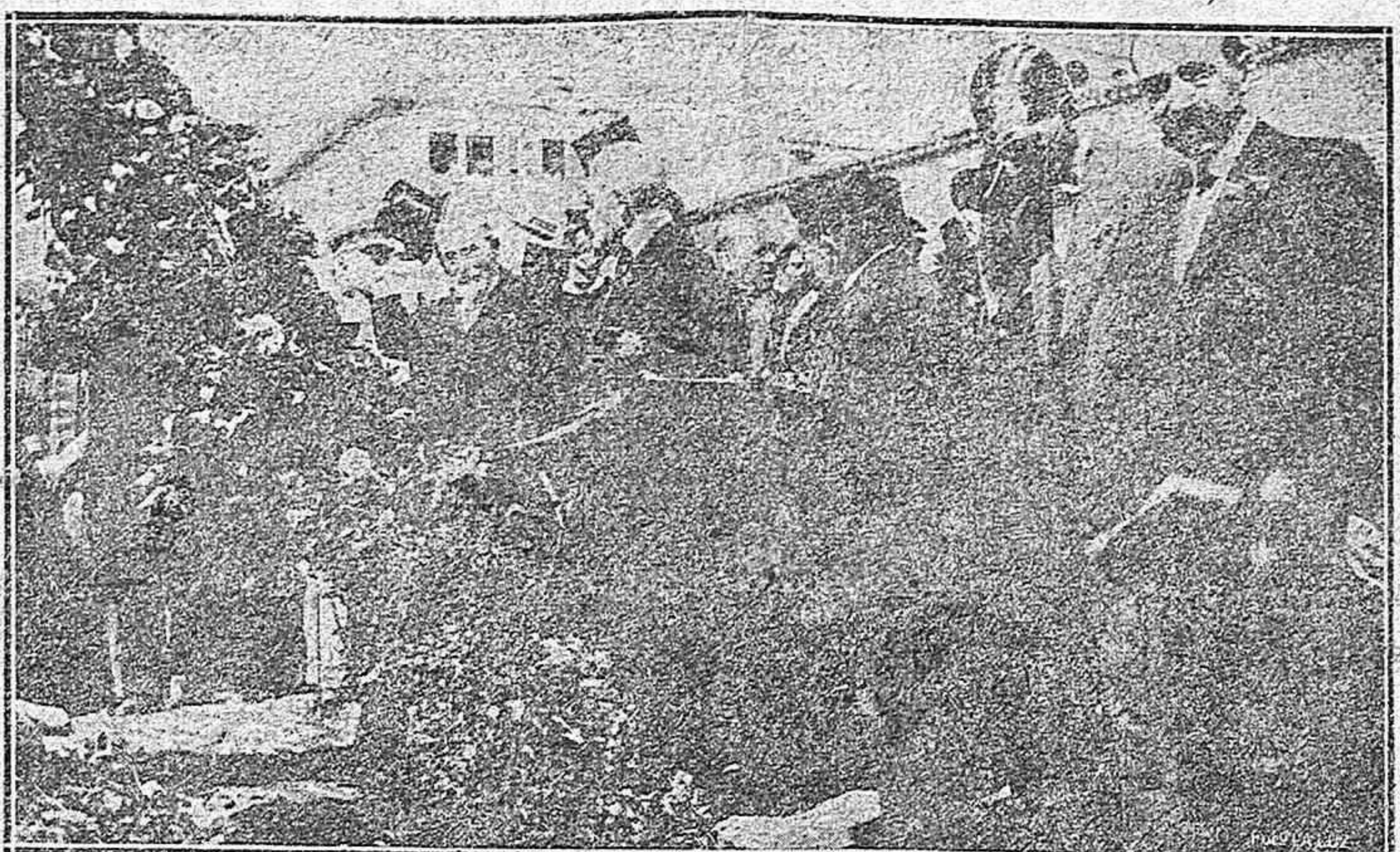
DE LAS FIESTAS.—Solemne acto de colocar la primera piedra de la futura Escuela Industrial.

PASTA DE CAFÉ Recomendamos a los consumidores de café, el uso de esta pasta, producto compuesto de café y azúcar de primera calidad e indispensable para las familias, porque además de constituir uno de los principales desayunos, se obtiene un 48 por ciento de economía sobre el procedimiento comúnmente usado. Venta ultramarinos.