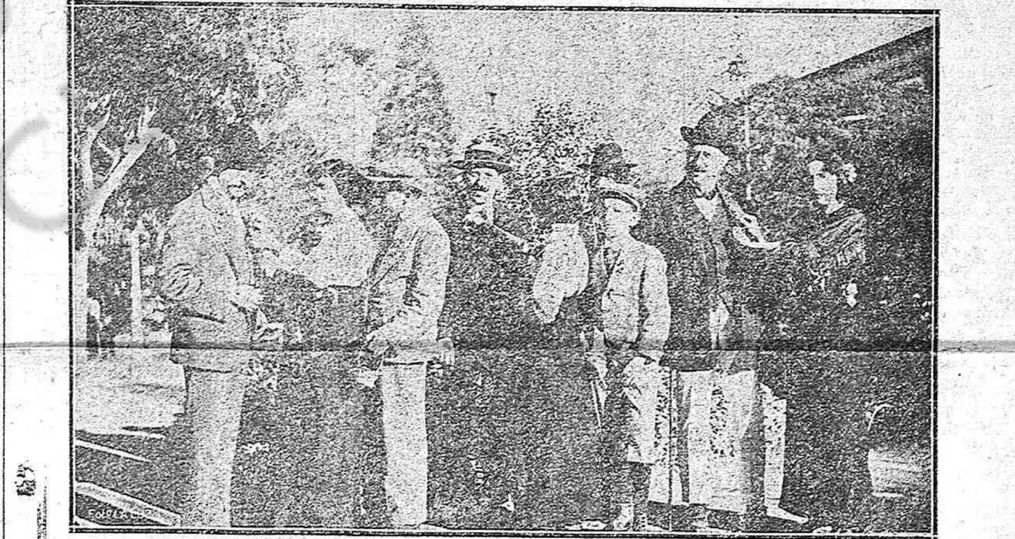
LA FIESTA DE LA FLOR.—Cigarreras prendiendo flores en las solapas de los transeúntes.