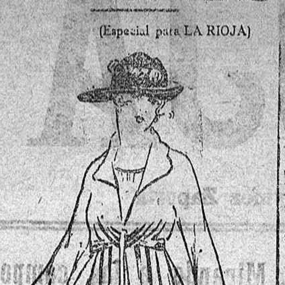
Descripción del modelo. Serenillo y elegantísimo vestido de tafetán color granate...