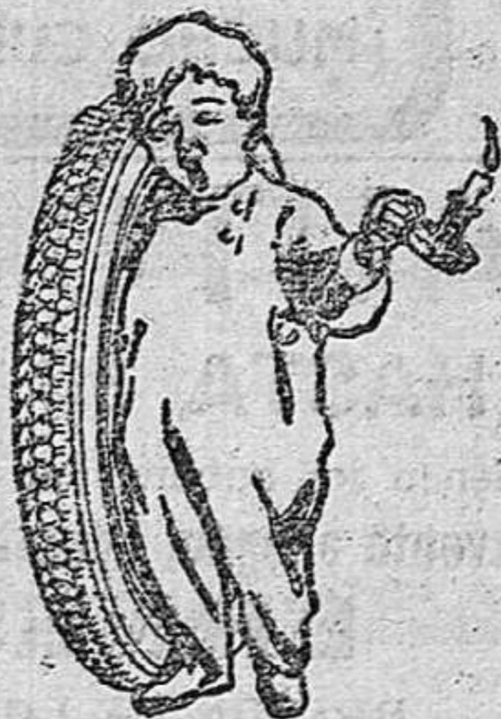
Agente exclusivo para Logroño y su provincia