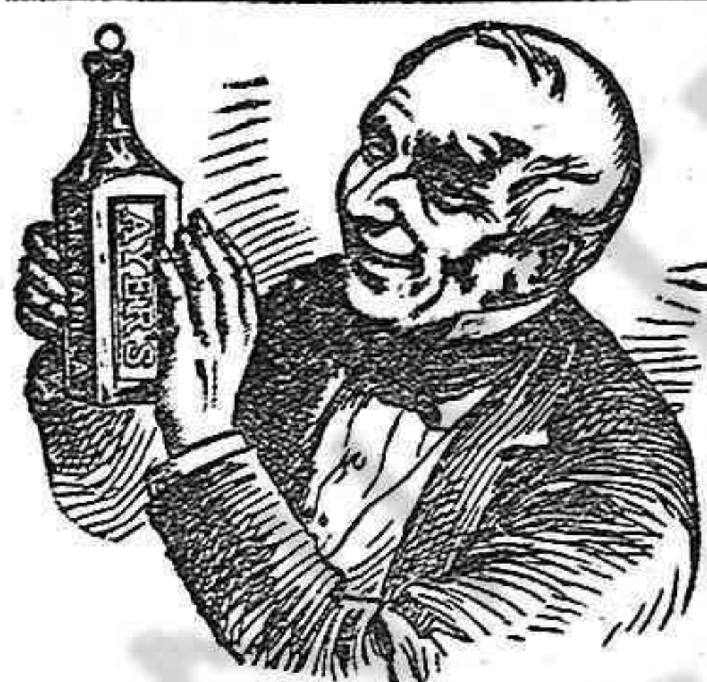
EL EXTRACTO COMPUESTO DE

VENTA AL POR MAYOR FARMACIA DEL GLOBO, Plaza Real, número 4, Barcelona. — Al detall en todas las de la Península y Ultramar.