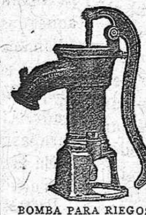
BOMBA PARA RIEGOS

Construye con solidez, economía y adelanto.