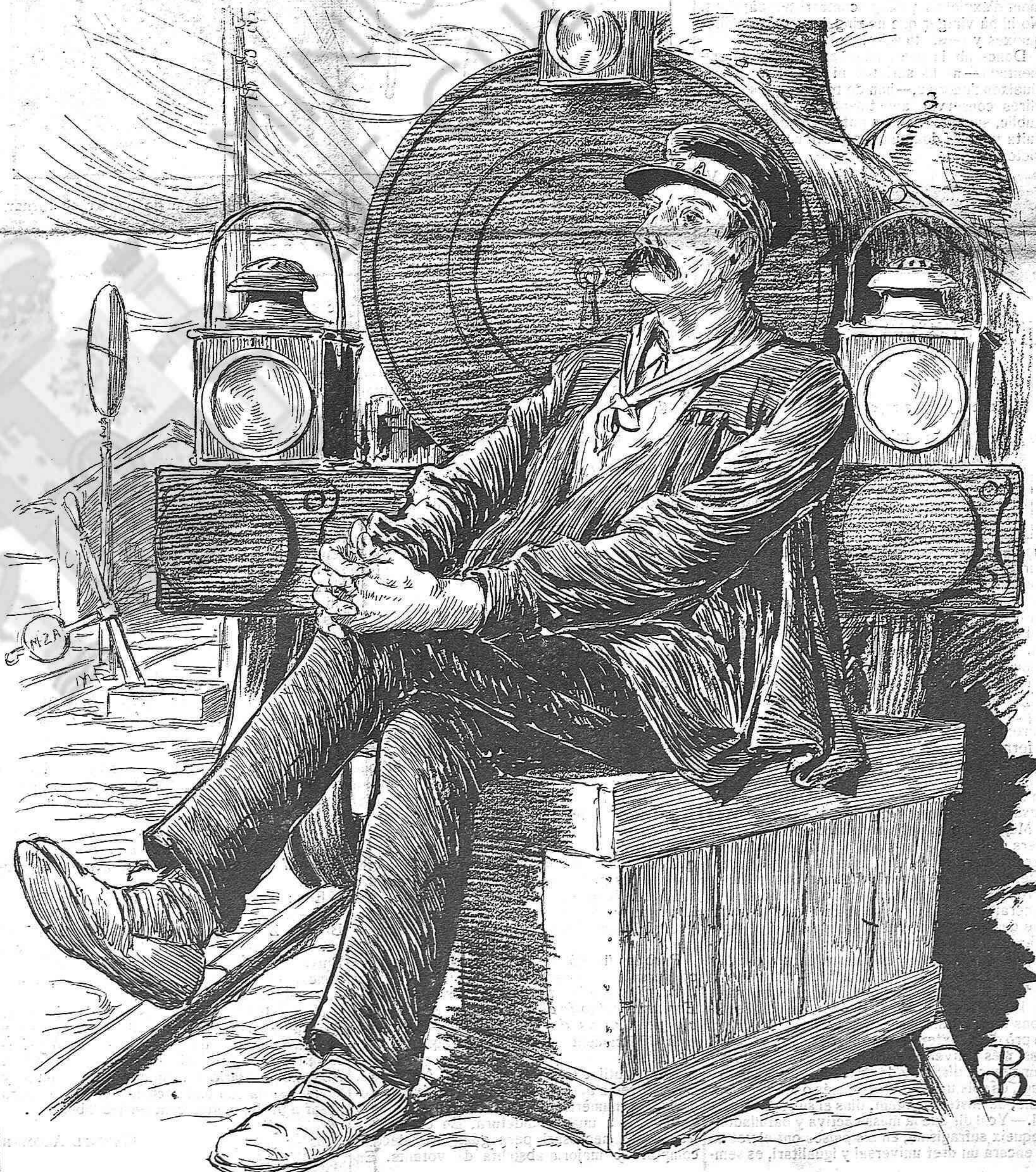
— Està vist; l'única manera de ferlos bellugar es amenassarlos ab estarme ben quiet.