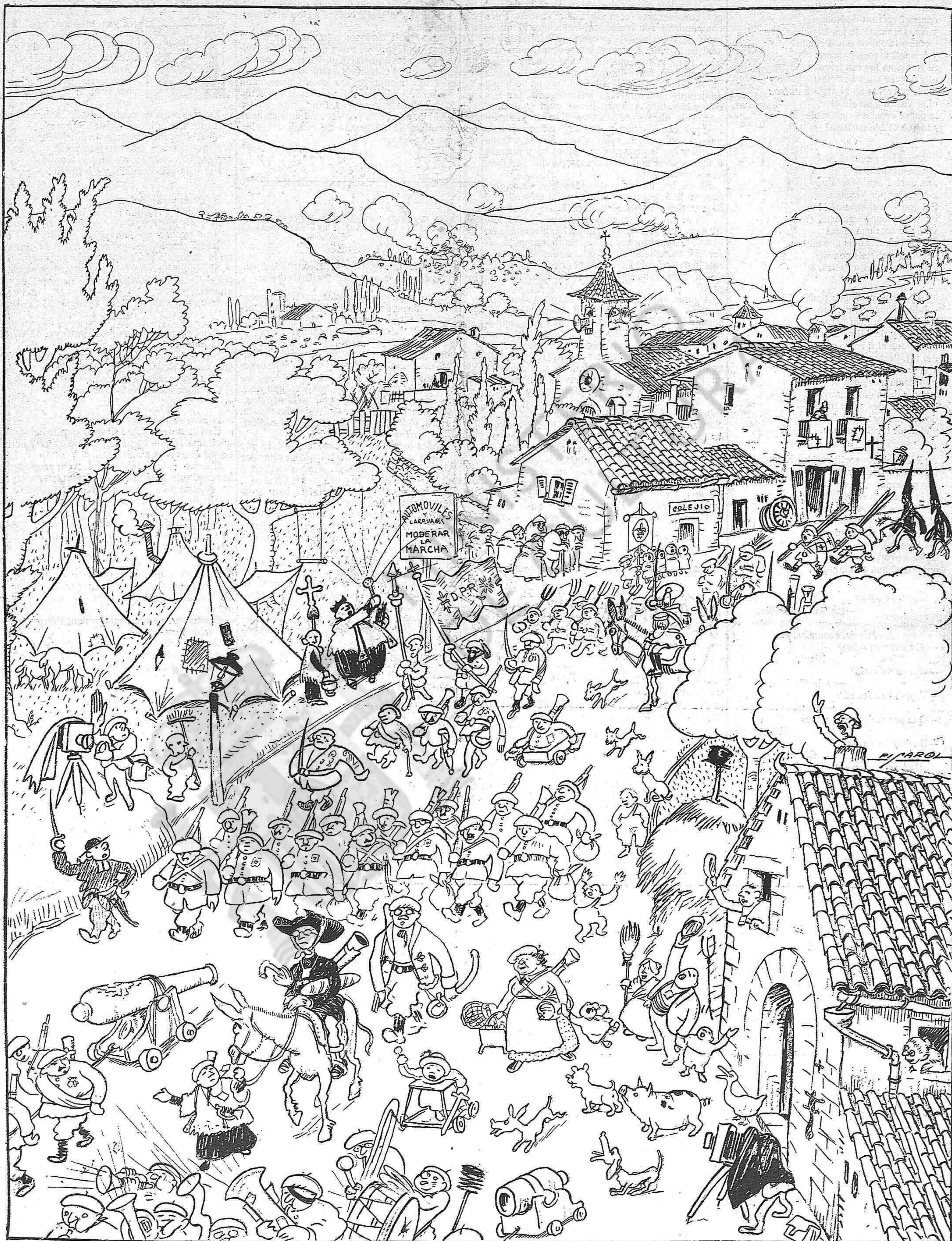
Però ja veuran vostès com al cap-d'avall no es res.