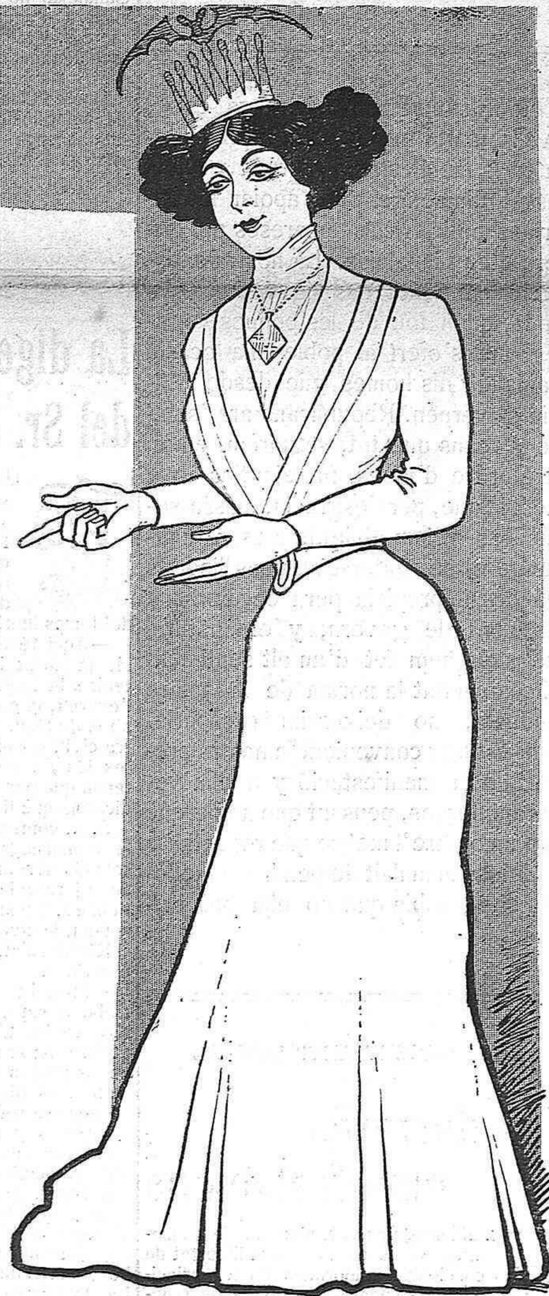
—Aquí'l teniu!... Aixís es, ha sigut y serà sempre'l poble barceloní.