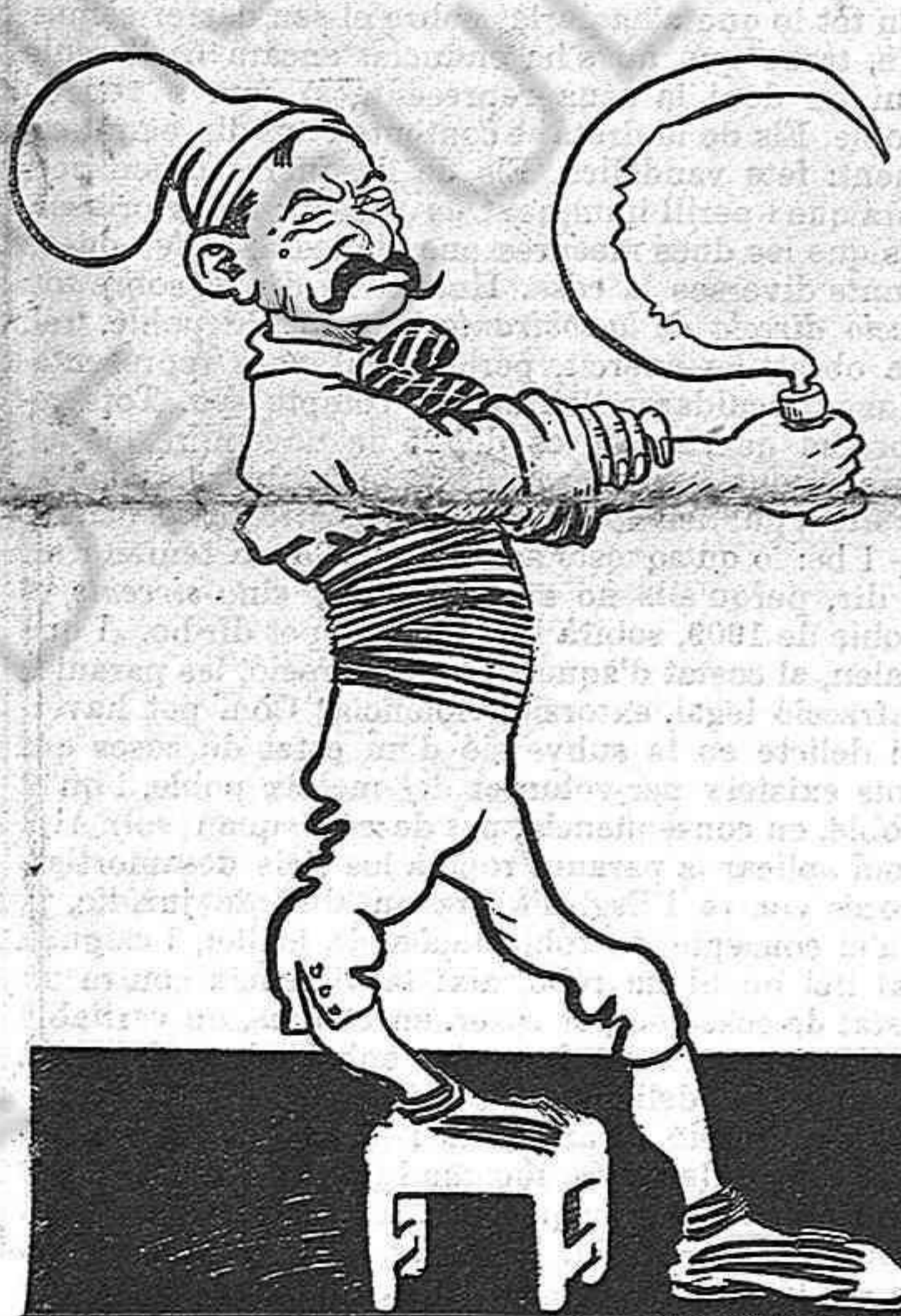
—Jo m' faré catalanista.