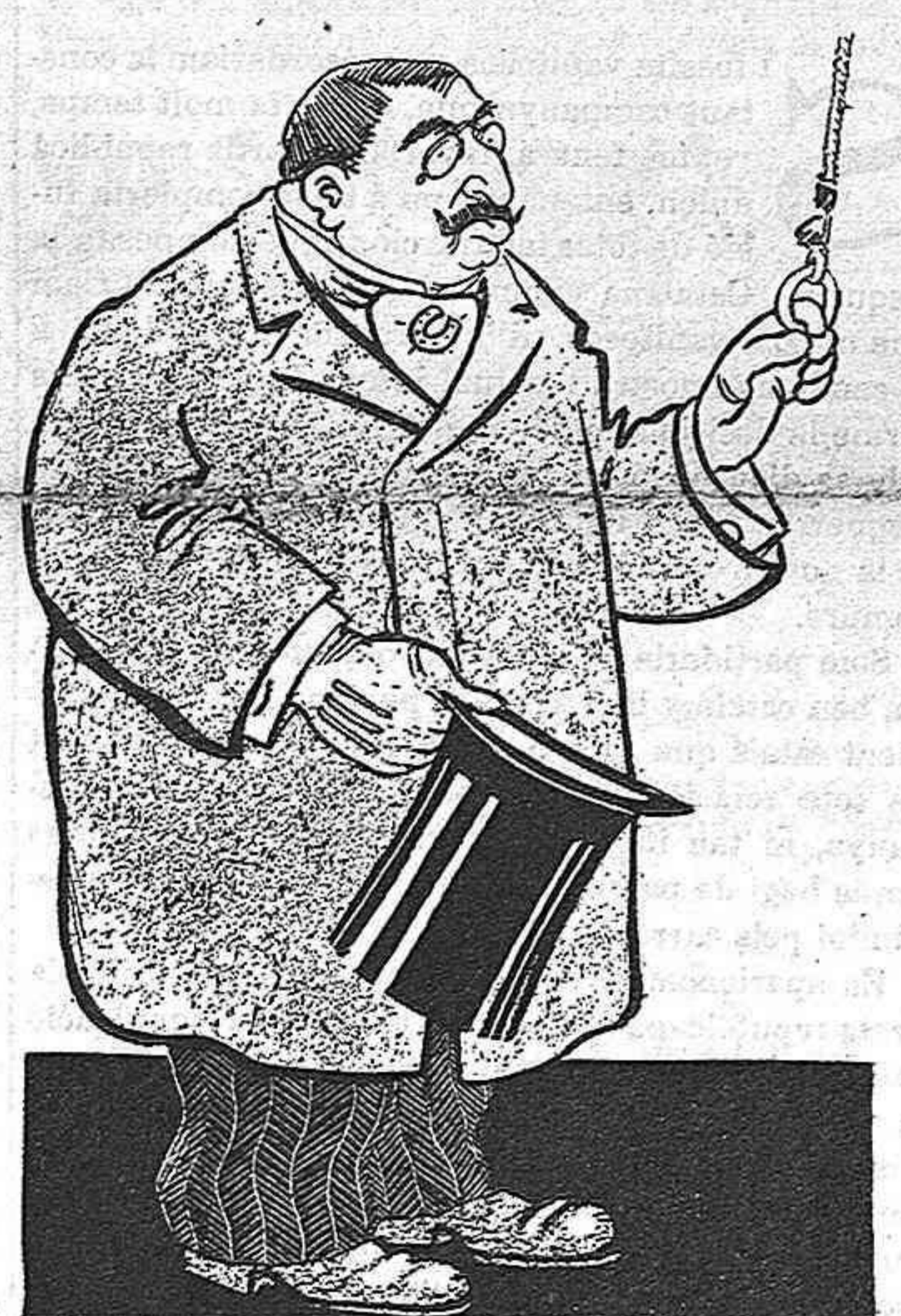
—Diré á don Dallonsas que ja no desitjo el poder.