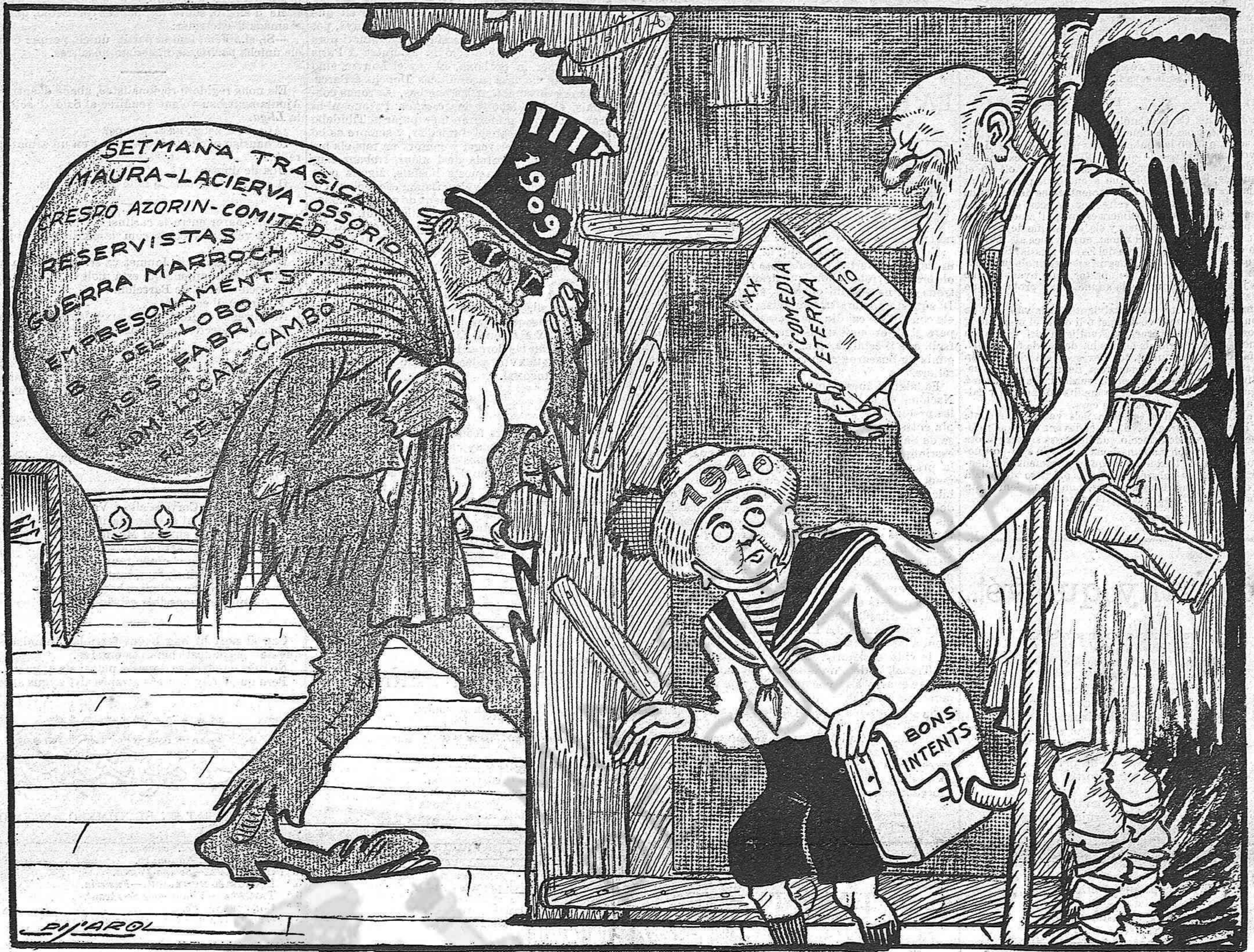
EL TEMPS-TRASPUNTE (al Any nou): — Apa, menut, surt sense por, que per malament que ho fassis, sempre ho faràs millor que aquest beneyt de barba que ara fa mutis.