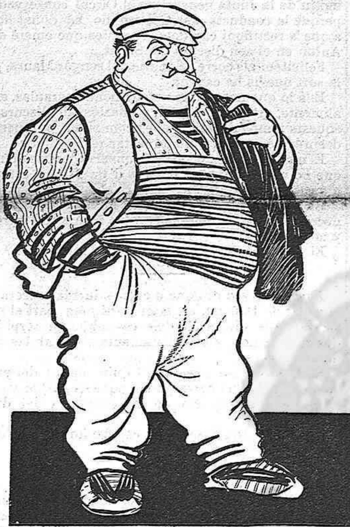
—Aniré á treballar á la Riba.