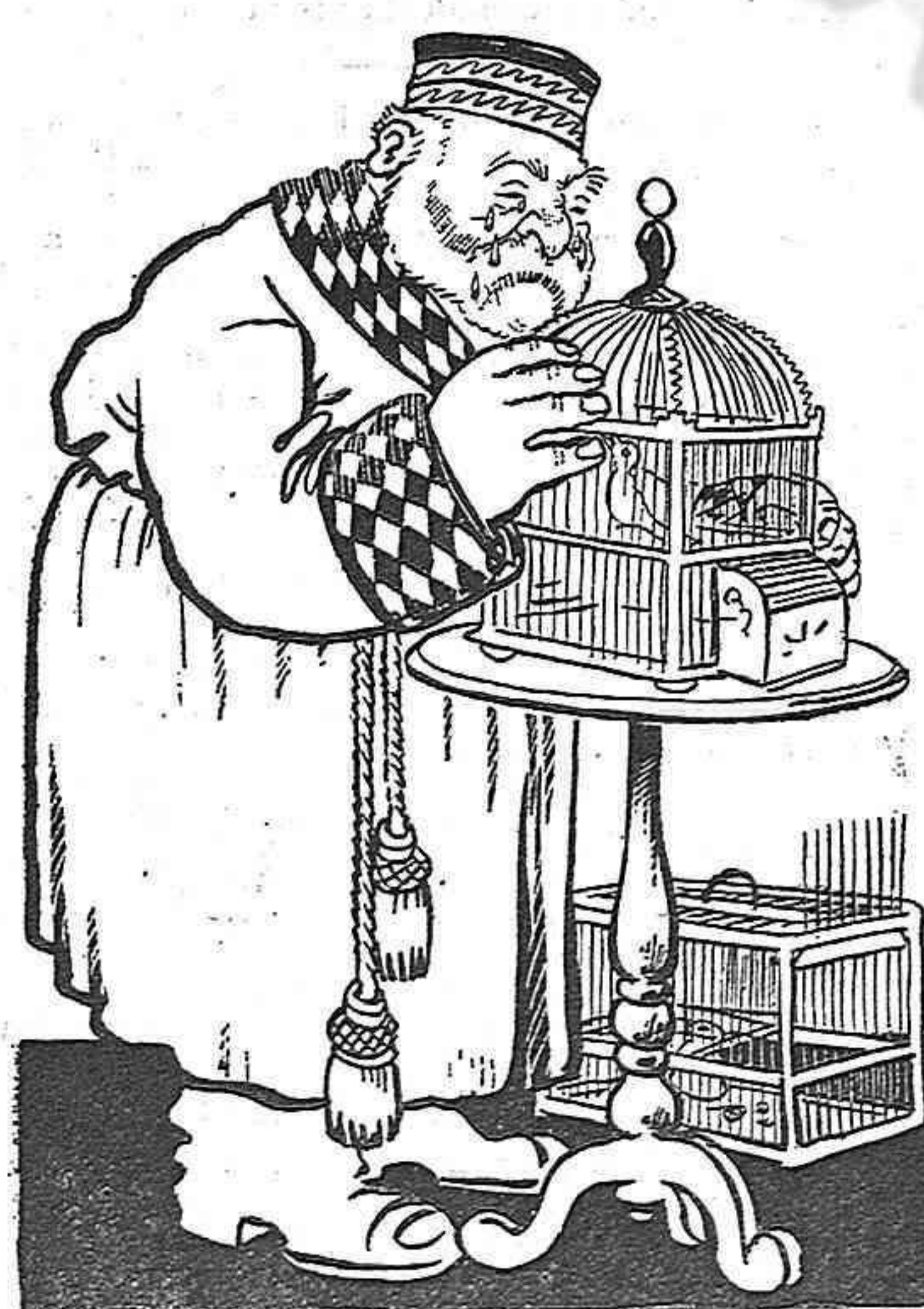
—Donaré llibertat á tots els canaris.