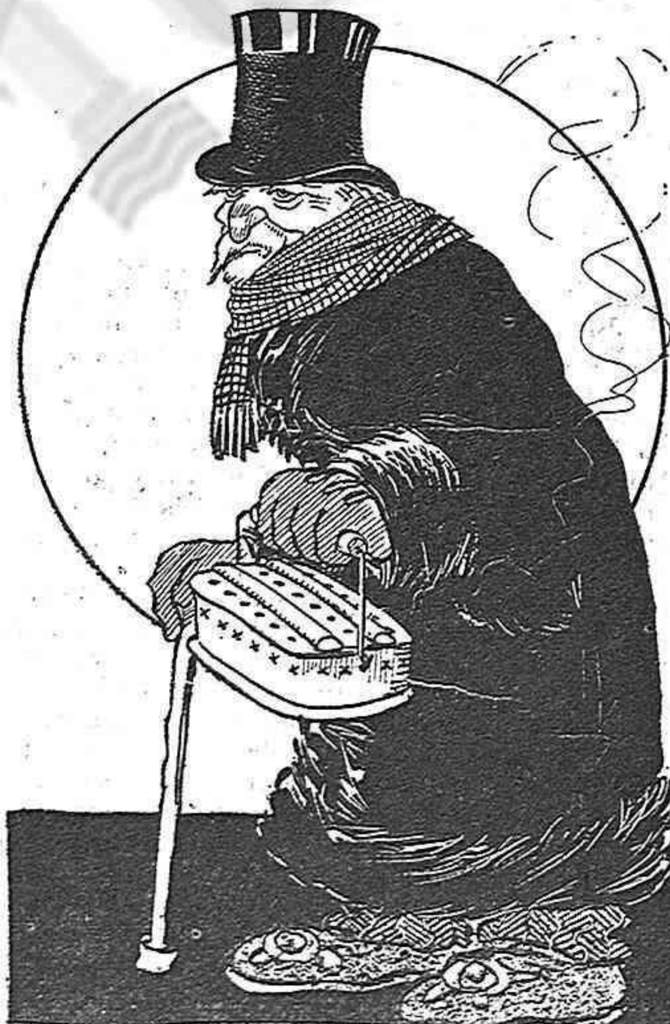
—No m' enfadaré may més ni demanaré em- pleos pels meus gendres.