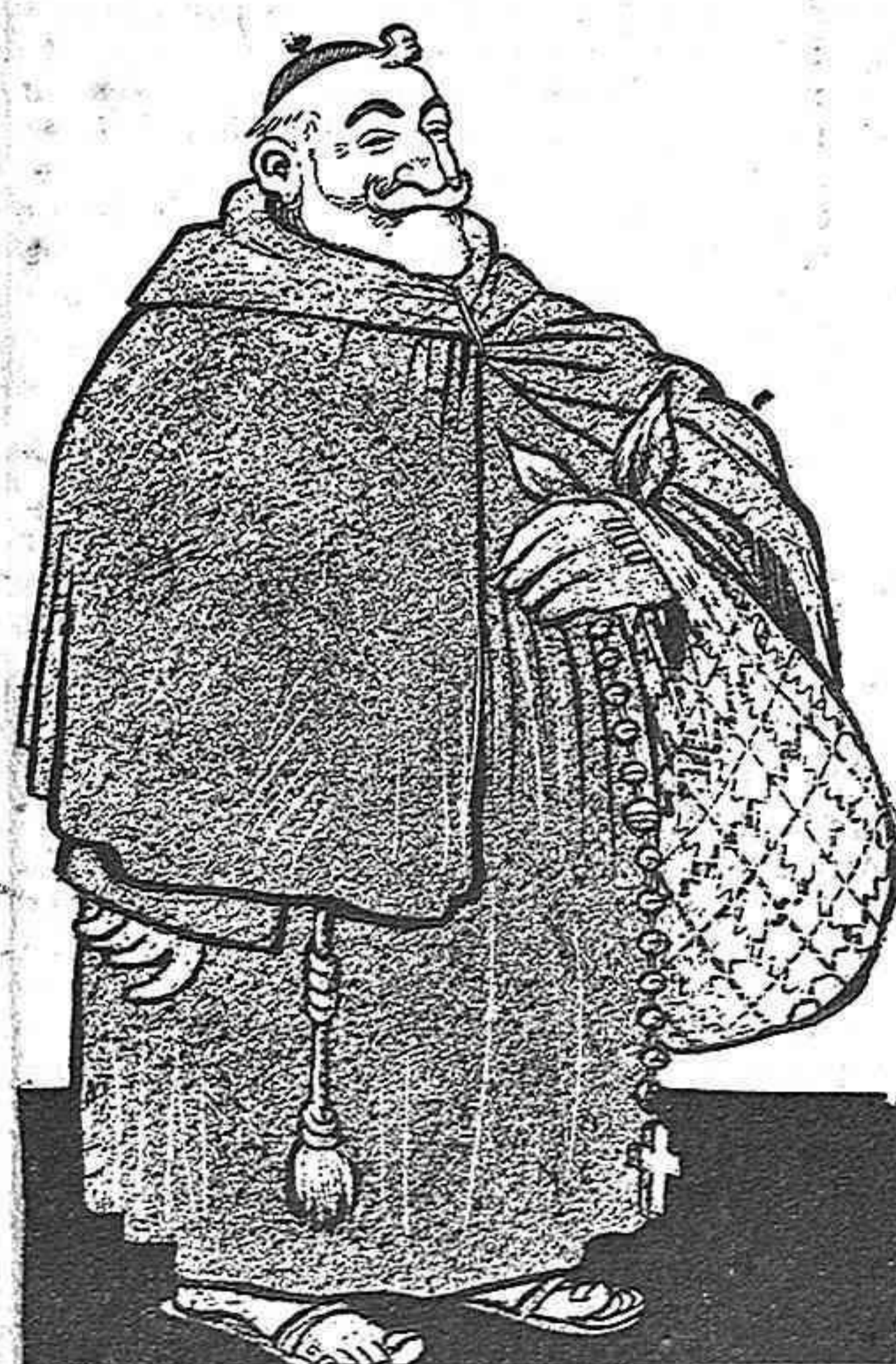
—Fundaré un convent de frares mendicants.