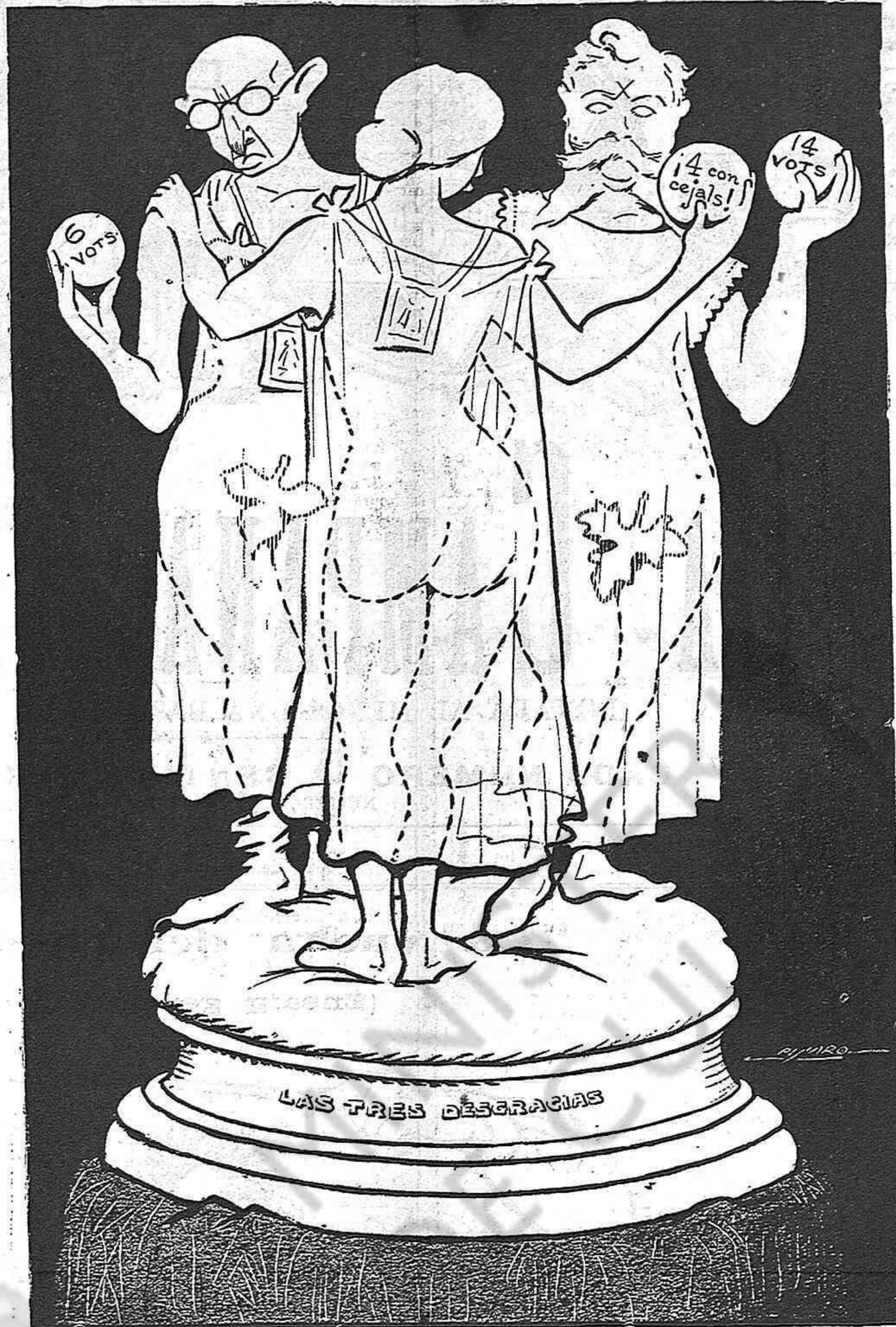
La Lliga, la Conservadora y la Defensa Social.

trari a l'obra d'esquerra, d'atentatori a la llibertat progressiva, a l'emancipació del jou eclesiàstic, a l'encaminament cap al socialisme.