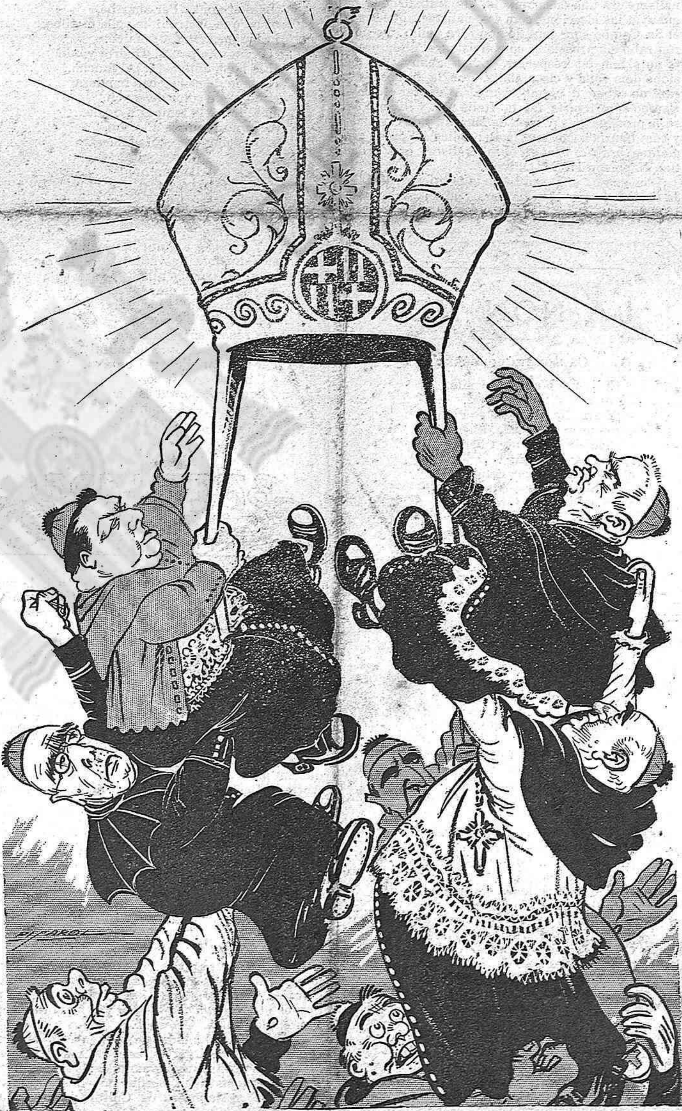
¡Mireulos cómo se barallan, atrets pel preciós esqué! Ara la qüestió es aquesta: ¿Qui hi arribará primé?