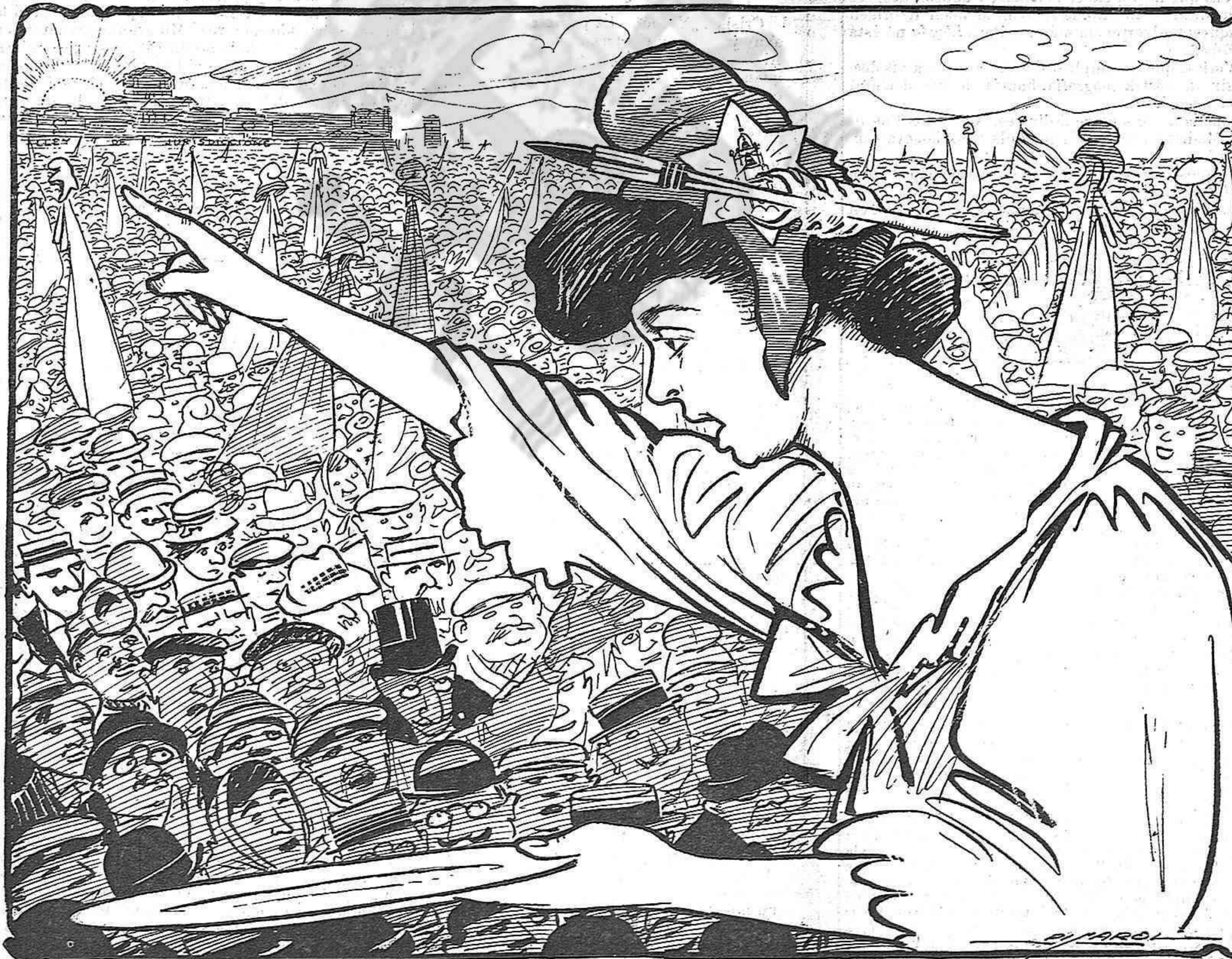
—¡Cataláns, cinch céntims cada hú tots els mesos, y als nostres germáns no 'ls faltará res... sinó la llibertat!