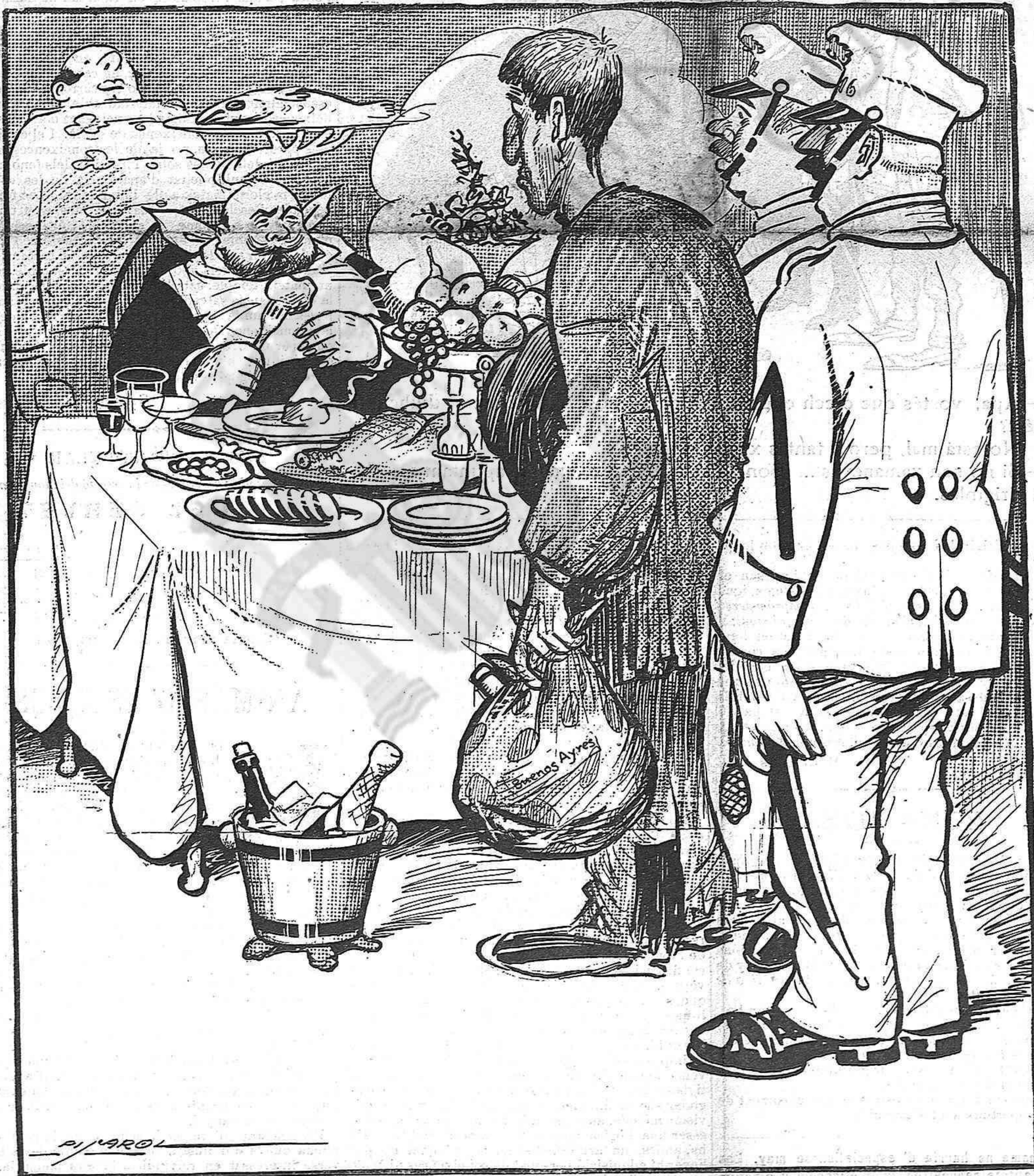
—De manera que volíau emigrar... ¿Pero per qué, bon home? Me sembla que aquí no s'hi está pas tan malament.