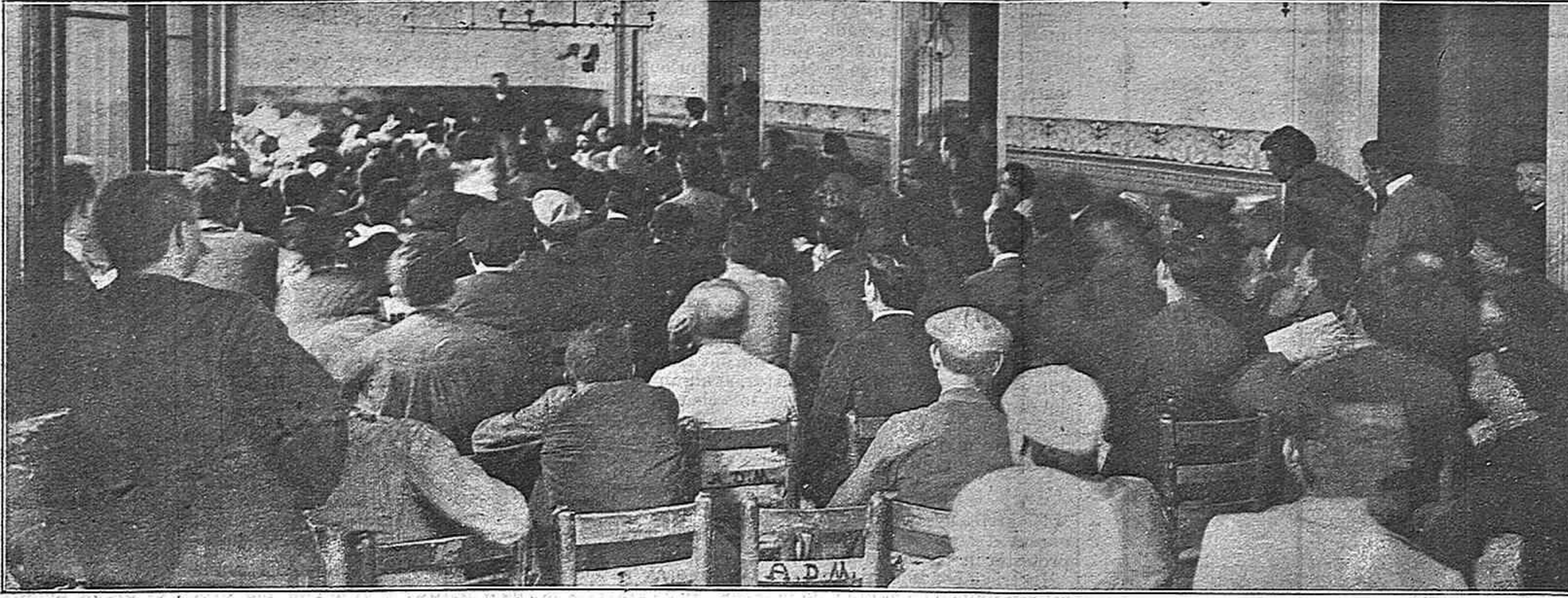
Celebrat en el local de la Solidaritat Obrera els dies 6, 7 y 8 del corrent mes.

qüència consisteix en pensar sempre lo mateix y obrar del mateix modo tota la vida: si per cas, aixó es la conseqüència d' un guarda-rodas, pero no la del home de senderi. Las ideas han de ser amotilladas á las circunstancias de la época, tenint compte per aixó en que no perdin la substancialitat que las abona, y per conseguirho l' oportunitat es el millor conseller.