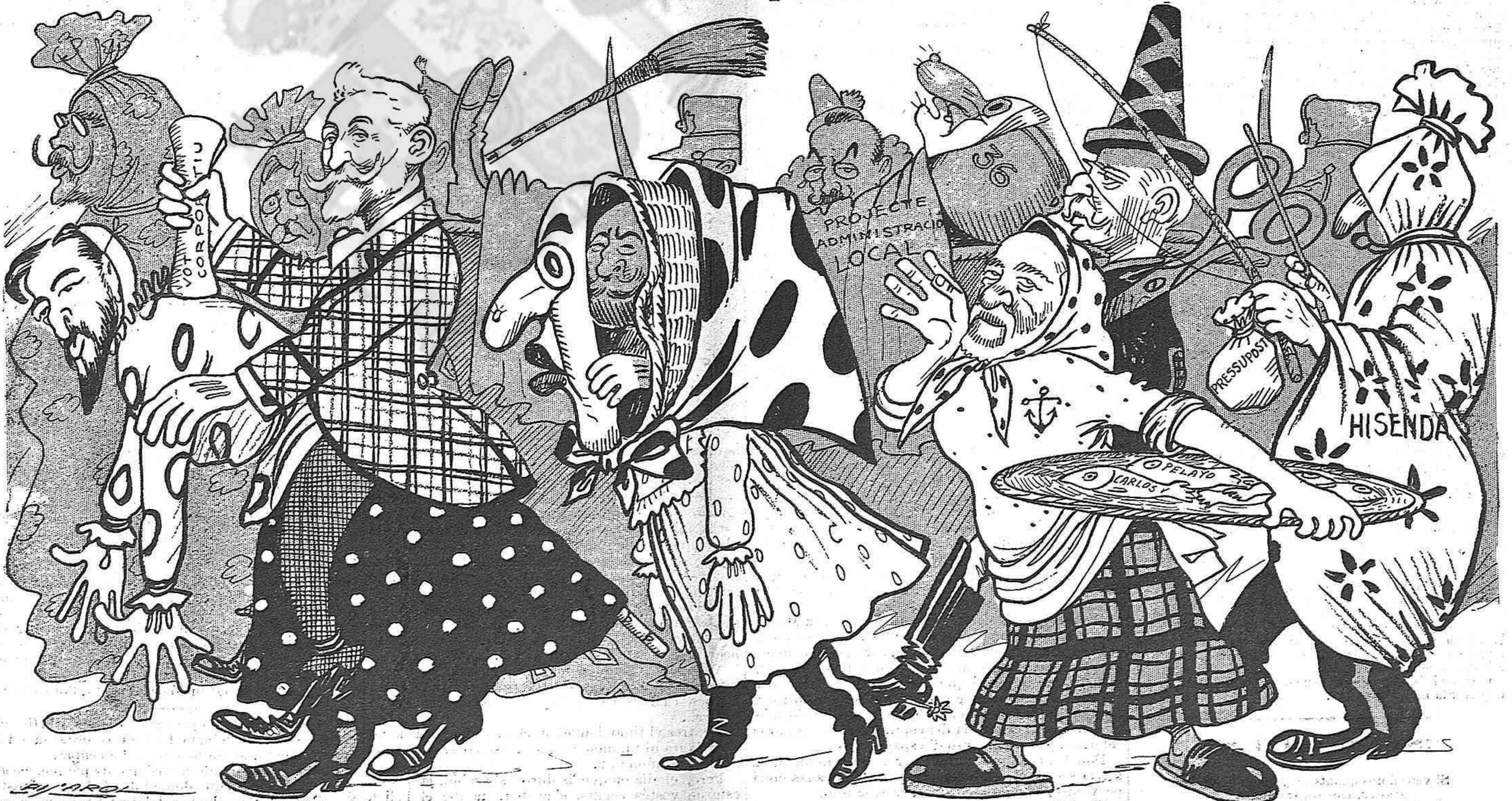
La comparsa madrilenya.