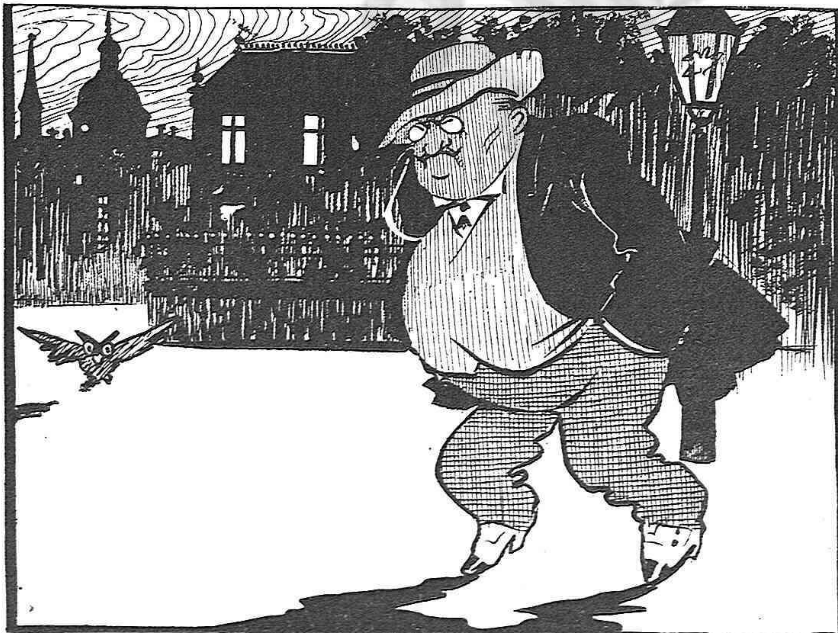
Al arribar á Madrit comensará á pensar que, per gana que tingui, en Salmerón y 'ls dignes representants de la Unió republicana son molt durs de pelar.