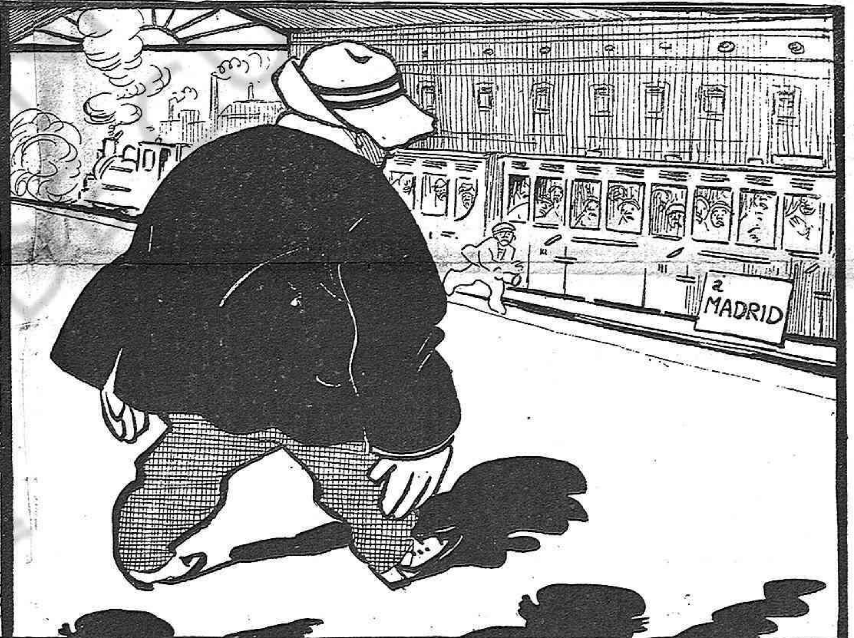
Al emprendre 'l viatge, si algú li pregunta per qué está tan pansit, dirá que s' ha purgat, pera tenir mes gana.