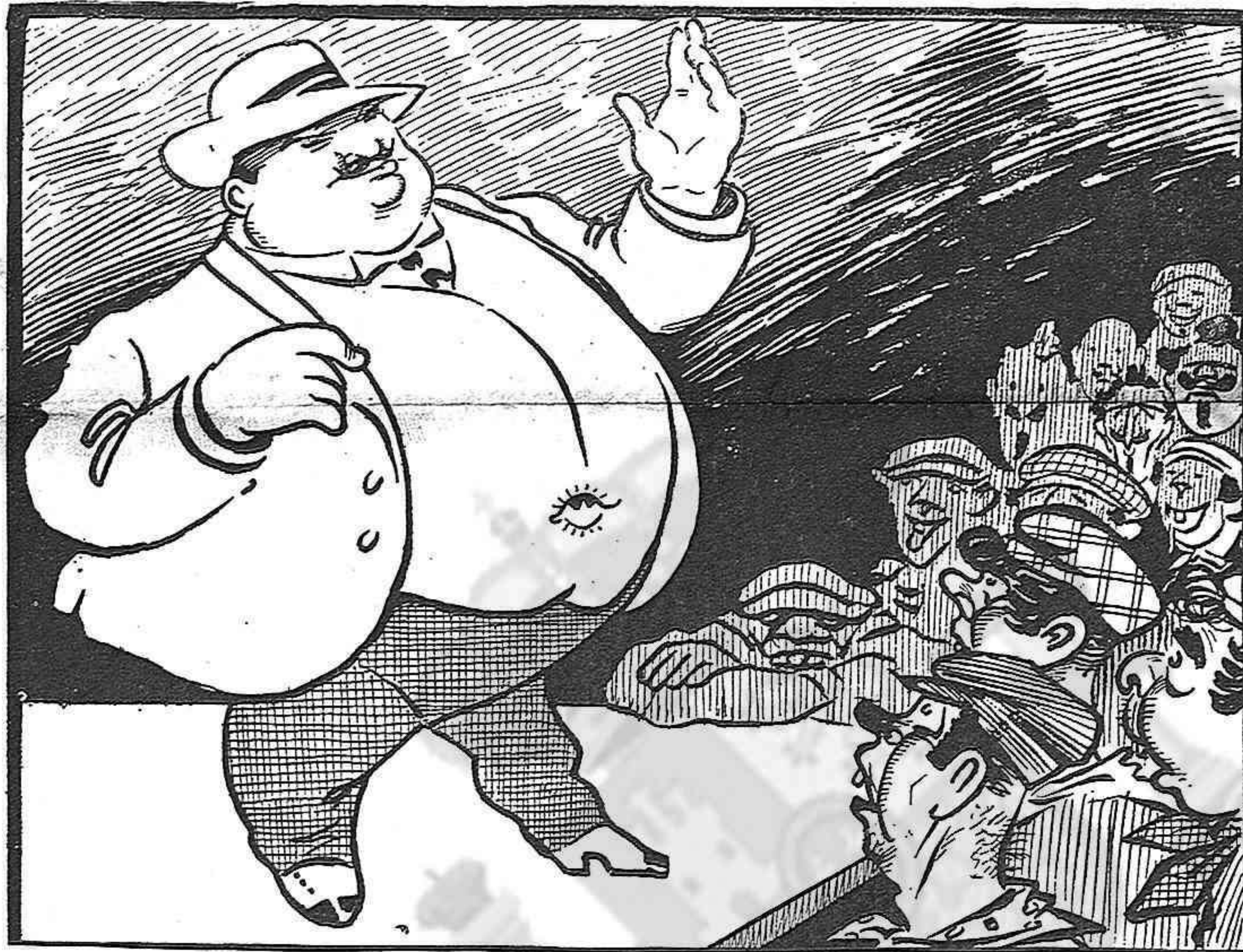
—Ciudadans: A Madrit me 'n vaig, y á n' en Salmerón y á tots els traidors que 'l segueixen ¡me los como!