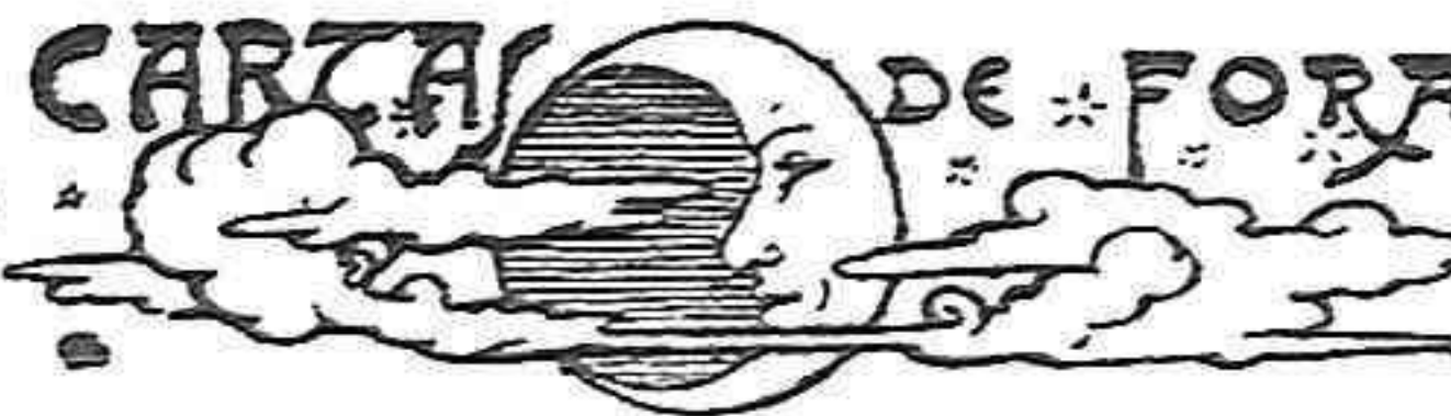
SERÓS, 27 de janer

Y aixís succehi. Ja tothom ho sab que aquí certes cosas no succeheixen, sino quan l' héroe de la Revolució se troba lluny, molt lluny, en un siti segur ahont els esquitzos no pujan arribarhi.