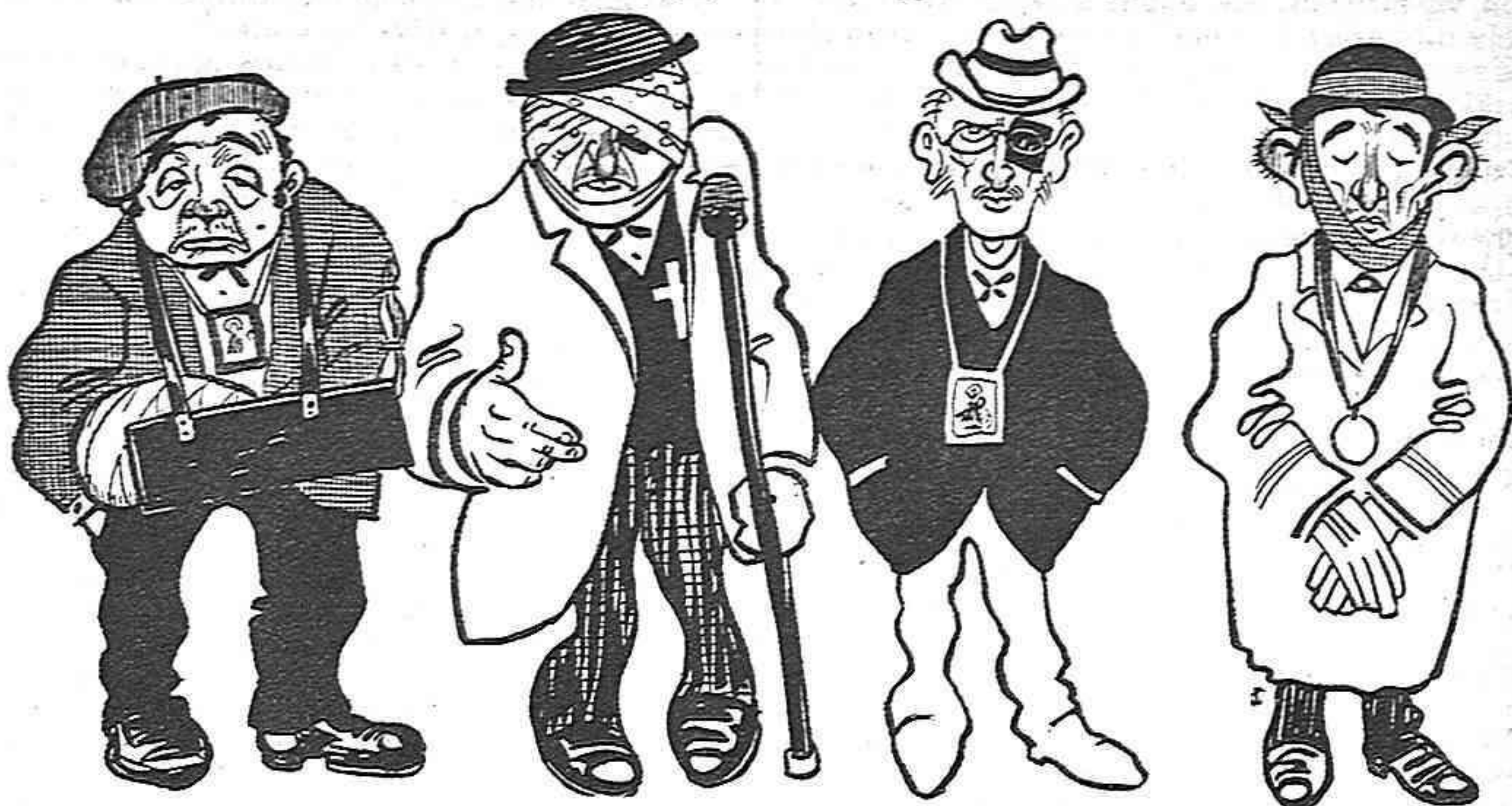
Els que protestaven contra la llei d' Associacions.

—Bueno; y ara que la tal llei s' ha tornat aygua poll, ¿quí 'ns paga las desfilas?