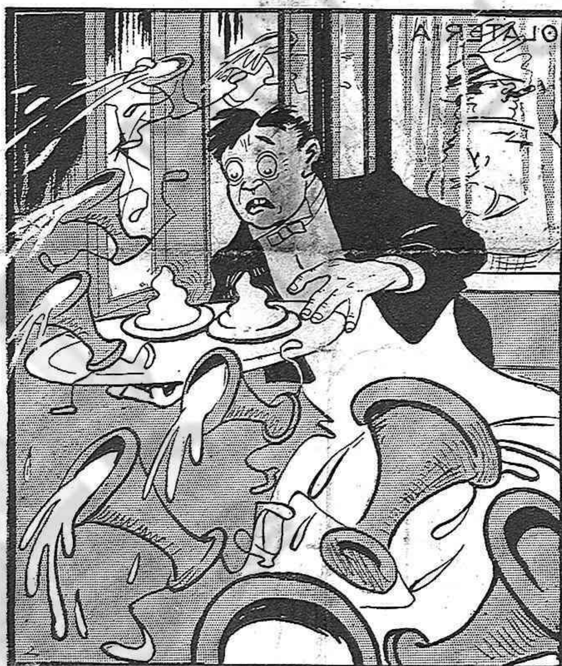
els matóns de las xacolerías,