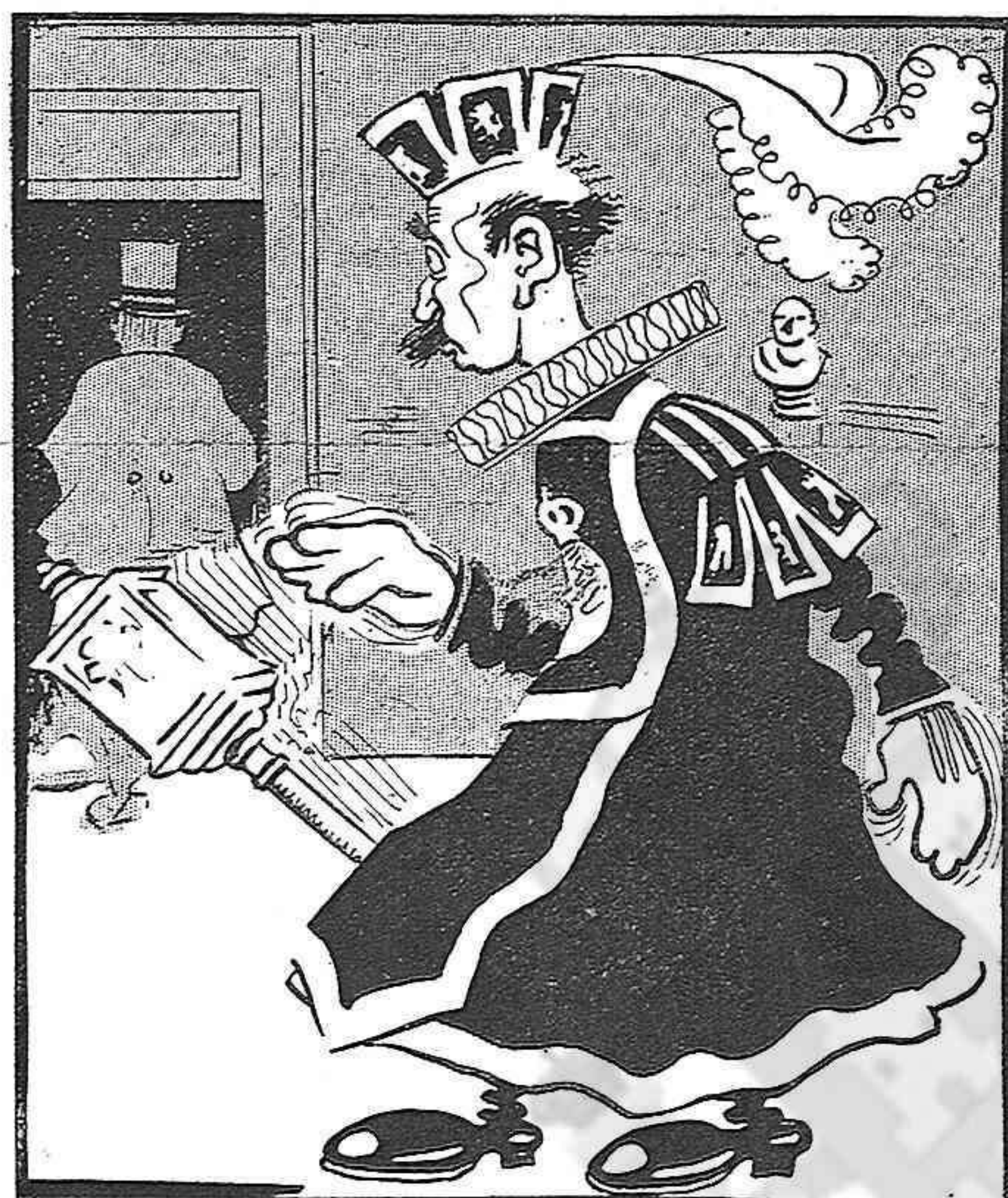
Es tan tremenda la por que fa, que quan la gent el veu, tothom tremola. Els massers del Congrés,

Inspirat en un article de El Progreso del día 8 del corrent.