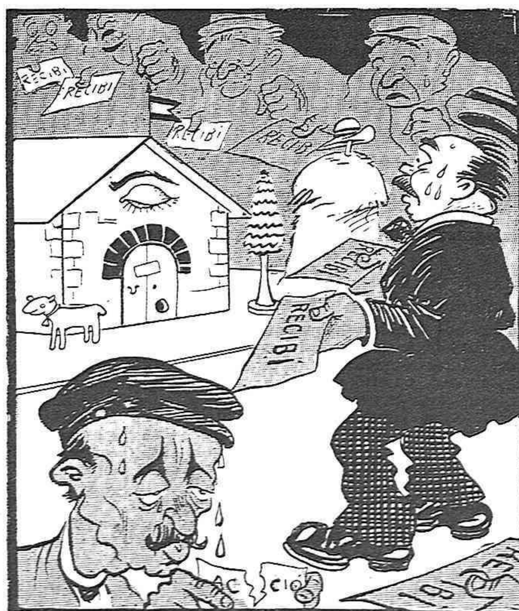
Pero 'ls que tremolan més que ningú son els que tenen algun compte que cobrar de la Casa del Pueblo.