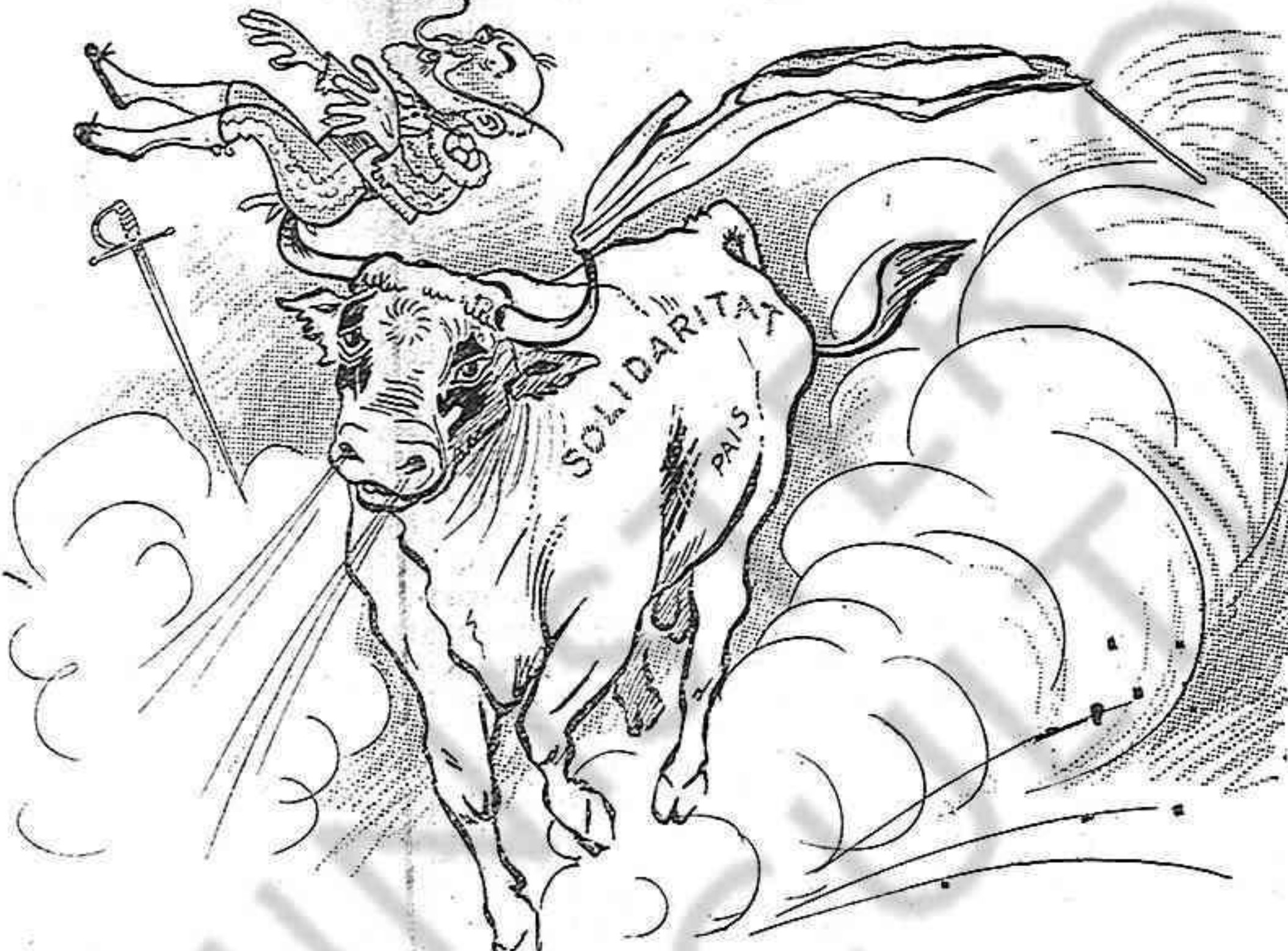
La gran cogida del sigle!