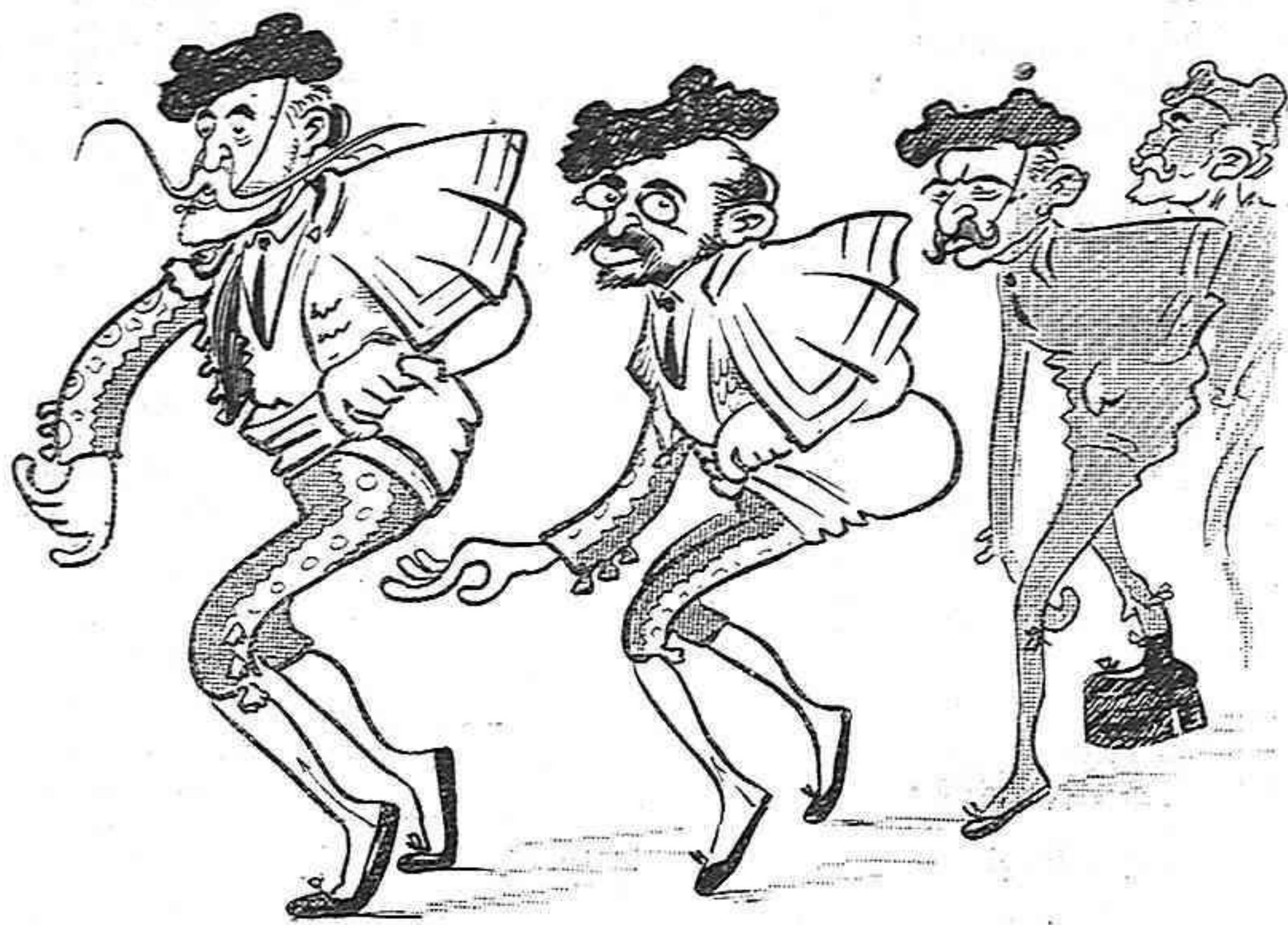
Sortida dels matadors.