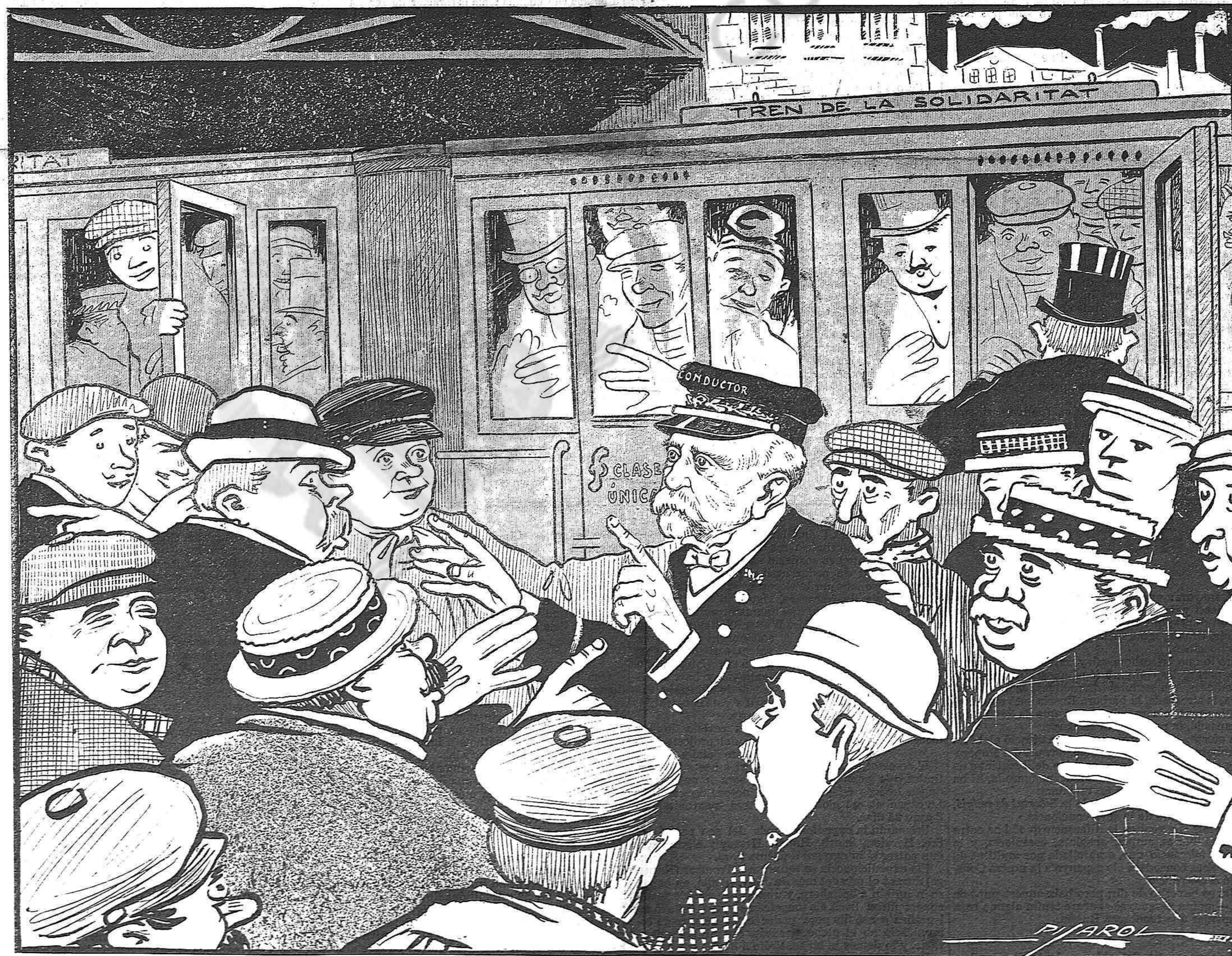
EL CONDUCTOR:—Pujin, senyors; pujin y pósense allà hont vulguin. En aquest tren no hi ha classes.