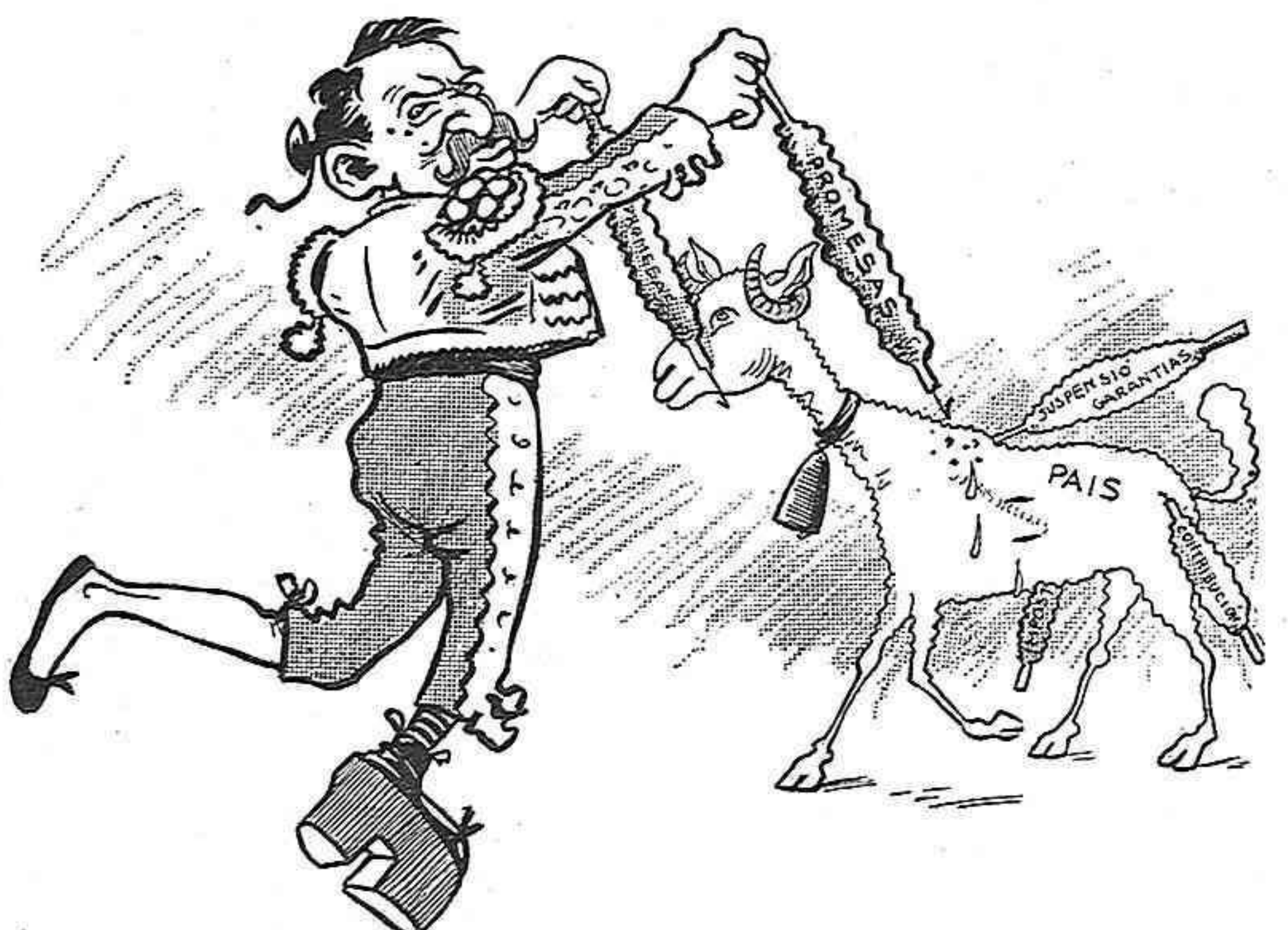
Banderillas al quiebro.