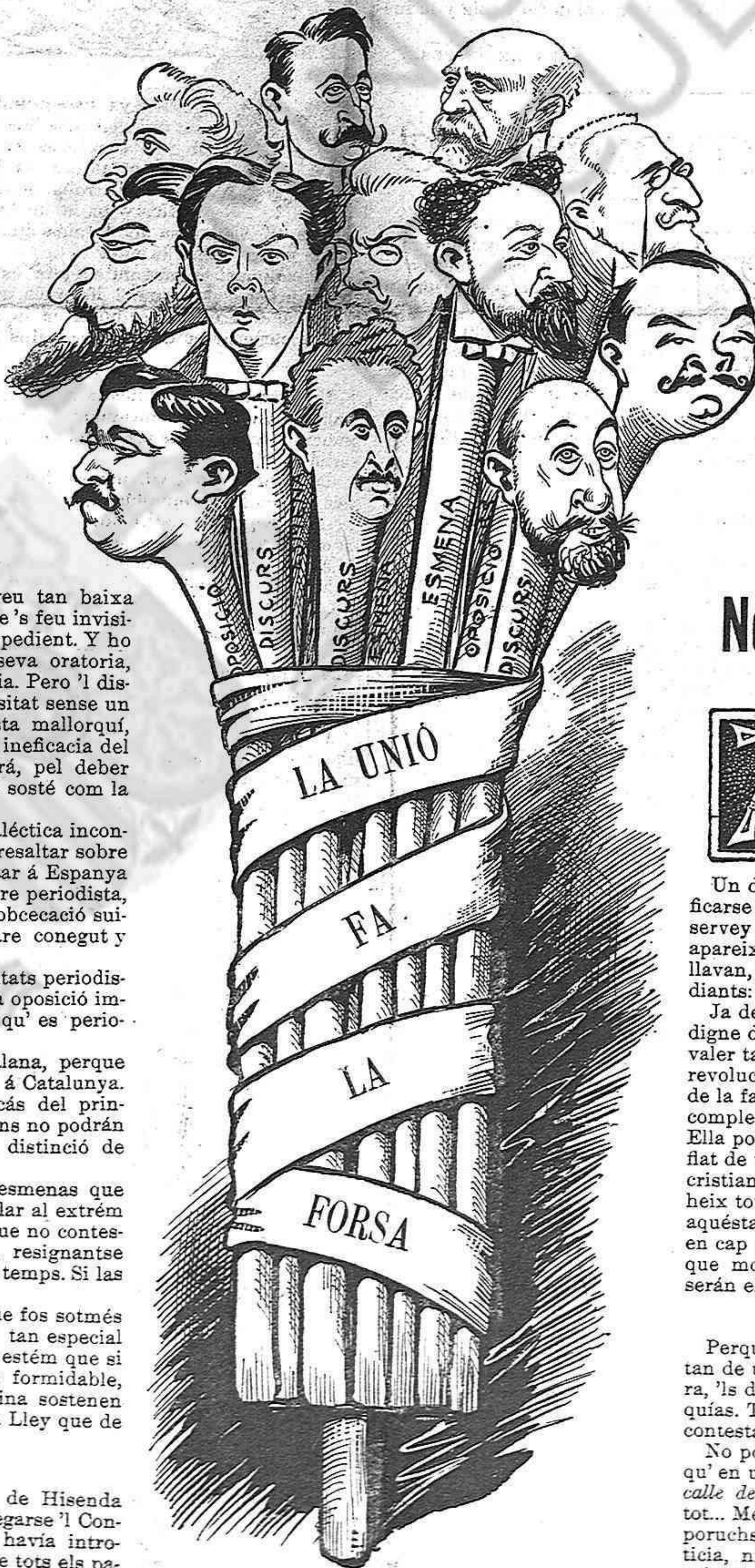
Aixís se va á tot arreu.

Pero 'l ministre ha declarat ademés que ja estava cuyt de la dependencia, de la subjecció del partit lliberal á n' en Maura. En Salvador se retira á lo millor dels seus éxits; quan el cambi dels franchs baixava ab rapidés y ab tendencias