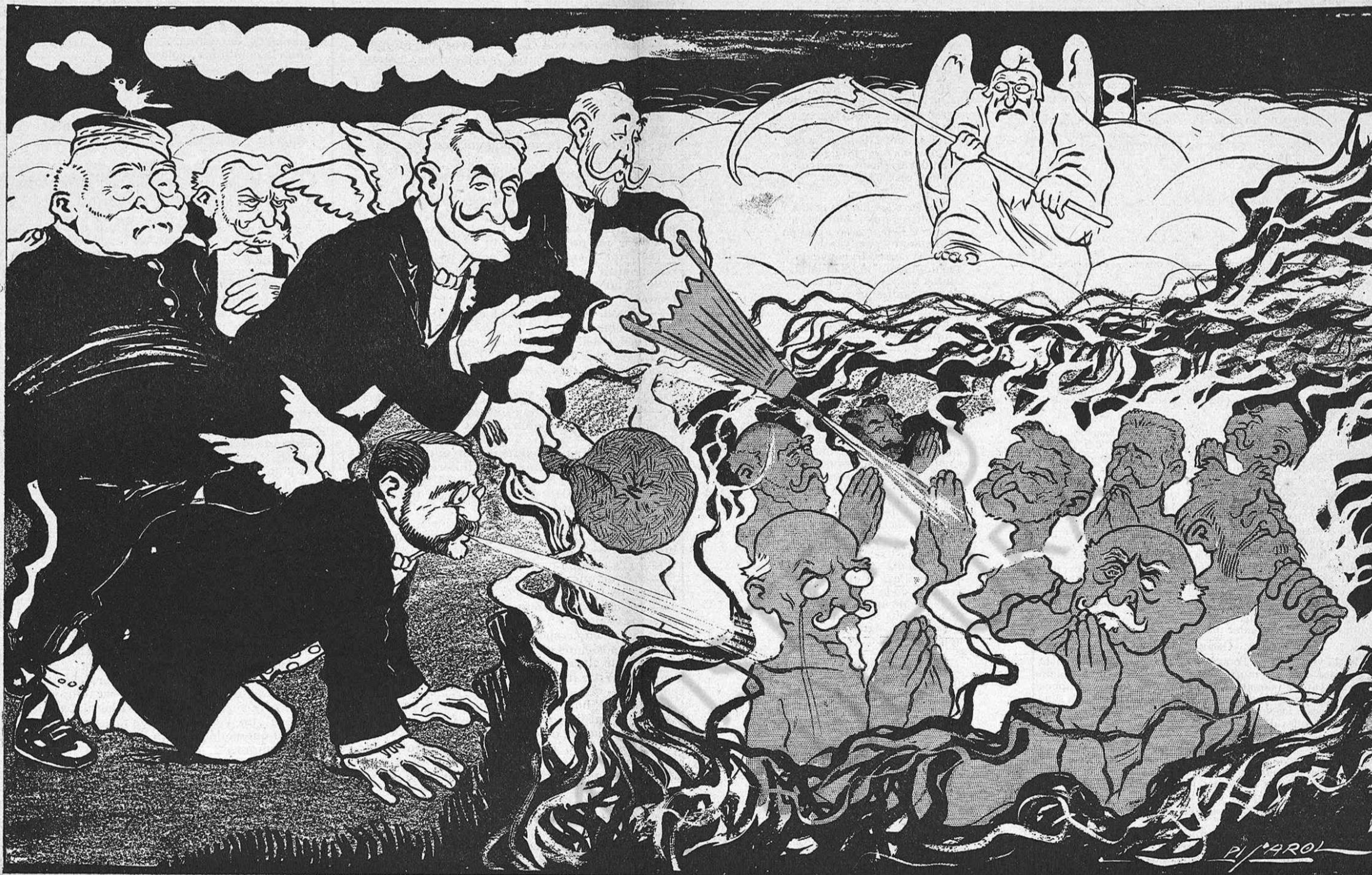
Combatuts per totes bandes, tips de ranxo... y de bolets,