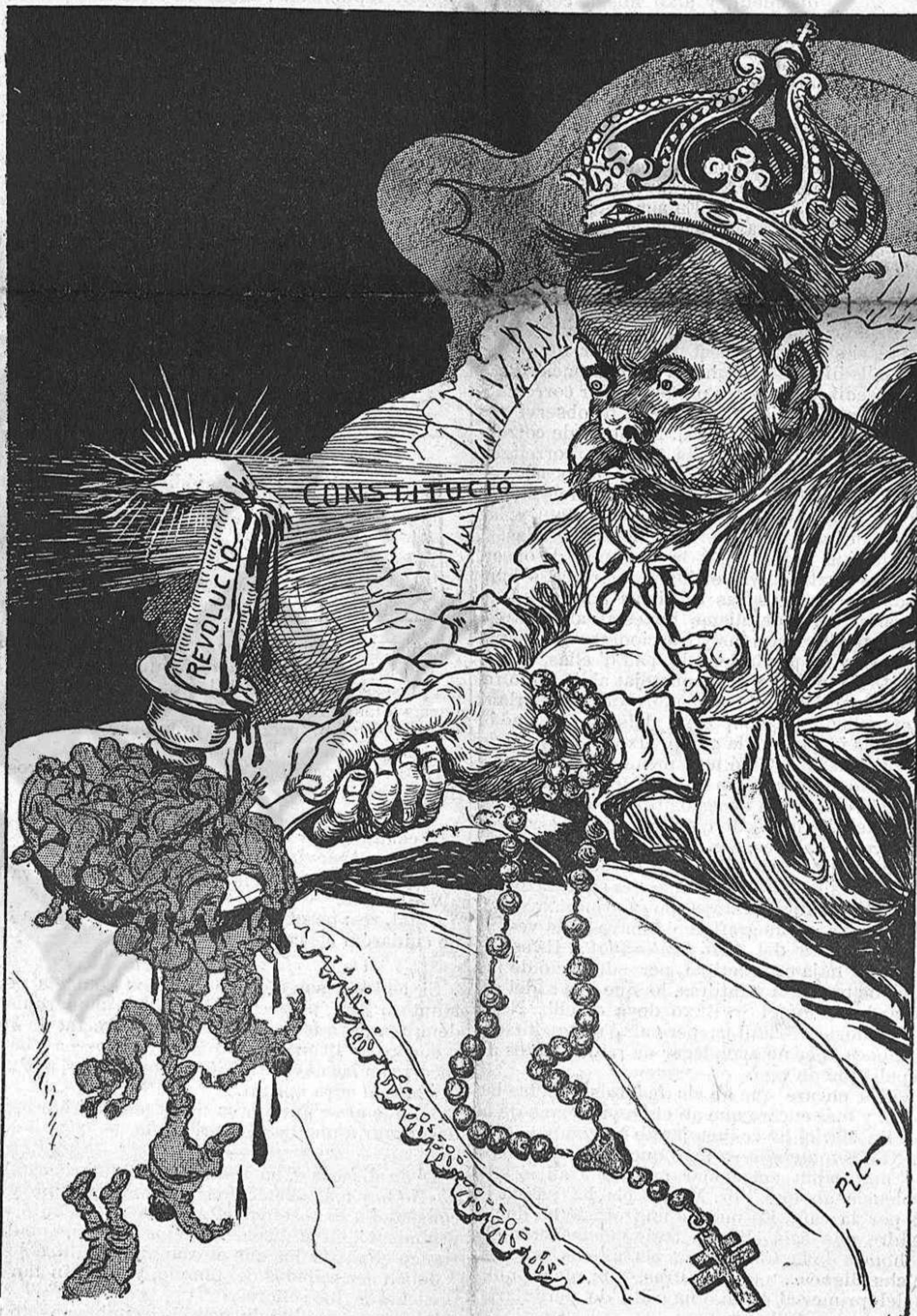
—¡Dimontri de llum!... Per més que bufo, no vol apagarse.

sencia a Madrid de vuit voluntaris catalans de la guerra de Africa. L' aspecte dels heroes de la barretina va fer reviscolar per un moment els recorts dels dias en qu' Espanya tenia encare personalitat en el mon, y 'ls espanyols sense distinció de partits ni de regions se commovían al nom sagrat de la mare patria. Han fet més bé per Catalunya, li han captat a Catalunya més simpatias aquells vuit homes rüdos y vells, que tots els companys de causa ab las sevas infulas y pretensions. Per aixó 'ls regionalistas ni tan sols han sapigut associarse a la manifestació, ni tampoch agrahir lo més mínim las corrents de simpatia