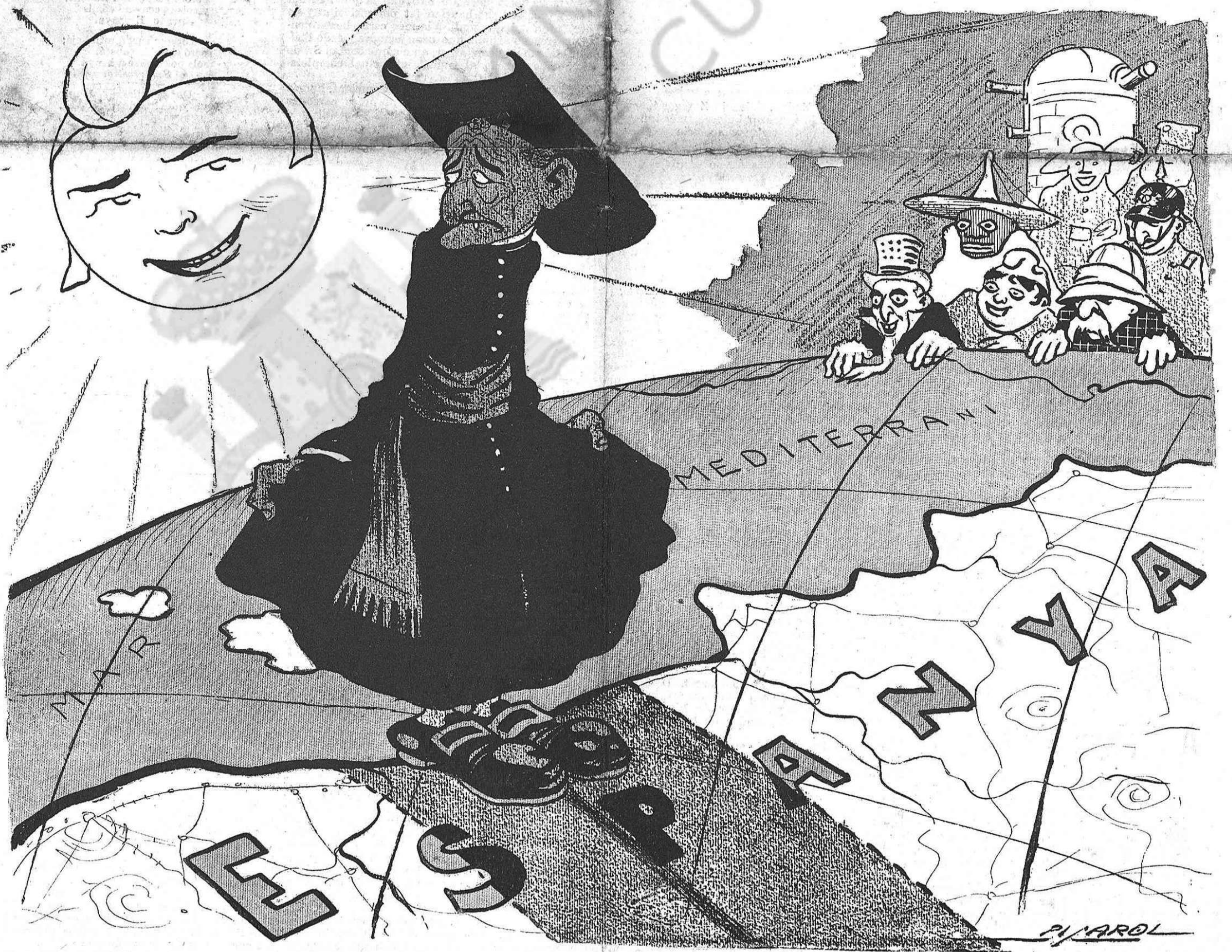
LAS NACIONES EXTRANJERAS:—No hi ha que donarhi voltas: si no treuen aquest trasto que 'ls priva la llum, l' eclipse en aquesta terra será permanent