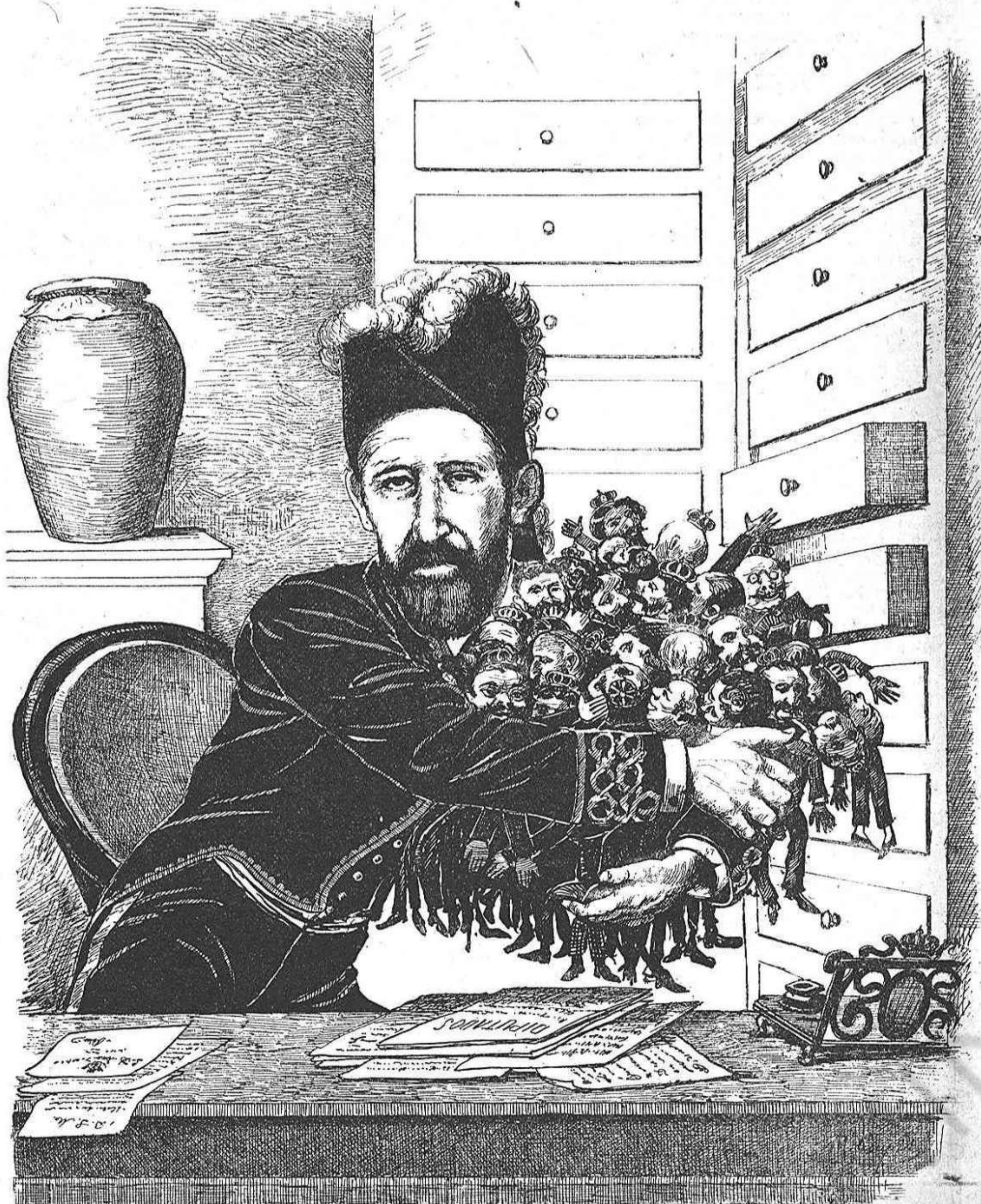
—Miréusels! Ningú 'ls coneix, son tots unes nulitats, y no obstant, costi 'l que costi, ¡haig de ferlos diputats!