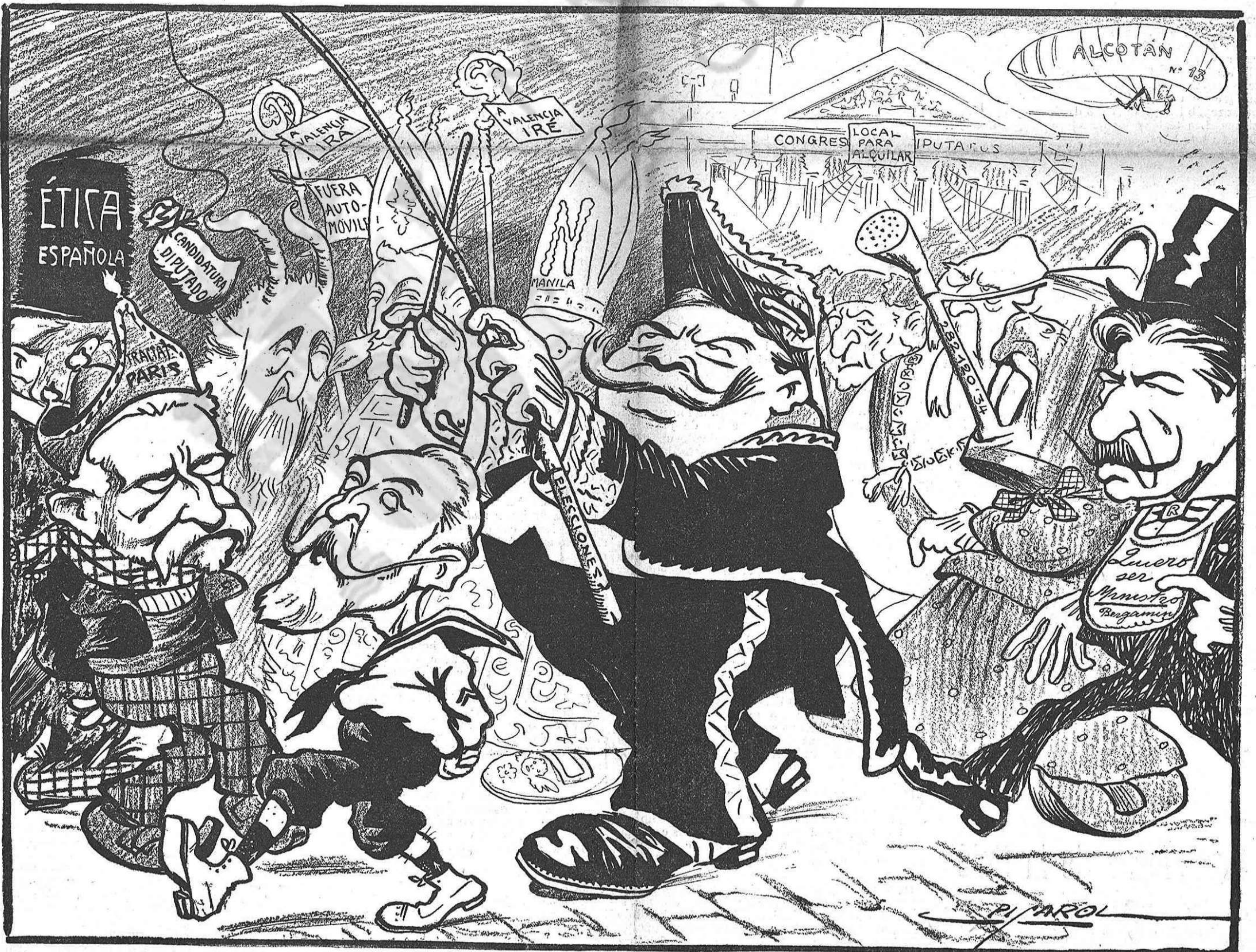
¡Tot per un' acta de diputat provincial!