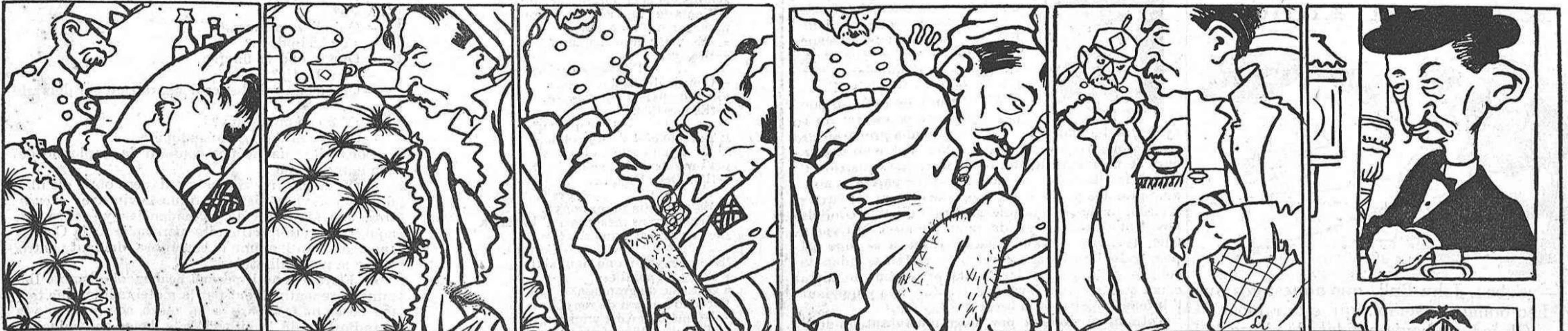
El Sr. Lluch no esta bo: la cosa no sembla grava.