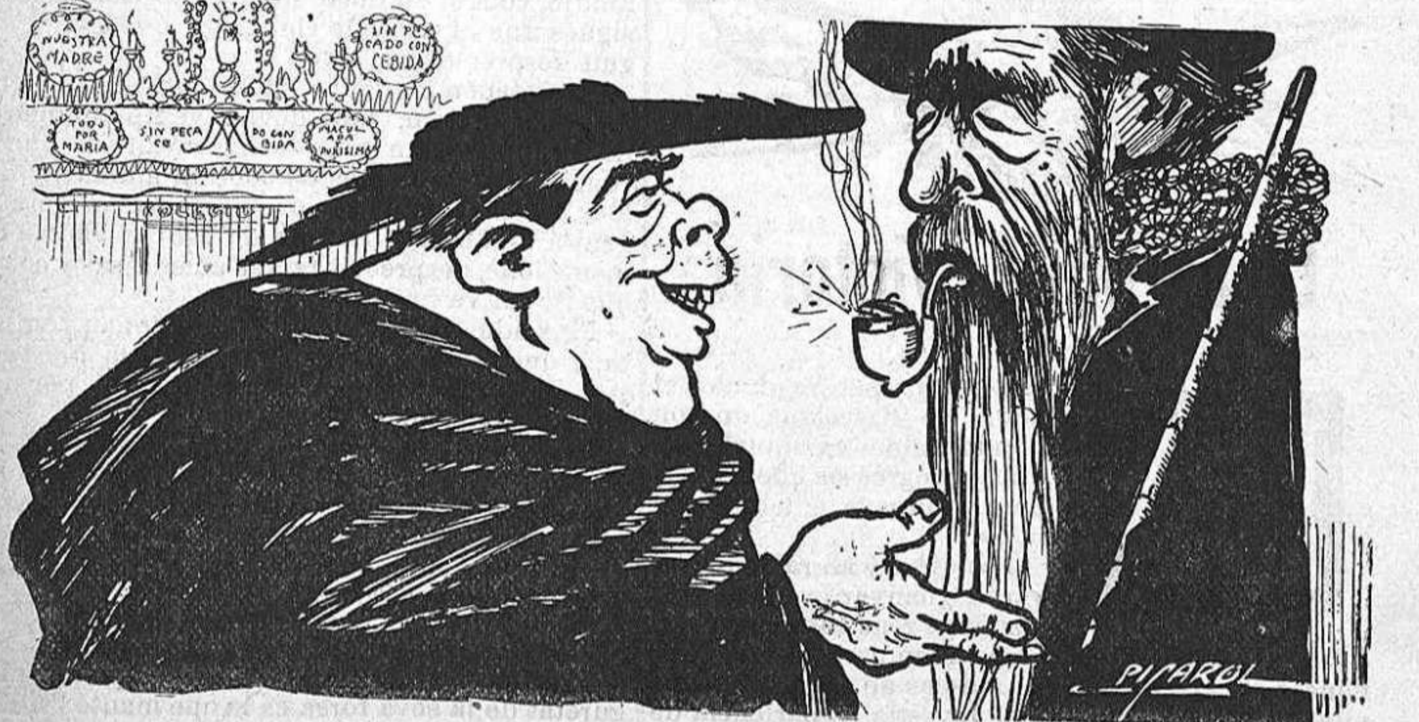
—Vaja, ¿no li sembla que lo de la bomba ha contribuít extraordinariament al bon éxit de la festa?