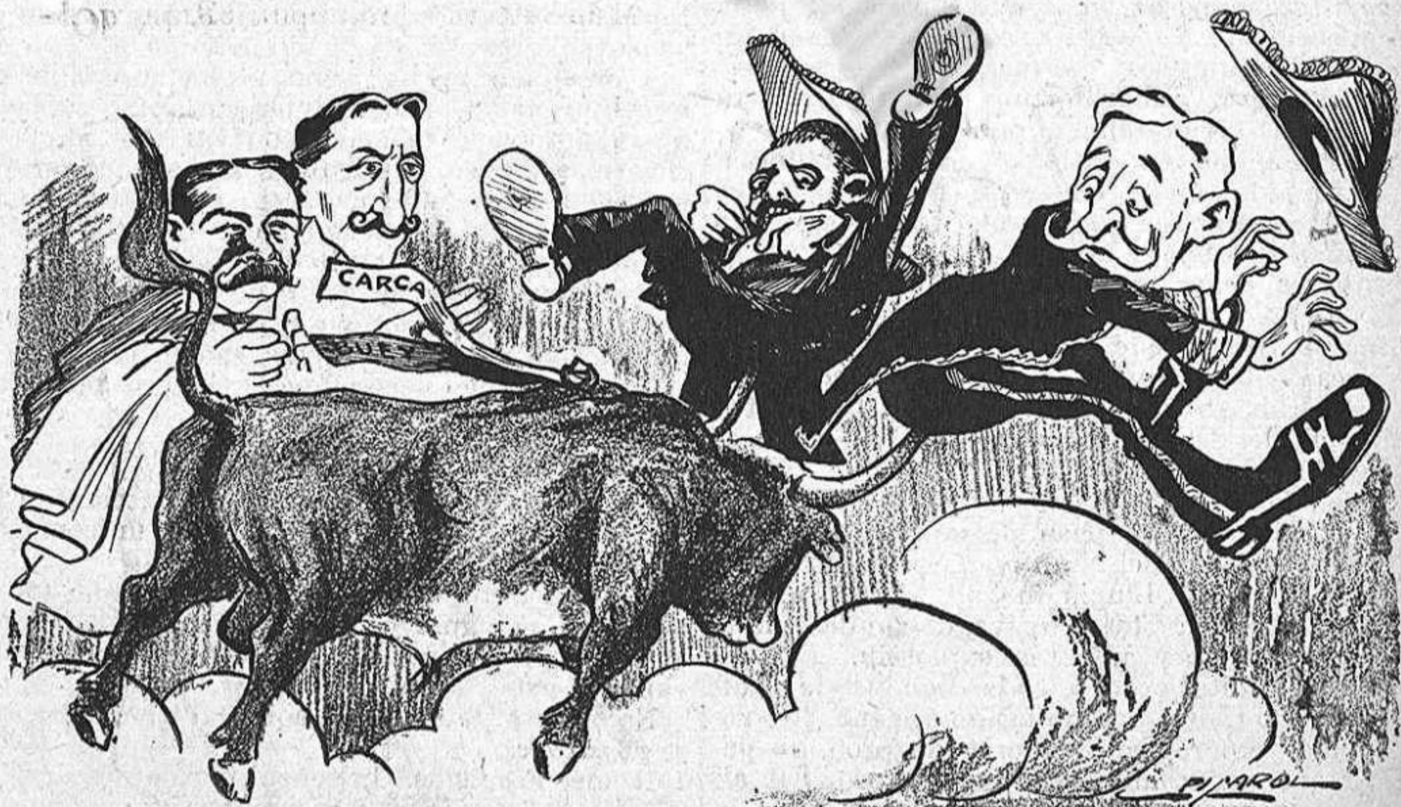
El toro de Carcabuey será de casta petita, pero tot jugant, jugant, ja ha ocasionat dos cogidas.

[Quants lectors del Avi-Brusi, al llegir aquestas barbaritats, prenent el xacolata, farán una ganyota y exclamarán: —Aquest xacolate no s pot sufrir: te gust de cremallot de llantia!