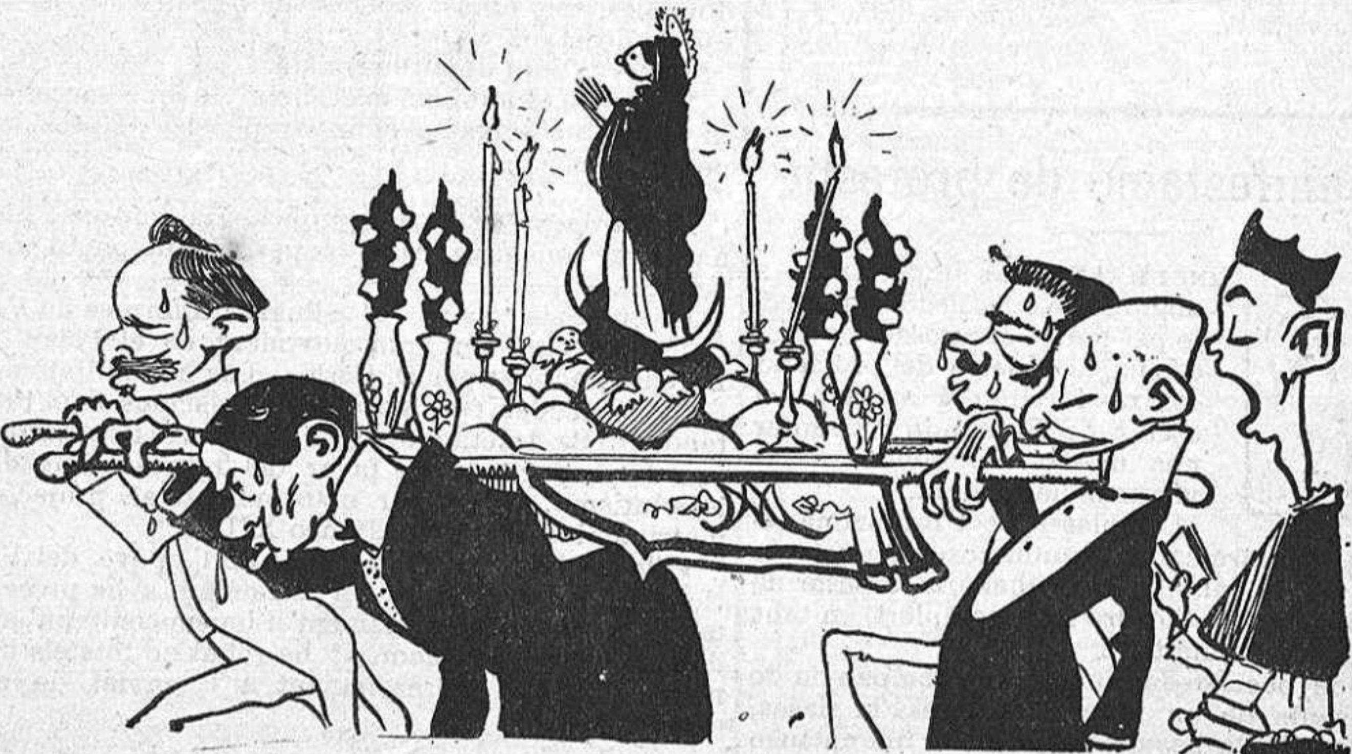
Infracció monumental del descans dominical.