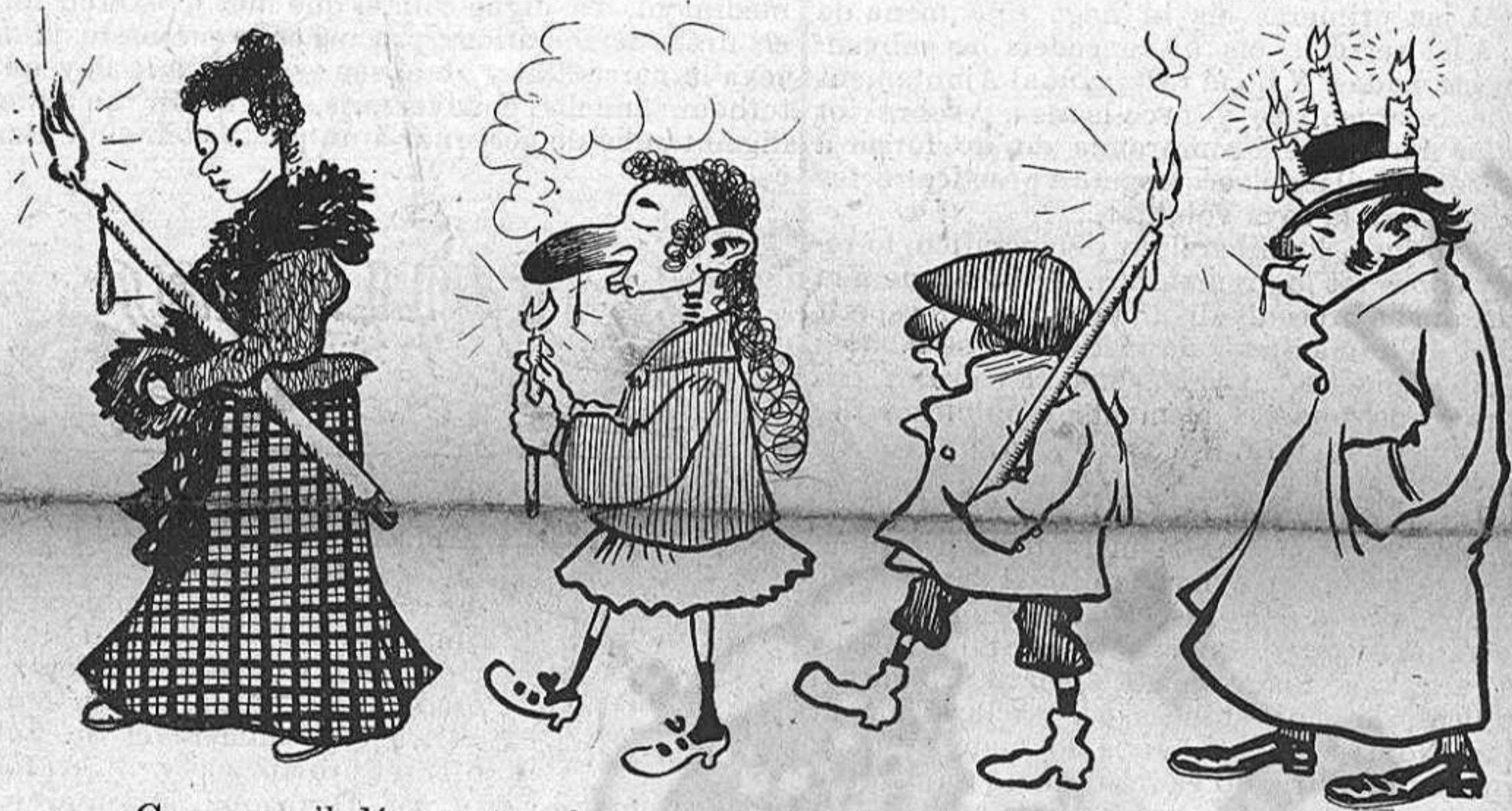
Com que 'l día era tan fret, no estava de més pendre certes precaucions.