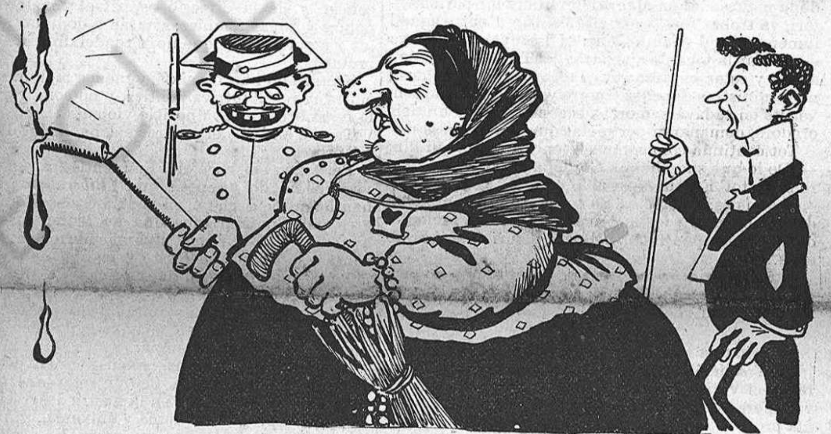
ELLA!—Mentres algun republicanot no 'm fassi alguna cosa... EL GUARDIA:—Viva V. tranquila, señora: á V. nadie es capaz de hacerle res.