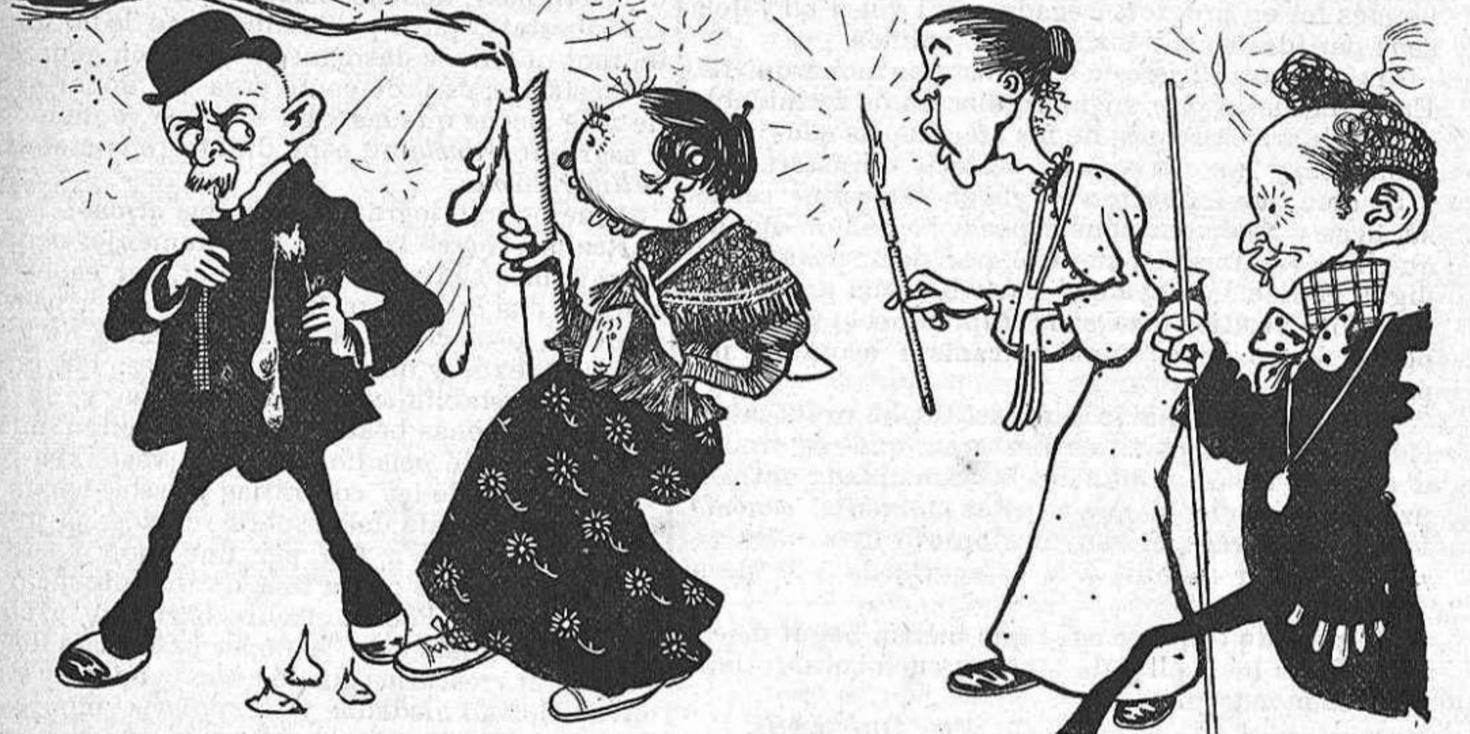
—Noya, si ets immaculada, ¿per qué 'm maculas á mí?