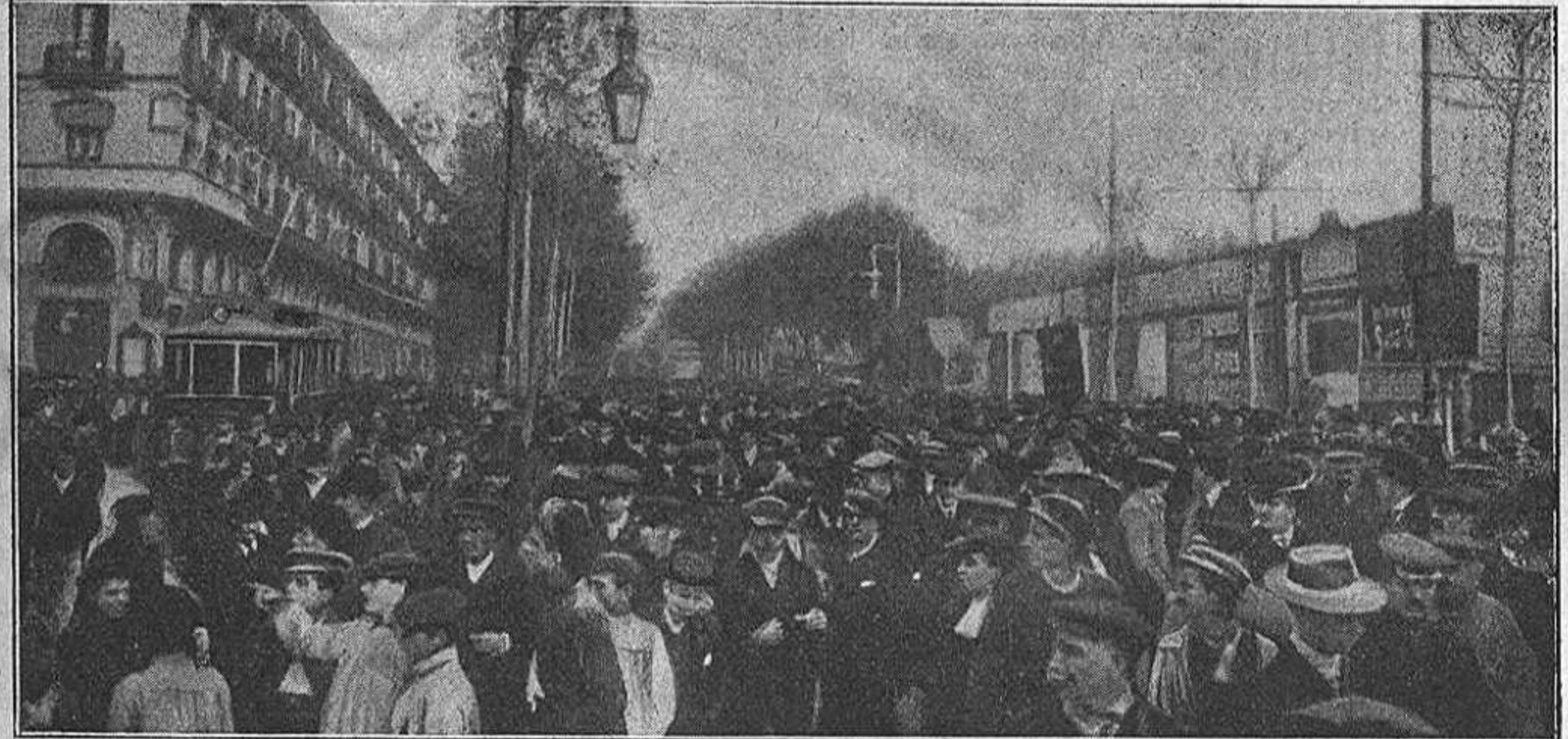
La manifestació, al passar per davant de la estació de Fransa.

y l' forner no sab cóm ferho per cobrar lo que li deuen.